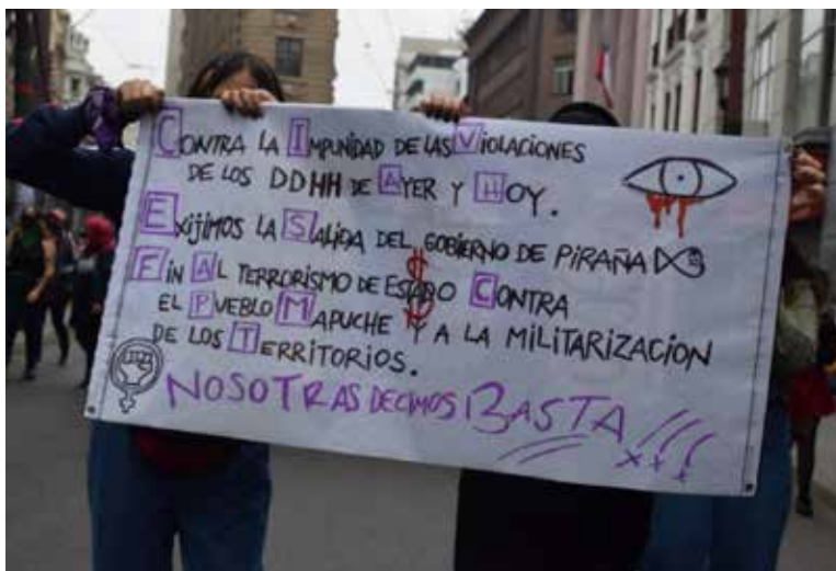
Imagen 14: Cartel “Contra la impunidad de las violaciones de los DD.HH. de ayer y hoy”. (08 de marzo de 2021, Valparaíso).