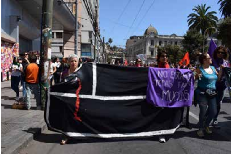
Imagen 6: “No estamos todas, faltan muchas” (08 de marzo de 2020, Valparaíso).

Sin embargo, nos llama la atención que no se reclame por el Estado de Emergencia, ni por el toque de queda presente en Chile hasta octubre de 2021 bajo el argumento de la pandemia, o contra el discurso de la guerra promovido por el propio presidente de la República tras el Estallido Social.