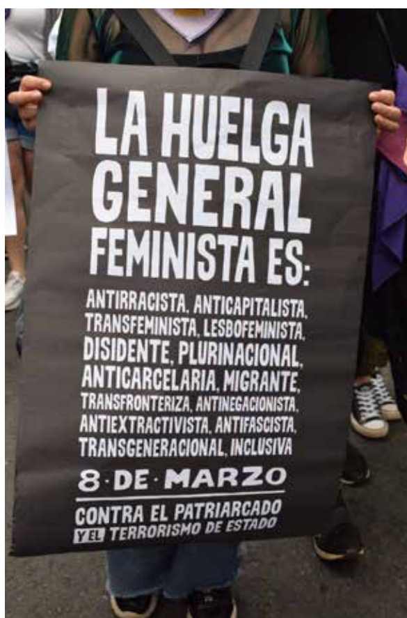
Imagen 7: Cartel “La huelga general feminista es...” (08 de marzo de 2021, Valparaíso).

un problema de equidad en la política pública o, a lo sumo, una reivindicación identitaria. Contrario a ello, tal y como ha desarrollado la crítica feminista (Grau et al., 2020), se trata de imaginar y empujar otros mundos posibles que resultan complicados de explicar en pocas palabras, pero no tan difíciles de trazar en un cartel: “La huelga general feminista es: Antirracista, anticapitalista, transfeminista, lesbofeminista, disidente, plurinacional, anticarcelaria, migrante, transfronteriza, antinegacionista, antiextractivista, antifascista, transgeneracional, inclusiva. 8 de marzo. Contra el patriarcado y el terrorismo de Estado” (imagen 7). Icónicamente se enfatiza en el cartel que “el” terrorismo tiene género masculino. Otro ejemplo del tipo de acto de denuncia que vincula múltiples formas de violencia.