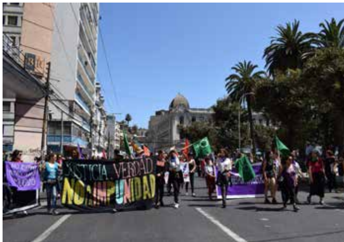
Imagen 4: Lienzo “Justicia, Verdad, No a la Impunidad” (08 de marzo de 2020, Valparaíso).

El segundo grupo de denuncias pone en primer plano los valores políticos ligados al paradigma de los derechos humanos, entre ellos, alusiones a la libertad, la justicia y la verdad. Por ejemplo, “Justicia, verdad, no a la impunidad” (Lienzo colectivo de mujeres) (Imagen 4).