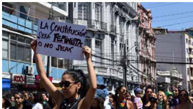
Imagen 15: “La Constitución será feminista o no será”. (08 de marzo de 2021, Valparaíso).