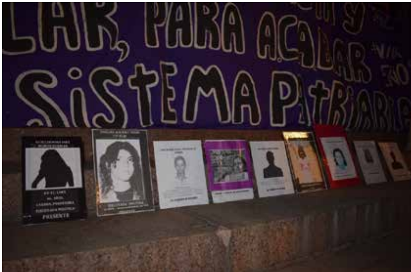
Imagen 9: Carteles de detenidas desaparecidas (08 de marzo de 2017, 8M_V_2017_316-317, Valparaíso).

Tal como ocurre en los actos que conmemoran fechas ligadas a la dictadura, cuando las memorias de ese pasado violento circulan en el 8M, lo más común es que lo hagan enmarcadas en el paradigma de los derechos humanos. Consecuentemente, se repiten las consignas que demandan “justicia, verdad, no a la impunidad”. Del mismo modo, casi siempre van acompañadas de un grito que se revela frente al intento de reconciliación y/u olvido aludiendo al clásico “ni perdón, ni olvido”. Así, por ejemplo, al finalizar la marcha del 8M de 2017, que ese año logró llegar a las escalinatas del Congreso Nacional (algo que no ocurre comúnmente porque la policía suele frenar con carros antimotines el avance hasta las inmediaciones de dicho edificio), se puso un cartel que con plumón rojo decía: “Juro que las he visto portando lienzo que NO OLVIDAN ni PERDONAN. ¡¡Presentes ahora y siempre!!” (fotografía 8M_2017_314). Ese cartel estaba rodeado de otros donde se exponían diferentes fotografías de mujeres detenidas desaparecidas con las frases “Ni perdón ni olvido y verdad, justicia, no más impunidad” (fotografía 8M_V_2017_316-317). Así, observamos que el 8M ya vehiculizaba artefactos de memorias de la dictadura antes del Estallido Social.