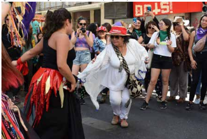
Imagen 8: Cueca entre mujeres. (08 de marzo de 2020, Valparaíso).