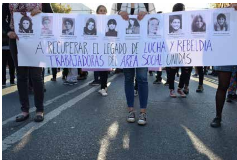
Imagen 13: Lienzo “A recuperar el legado de lucha y rebeldía” (08 de marzo de 2018, Valparaíso).

Como ocurre siempre con los trabajos de la memoria, se retoma una herencia no solo para honrar el pasado, sino para disputar el presente donde el feminismo se articula contra todas las formas de dominación. Y ello se hace desde los nuevos sentidos que moldean las memorias, como ocurre con la proclama del bloque feminista antirracista en 2021 (Imagen 14) que subraya la palabra “Basta”: “Contra la impunidad de las violaciones de los DD. HH de ayer y hoy. Exigimos la salida del gobierno de Piraña. Fin al terrorismo de Estado contra el pueblo Mapuche y a la militarización de los territorios. Nosotras decimos BASTA” (Fotografía 8M_2021_0064).