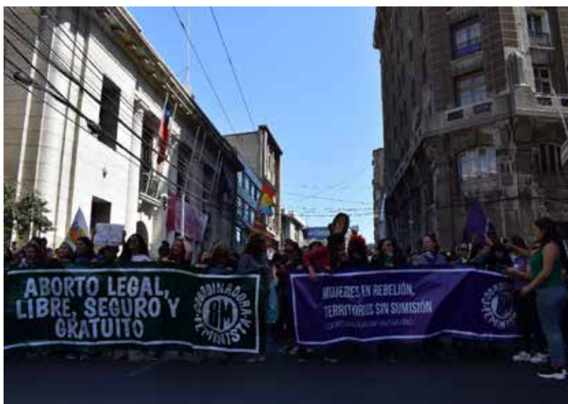
Imagen 5: Lienzo “Mujeres en rebelión” (08 de marzo de 2021, Valparaíso).

Asimismo, muchas de las denuncias expresadas en los carteles pueden interpretarse también como un legado del movimiento DDHH porque se trata de estrategias para hacer visible a quienes no están –marchamos por los torturados/s, por los/as asesinados/as, por los/as presos/as. Consiste entonces en un acto de dar testimonio por aquellas/os/es que no pueden estar presentes, como reclama este cartel: “Por todos los todos los torturados, asesinados, quemados. Yo marchó” Cartel individual (fotografía 8M_2020_0362) o la leyenda “No estamos todas, faltan muchas” que se inserta en un gran lienzo en el que se transforma la bandera chilena reemplazando sus diferentes colores por un negro luto y