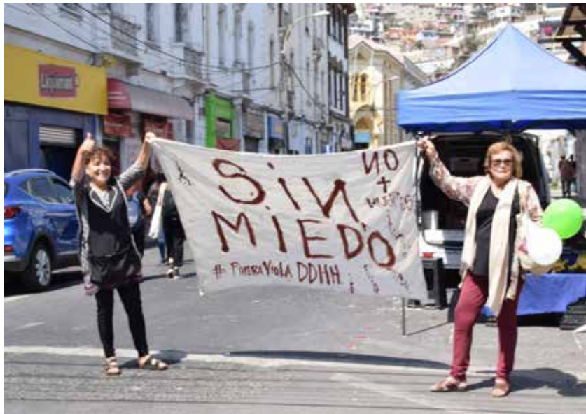
Imagen 12: Lienzo de mujeres de distintas generaciones “Sin Miedo”. (08 de marzo de 2020, Valparaíso).

Todo esto no parte con el Estallido social, sino que empezó a fraguarse antes. Es en el 2018, el año del Tsunami Feminista, cuando capturamos un lienzo (Imagen 13) que rebela mucho de lo que queremos mostrar: las jóvenes feministas no solo hacen memoria de las