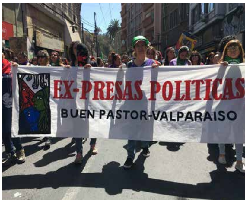
Imagen 11: Lienzo “Ex-Presas Políticas. Buen Pastor-Valparaíso. (08 de marzo de 2020, Valparaíso).

La repetición de las consignas en contra del olvido y la impunidad suelen ir de la mano del esfuerzo por visibilizar a quienes están ausentes debido a la represión política de la dictadura. Allí ha sido muy relevante poner rostro y cuerpo a las detenidas desaparecidas, tal como mostramos más arriba, pero además resulta significativo que se comience a dar mayor visibilidad a las ex presas políticas sobrevivientes. Esto último es importante no solo porque expone las marcas de género de la represión, y particularmente las deudas pendientes en materia de reparación, sino también porque el Colectivo de Ex Presas Políticas del Buen Pastor de Valparaíso está integrado por varias mujeres que se reconocen como feministas y combinan esa identificación política con sus militancias de izquierda y sus múltiples compromisos por los derechos humanos. Es decir, el feminismo elabora el pasado de la represión dictatorial de otro modo, haciendo posible evidenciar la dimensión de género de la violencia política (Cruz y Eguren, en edición). Marchar con un lienzo que las reconociera como colectivo que pone cuerpos a la prisión política de la dictadura ocurre precisamente después de la revuelta de octubre, un periodo que ha supuesto nuevamente que personas detenidas y juzgadas por su participación en las manifestaciones se reivindicquen como las y los nuevas/os presas/os políticas/os o “presas/os de la revuelta”.