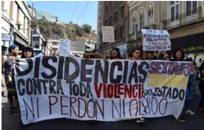
Imagen 3: Lienzo “Disidencias sexuales corporales contra toda violencia del Estado” (08 de marzo de 2020, Valparaíso). 15

El segundo grupo de denuncias pone en primer plano los valores políticos ligados al paradigma de los derechos humanos, entre ellos, alusiones a la libertad, la justicia y la verdad. Por ejemplo, “Justicia, verdad, no a la impunidad” (Lienzo colectivo de mujeres) (Imagen 4).