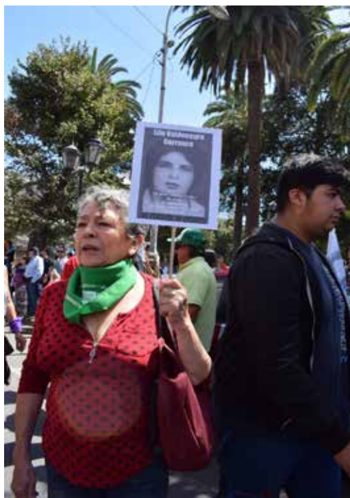
Imagen 10: Mujer de la organización de DD.HH. con pañuelo verde. 08 de marzo de 2020, Valparaíso).