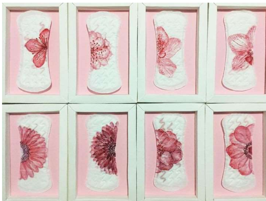
Figura 11. COCORO. El arte menstrual es cada vez más común.

Además de las artistas mencionadas, encontramos la presencia de variados colectivos y proyectos artísticos dedicados al arte menstrual, como el "Menstrual Art Project" y el "Museo de la Menstruación y la Salud de la Mujer". Estos espacios brindan plataformas para la creación y exhibición de obras de arte menstrual, así como para la educación y el diálogo sobre la Menstruación.