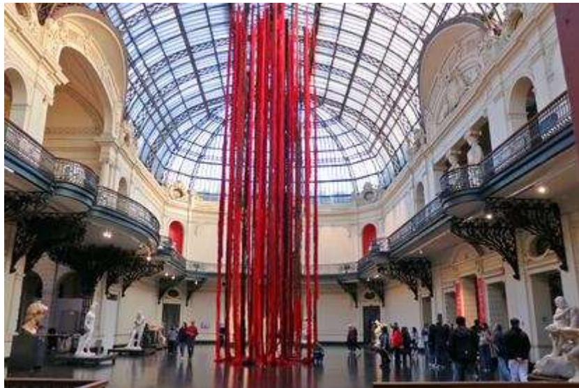
Figura 12. 'Quipu menstrual', de Cecilia Vicuña, en el Museo Nacional de Bellas Artes de Chile.

técnicas tradicionales aprendidas de comunidades indígenas, narran historias de fertilidad, renovación y poder femenino. Algunos nudos, más densos y complejos, simbolizan los desafíos y tabúes que rodean la Menstruación, mientras que otros, más sueltos y fluidos, celebran su belleza y fuerza vital. La lana roja se entrelaza con fibras de algodón crudo, cáñamo y lino, creando una textura rica y orgánica que evoca la conexión entre el cuerpo femenino y la naturaleza. Hojas secas, pétalos de flores y semillas se incorporan sutilmente a la obra, añadiendo capas de significado y conectando la Menstruación con los ciclos de crecimiento y decadencia de la tierra.