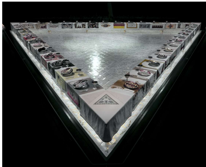
Figura 10. Chicago, La cena. "The Dinner Party" (1979)

Si bien no se puede determinar con certeza quién fue la primera artista en utilizar la sangre menstrual en su obra, pero se considera a Judy Chicago como una pionera en la exploración de temas relacionados con la Menstruación en el arte. Su icónica instalación "The Dinner Party" (1979), durante la segunda ola del feminismo, la obra buscaba recuperar la historia de las mujeres y darles un lugar en el "gran banquete de la historia" (Chicago, 1996), incluye representaciones de vulvas y referencias a la Menstruación, desafiando tabúes y abriendo el camino para otras artistas (Figura 10).