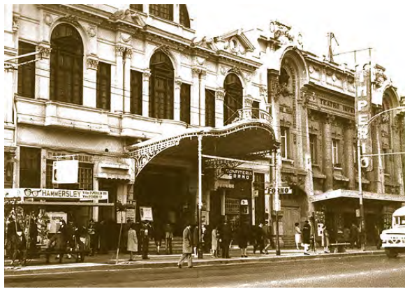
Tercer Teatro Victoria (1910-1971) 33