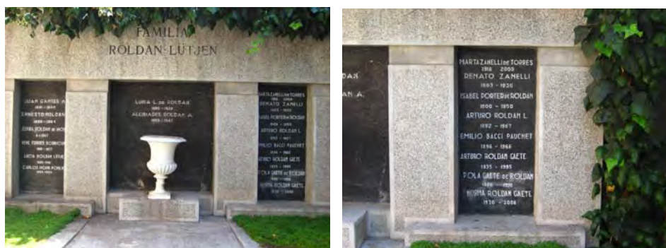
Mausoleo de la Familia Roldán Lütjen, ubicado en el patio 27 del Cementerio General, en Santiago. 31

“Nunca nos dijo que tenía cáncer, de la palabra cáncer no se habló nunca. Cuando murió, mi mamá dijo que se había liberado de grandes dolores, pero yo nunca supe que era el cáncer... no se hablaba... era un peligro decir la palabra cáncer. Querían operarlo allá (Estados Unidos) pero no quiso porque estaba solo. Entonces dijo que quería venir donde su señora y sus hijas, así que se vino, pero ya era muy tarde. No alcanzó a tener dolor, y en la operación se murió (...) Me acuerdo que esa mañana no fui al colegio, me quedé alojando donde la hermana de mi mamá que estaba casada con un alemán y nos querían mucho a mi hermana y a mí. A mi hermana la llevaron al hospital y yo me alojé donde esta tía ... estuve toda la mañana intranquila. Cuando era cerca de la hora de almuerzo, llegaron a buscarme, venía mi tía y mi hermana, muda, no hablaba nada. Llegamos a la casa, ahí en Dieciocho, y ví las puertas cerradas, porque antes estaba la puerta de calle y la de la mampara, cuando se moría alguien cerraban la puerta de calle y ahí sabías tú que había un muerto en la familia. En todas estas casas antiguas era costumbre cerrar las puertas de afuera si estabas de duelo. Ahí supuse que había muerto el papá (...) Mi mamá estuvo muy mal. Se pasaba acostada, botada la pobre en una pieza oscura. Sufrió muchísimo, aunque sabía lo que iba a pasar nunca pensó que se iba a morir en la operación”.