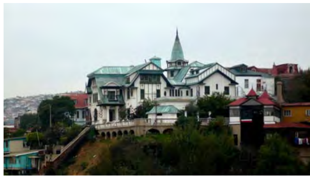
Palacio Zanelli, hoy Palacio Baburizza y Museo de Bellas Artes de Valparaíso. 21