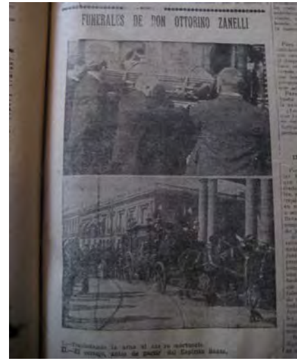
Inserto Diario La Unión, 18 abril 1914 15

"Habiendo fallecido nuestro querido don: