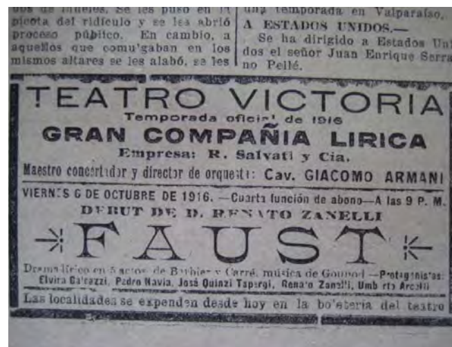
Publicidad del debut de Renato Zanelli en Fausto 34

El viernes 6 de octubre de 1916, Renato Zanelli debuta en el Teatro Victoria, en el mismo rol que había presentado por primera vez, pocas semanas antes en la capital. Su “Valentín” de la ópera Fausto, fue muy bien recibido por la crítica de la prensa local. Además, Zanelli llegaba al escenario del Victoria precedido de las buenas opiniones que había generado su debut en el Teatro Municipal santiaguino.