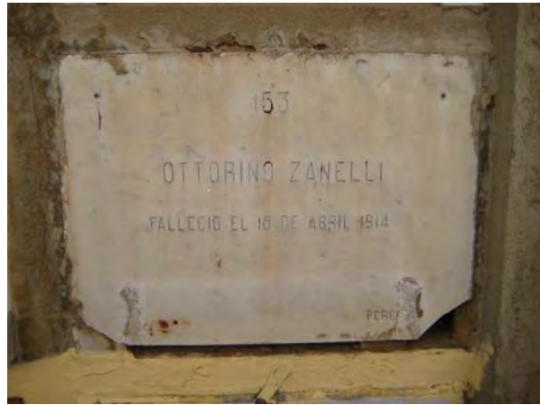
Nicho 153 donde yacen los restos de Ottorino Zanelli Ferra 18