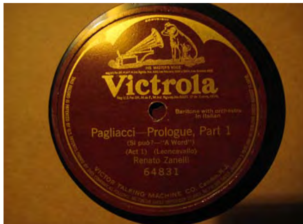
Grabación de Zanelli con el sello Victor. "Pagliacci-Prologue" part 1. 24

Antes de debutar en el teatro, aceptó un contrato para grabar veinte discos con la compañía "Victor Talking Machine Co.", con la que grabó los nueve primeros entre septiembre y octubre de 1919, aunque su lanzamiento se postergó a la espera del resultado de su estreno en el MET.