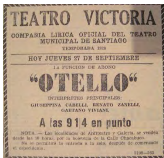
Publicidad de Oteló aparecida en el diario “La Unión” 45