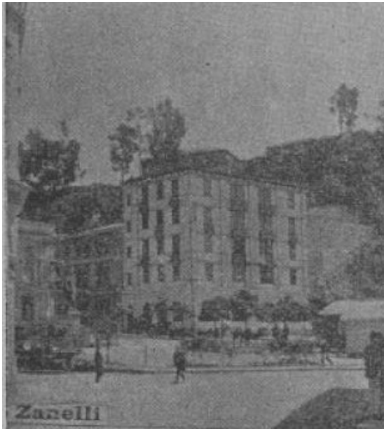
Edificio Zanelli 11