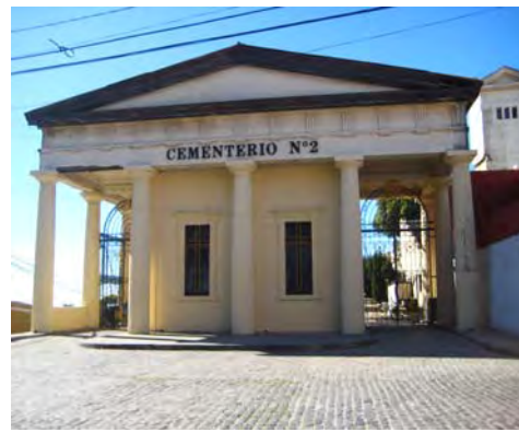
Frontis Cementerio N°2 17