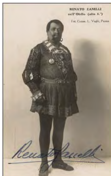
Renato Zanelli como Otelo 32

“Creo que sí: fue muy importante, aunque de carrera lamentablemente corta. Uno de los herederos de Tamagno, en algunas cosas superior. En Otelo ofrecía una interpretación saludablemente medida, musical, sin excesos, pero vibrante y bien trabajada, tensa y cuidadosa con la colocación de las notas altas. Pocos sollozos intempestivos y seguridad en los ataques. No ponía los pelos de punta como Vinay, pero era mucho más correcto en la vocalidad y su emisión más sana”.