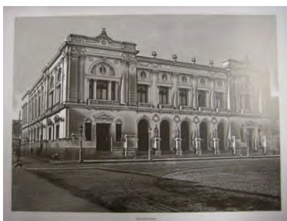
Segundo Teatro Victoria 6

El 26 de diciembre de 1878 fue totalmente destruido por un incendio. El fuerte viento de aquella jornada sepultó los esfuerzos realizados por bomberos para extinguir las llamas, y luego de 34 años de existencia se terminaba la historia de este primer gran coliseo del puerto.