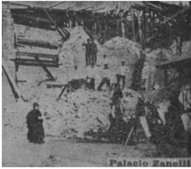
Vista del primer Palacio Zanelli, destruido durante el terremoto 13

Ottorino Zanelli falleció en Valparaíso el 14 de abril de 1914, como consta en el archivo del Cementerio nº3 de Playa Ancha, a causa de una miocarditis a la edad de 62 años. Sus restos reposan en el Cementerio nº2 de Valparaíso en un nicho perpetuo.