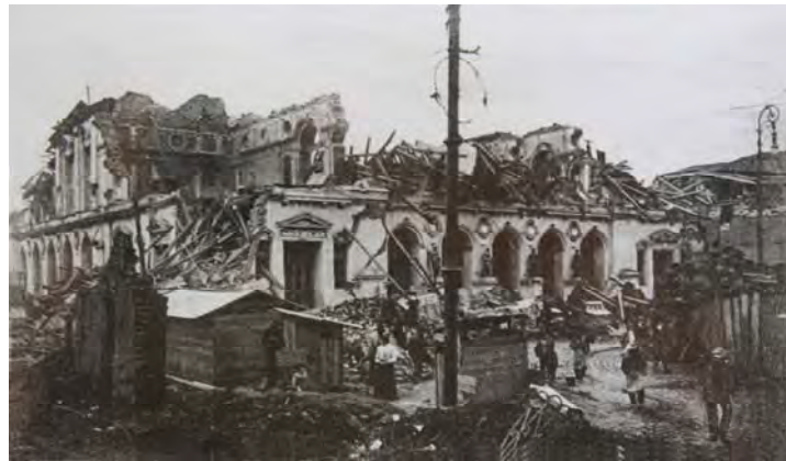
Segundo Teatro Victoria, totalmente destruido luego del terremoto 9

La destrucción afectó por igual tanto al plan como a los cerros, la debilidad de muchas construcciones hizo que literalmente fuesen arrancadas de raíz. La cantidad de víctimas fue imposible de precisar, pero se presume que hubo cerca de tres mil muertos y más de veinte mil heridos. La catástrofe generó la salida de más de 60 mil porteños, que se radicaron en sus ciudades de origen, Santiago y Viña del Mar.