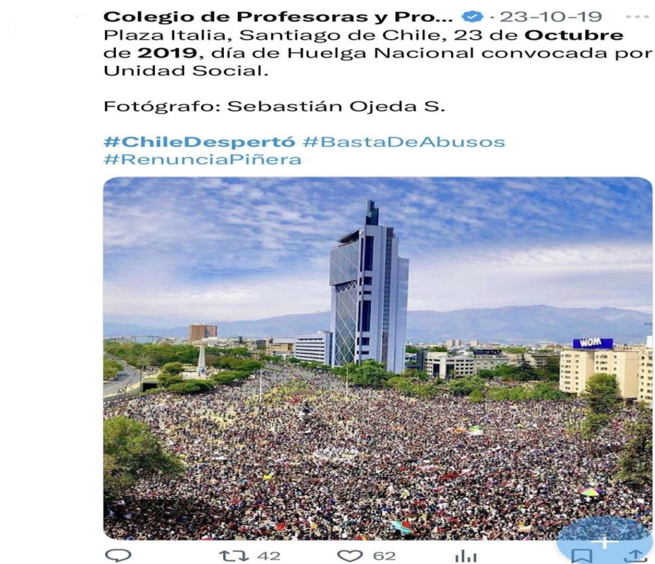
Figura 15: Imagen aérea de la marcha del 23 de octubre de 2019 en Plaza Italia, Santiago, difundida por el Colegio de Profesores. Refuerza el mensaje colectivo del #ChileDespertó y resignifica la protesta presencial en clave digital. (Véase Anexo Publicaciones 1. 14).

símbolos diversos, como banderas mapuches junto a emblemas nacionales, que la narrativa visual sintetizó bajo una lectura uniforme del conflicto.