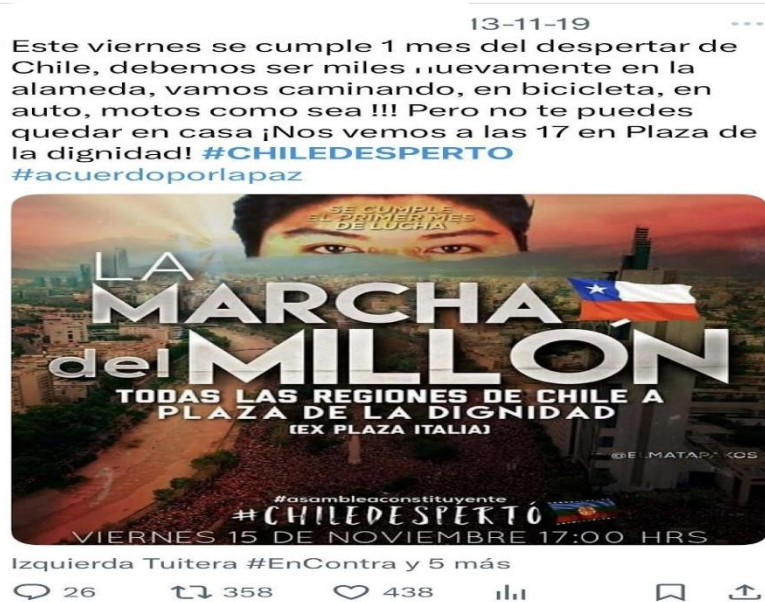
Figura 1. Afiche digital convocando a la marcha del millón en Plaza de la Dignidad, exigiendo justicia para Camilo Catrillanca. Conmemoración de su memoria, visibilidad de la lucha mapuche y el despertar social, uniendo consignas de dignidad y solidaridad. (Véase Anexo Publicaciones 1. 11).

Las publicaciones chilenas mostraron distintos modos de habitar el espacio urbano y de performar la ciudadanía. Visualmente predominaban los planos amplios que transformaban la multitud en un sujeto político, por tanto, el “pueblo” apareció como cuerpo colectivo que ocupaba y resignificaba la ciudad. Las imágenes aéreas de Plaza Dignidad, junto con las consignas inscritas en muros y pancartas digitales, consolidaron la narrativa del “despertar”. Como se presentó en la siguiente publicación en la cual se convocaba usando recursos claves, tales como; recuerdo conmemorativo de Camilo Catrillanca; espacio resignificado; elementos de plurinacionalidad.