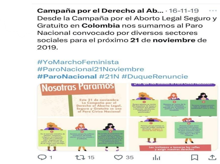
Figura 13: Infografía feminista digital convocando al Paro Nacional del 21N en Colombia, fusionando consignas históricas feministas con formatos digitales. La imagen transmite empoderamiento y resistencia colectiva. (Véase Anexo Publicaciones 1. 2).

aunque más localizado, tendió a generar interacciones deliberativas, donde los comentarios, debates y enlaces a documentos ocuparon un lugar central (Blanco & de la Fuente, 2010). En el corpus analizado, aparecieron afiches y textos que articularon demandas concretas, como pensiones, salud o represión estatal. Aunque muchas de estas publicaciones no alcanzaron la viralidad visual de los collages o las fotografías aéreas, sí cumplieron un papel clave al profundizar el contenido político del ciclo de movilización. Un ejemplo de ello fue la publicación realizada por la Campaña por el Derecho al Aborto en Colombia.