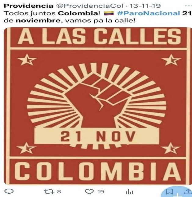
Figura 10: Afiche digital de convocatoria al Paro Nacional del 21N en Colombia, fusionando símbolos de lucha histórica con el alcance de las redes sociales. (Véase Anexo Publicaciones 1. 1).