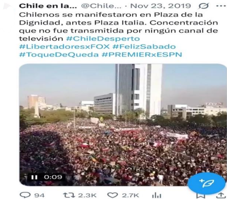
Figura 12. Fotografía aérea de Plaza Dignidad, capturada el 23 de noviembre, donde la ocupación del espacio y las consignas inscritas en muros y pancartas digitales refuerzan la narrativa del "despertar" social, transformando la plaza en un centro emocional y semántico de la protesta. (Véase Anexo Publicaciones 1. 19).

El recorrido de estos registros es particularmente interesante. Primero circularon dentro de la red social, donde los usuarios los compartieron y comentaron; luego, los medios de comunicación tradicionales los retomaron y los amplificaron, dotándolos de una nueva visibilidad; finalmente, esa cobertura mediática retorna a las redes generando una segunda ola de interacción.