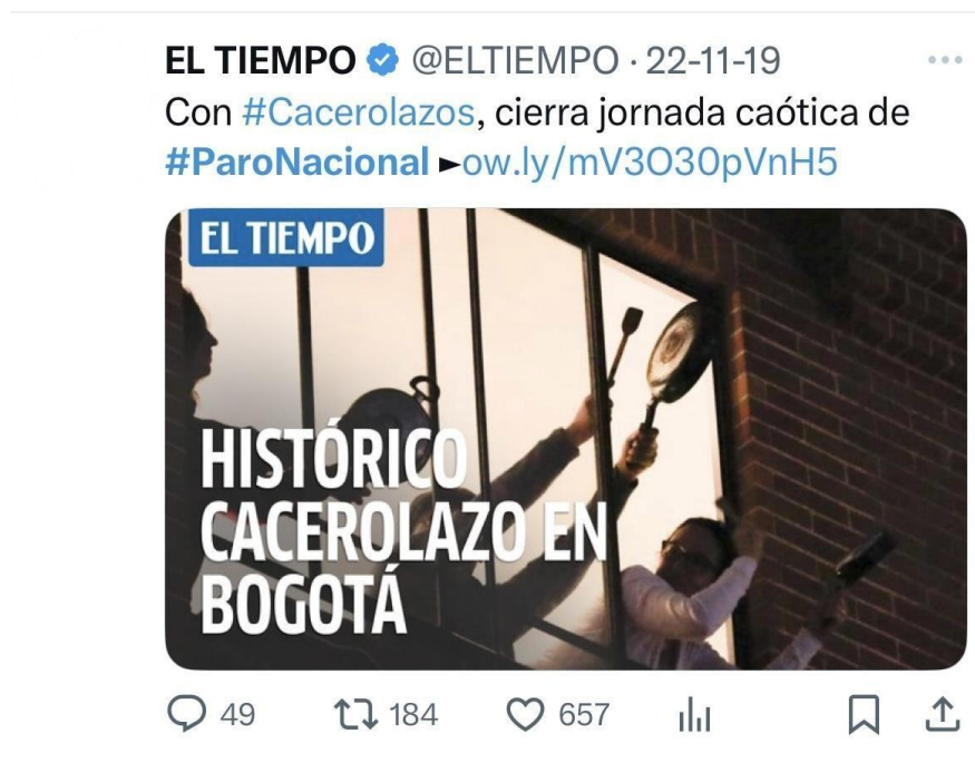
Figura 2. Publicación de El Tiempo sobre el "Cacerolazo" en Bogotá, 22 de noviembre, la imagen captura la participación desde los hogares, mostrando cómo el balcón y la ventana se convierten en espacios de resistencia pacífica y comunitaria. (Véase Anexo Publicaciones 1. 3).

Este desplazamiento amplió el repertorio clásico de la acción colectiva. La calle, la olla o el balcón se volvieron interfaces políticas donde la emoción y la visualidad adquirieron fuerza movilizadora. No se trató solo de amplificar los repertorios tradicionales, también de transformarlos culturalmente y poder integrar la estética, el afecto y la comunicación en un mismo acto de resistencia.