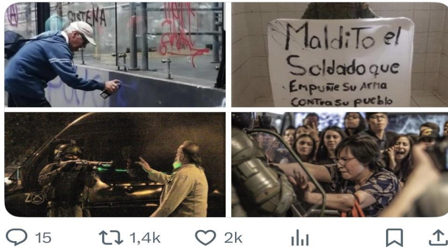
Figura 6. Collage “Esto es Chile, CTM” (publicado el 19 de octubre de 2025). Con miles de interacciones, la pieza condensa visiblemente la rabia y la violencia urbana, convirtiéndose en una síntesis narrativa del Estallido Social. La imagen circula como un símbolo cargado de alto voltaje emotivo. (Véase Anexo Publicaciones 1. 2).

Esta pieza condensa visualmente la rabia, la violencia urbana y la saturación emocional del momento, funcionando como un archivo de la intensidad colectiva. En Colombia, algo similar ocurre con los videos de cacerolazos nocturnos y los retratos familiares compartidos bajo #ParoNacional, que conforman un archivo afectivo en torno a la experiencia del cuidado y la resistencia pacífica. Se pudo observar que, en ambos casos, el archivo no es neutral, existe un proceso donde se selecciona, jerarquiza y da forma a las memorias posibles, definiendo qué se conserva y qué se olvida.