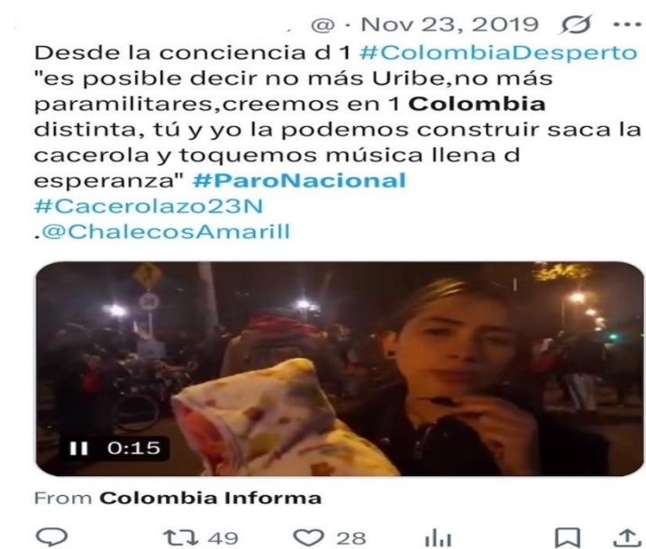
Figura 9. Video de una madre colombiana convocando al cacerolazo. Un caso inverso donde una cuenta individual gana visibilidad gracias a la viralización del testimonio. (Véase Anexo Publicaciones 1. 10).

Aquí, una cuenta individual y sin gran alcance logró una difusión significativa gracias a la legitimidad moral de su testimonio y a la capacidad viral de la emoción. Ambos casos, aunque opuestos en su origen, confirmaron que la coordinación digital dependió tanto de la autoridad simbólica del emisor como de la estructura algorítmica de amplificación. La acción conectiva, en este sentido, se sostuvo en un delicado equilibrio entre lo emocional, lo técnico y lo político.