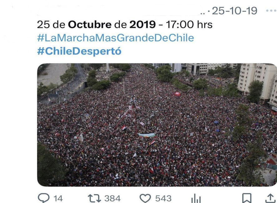
Figura 4. Fotografía aérea de la "Marcha del Millón" en Chile (25/10/2019), replicada masivamente bajo los hashtags #LaMarchaMasGrandeDeChile y #ChileDespertó. Esta imagen se convierte en una prueba visual y un emblema fundador del relato del Estallido Social, cristalizando la memoria política de un acontecimiento histórico. (Véase Anexo Publicaciones 1. 13).

Esto se aprecia con claridad en la publicación acompañada por la icónica fotografía de la Marcha del Millón (25 de octubre de 2019), replicada masivamente bajo los hashtags #LaMarchaMasGrandeDeChile y #ChileDespertó. La imagen aérea no solo documenta la movilización, también se convierte en una pieza fundacional del relato del Estallido Social, una suerte de emblema visual que concentra el sentimiento colectivo de la época.