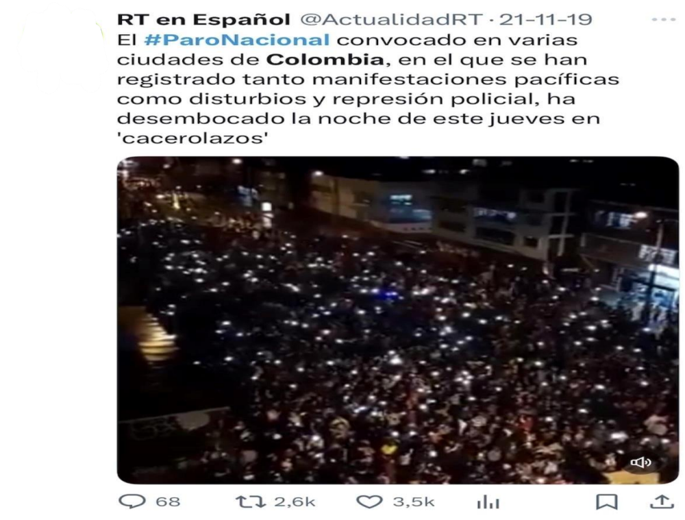
Figura 11. Registro sonoro de un cacerolazo masivo desde hogares en Colombia durante el #ParoNacional (21N). La protesta tradicional se amplifica digitalmente, convirtiendo el ruido doméstico en consigna colectiva viral. (Véase Anexo Publicaciones 1. 7).

posteriormente en otros contextos discursivos, mostrando su capacidad de permanencia simbólica.