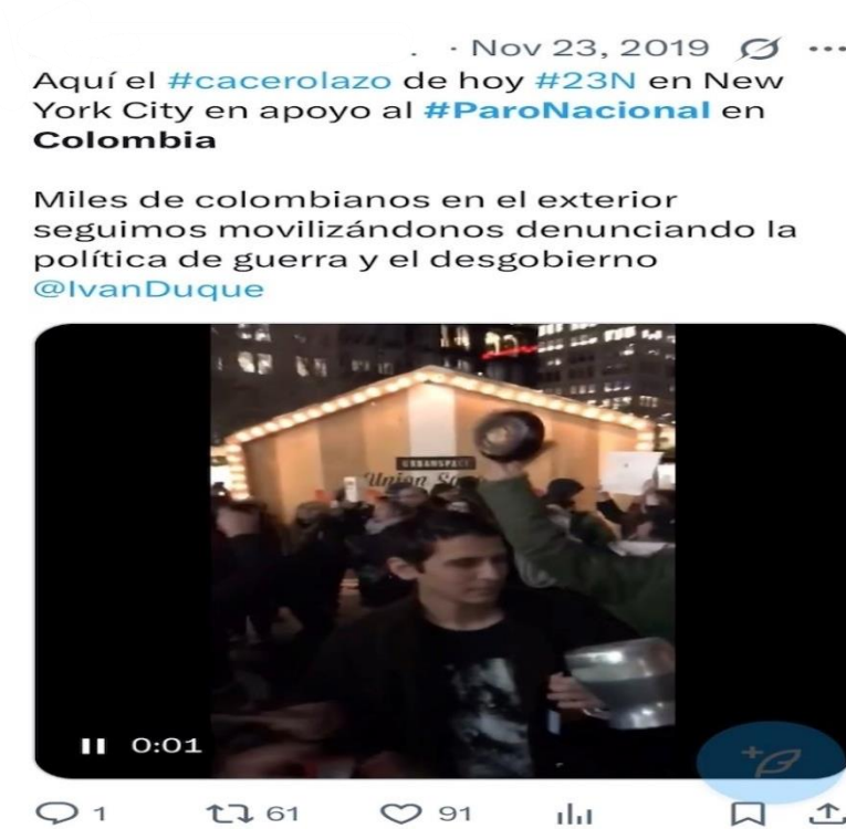
Figura 5. Colombianos en NYC participan en un cacerolazo en solidaridad con el Paro Nacional, noviembre 2019. Banderas, pancartas y el hashtag #ParoNacional amplifican su protesta fuera de Colombia. (Véase Anexo Publicaciones 1. 9).

En cambio, en el caso colombiano la función instituyente adopta una forma complementaria, aunque distinta. Allí, la protesta se instituyó desde lo íntimo y lo cotidiano. Las imágenes de balcones, cacerolazos domésticos y retratos familiares dotaron al movimiento de una estética testimonial.