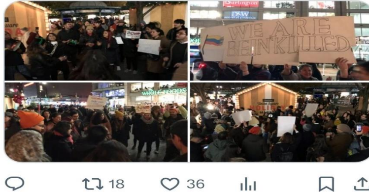
Figura 14: Protesta en Union Square (NYC) durante el Paro Nacional de 2019, con pancartas y banderas colombianas. La acción presencial fue difundida en X como muestra de solidaridad transnacional. (Véase Anexo Publicaciones 1. 8).

Estas transformaciones, sin embargo, conllevaron tensiones fundamentales que condicionaron la capacidad de las protestas para traducirse en cambios institucionales.