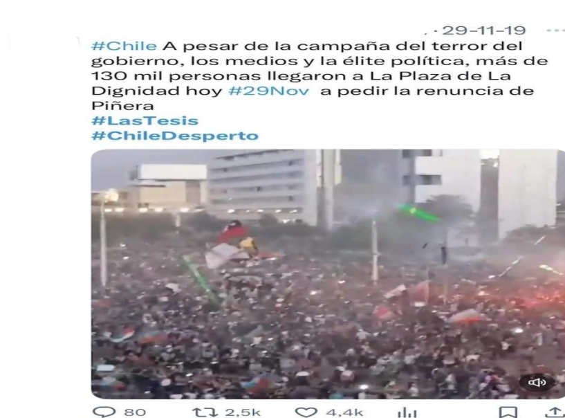
Figura 3. Captura del video de la publicación, realizada por una cuenta dedicada a viralizar temas políticos y populares. La imagen muestra cómo los algoritmos y las redes sociales amplifican las convocatorias, facilitando la rápida expansión de la protesta a través de plataformas digitales, pero también destacando la coordinación frágil y efímera en este contexto. (Véase Anexo Publicaciones 1. 15).

Una convocatoria digital resulta efectiva cuando no solo entrega información, sino que logra alinear emociones, ya sea indignación, esperanza, orgullo o solidaridad (Baroja Rojas, 2024). La coordinación entonces deja de ser una simple tarea logística para convertirse en una práctica emocional y simbólica. En este punto, la transformación del repertorio de acción colectiva además de ser organizativa también es afectiva.