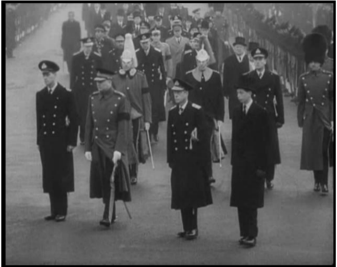
Fotograma "Refutación de todos los juicios"

Refutación de todos los juicios no es simplemente un film, más bien es un texto crítico a los críticos, es un segundo intento por dar a entender que "La sociedad del espectáculo" no tiene que ser vista como una obra convencional, tampoco ser enjuiciada como cine documental, más bien debe ser vista como el reflejo del pensamiento situacionista respecto a la alienante sociedad espectacular, que, paradójicamente, sustenta el cine como tal.