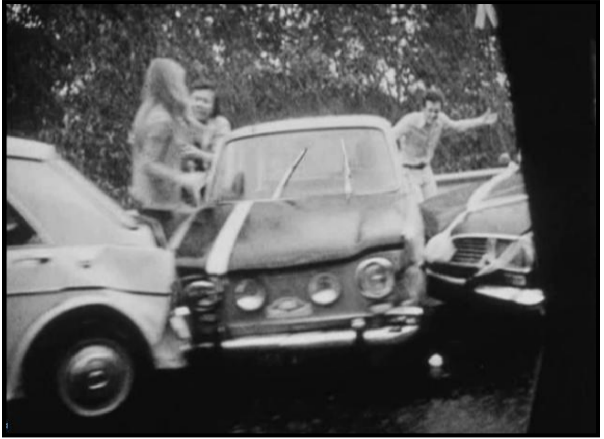
Fotograma "Refutación de todos los juicios"

que era un mala película. Pero cuando uno es a la vez cineasta y revolucionario demuestra fácilmente que su generalizada acritud proviene de una evidencia: la película en cuestión es la crítica exacta de la sociedad que ellos no saben combatir y un primer ejemplo del cine que ellos no saben hacer.