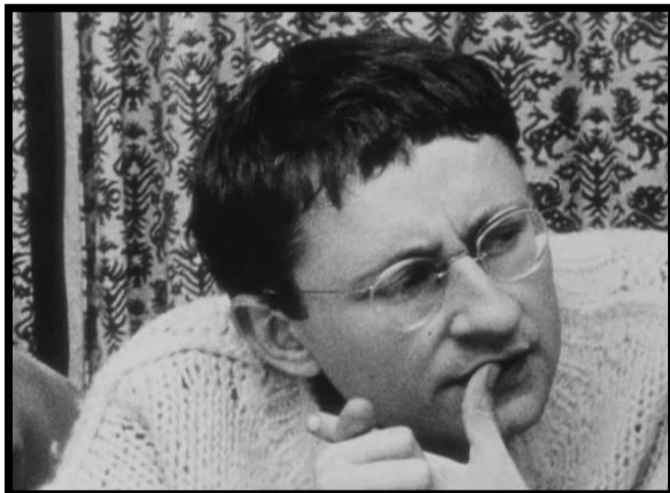
Fotograma "Crítica de la separación"