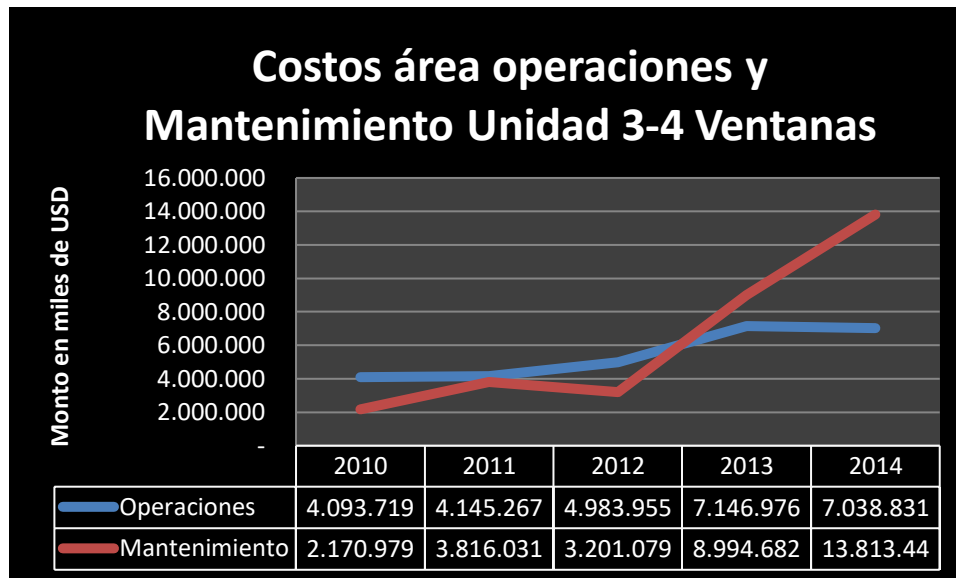
Grafico N°1: Costos área Operaciones y Mantenimiento V3-V4 Ventanas