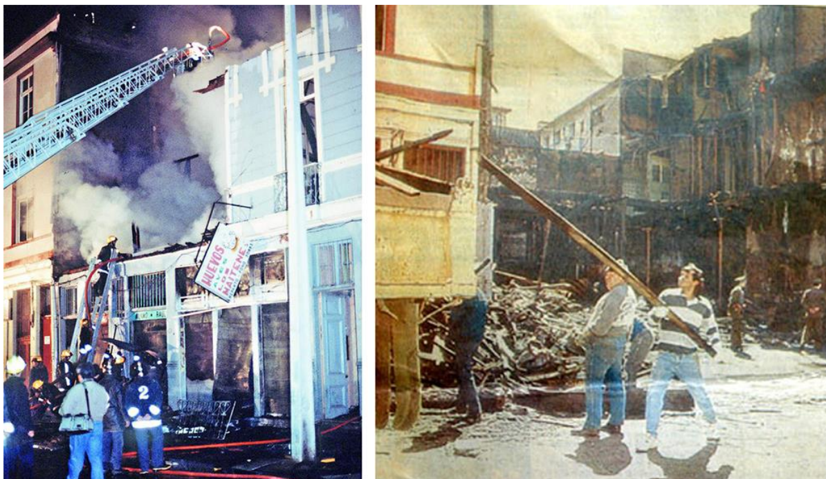
Una imagen de la noche del incendio y de la posterior limpieza del lugar del siniestro.

En los eventos de aniversario, y para levantar la asistencia, se invitaba a las transformistas más reconocidas del momento porque sabían que tenían nuestro público y aportaríamos glamour a la ocasión. Recuerdo, cuando el negocio ya estaba bien establecido y contaba con mucho público, nos honraron nombrando a todas las artistas que en alguna ocasión pasamos por su escenario”.