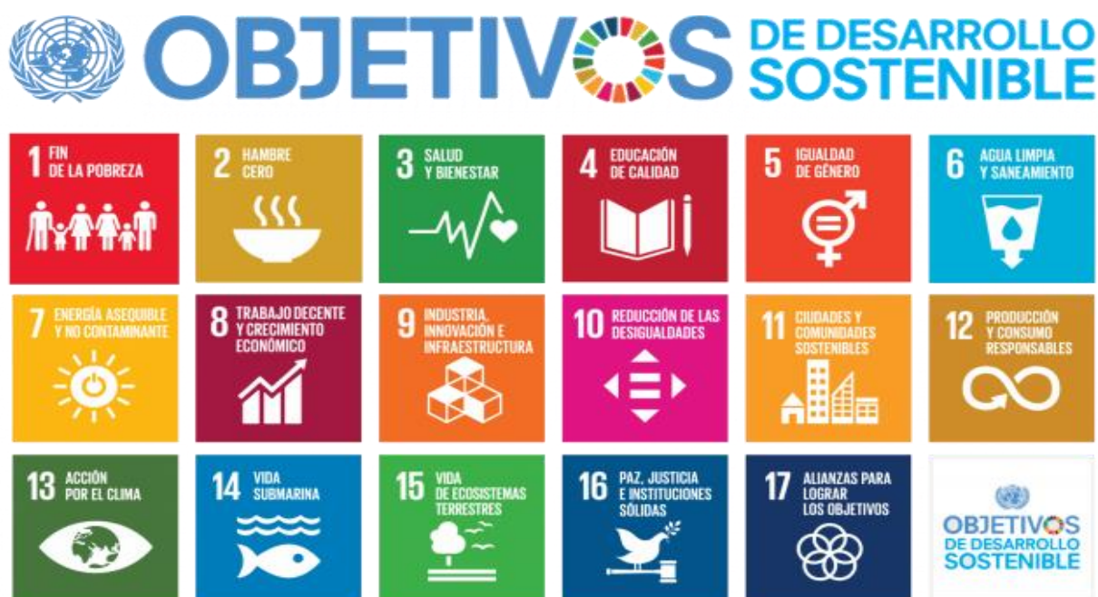
Figura 3: Objetivos para el Desarrollo Sostenible [Imagen], por la Organización de las Naciones Unidas, 2015. ( https://www.un.org/sustainabledevelopment/es/objetivos-de-desarrollo-sostenible/ )

En congruencia con ello, la Agenda 2030 para el Desarrollo Sostenible presenta una oportunidad histórica para América Latina y el Caribe, al incluir en sus 17 Objetivos de Desarrollo Sostenible (ODS) y 169 metas, temas altamente prioritarios actualmente, como lo son la erradicación de la pobreza extrema, la reducción de la desigualdad en todas y cada una de sus dimensiones, ciudades sostenibles y cambio climático, entre otros. En definitiva, esta agenda constituye un paso hacia la transformación desde una visión ambiciosa del desarrollo sostenible, que pone la igualdad y dignidad de las personas en el centro y llama a cambiar nuestro estilo de desarrollo, respetando el medio ambiente: