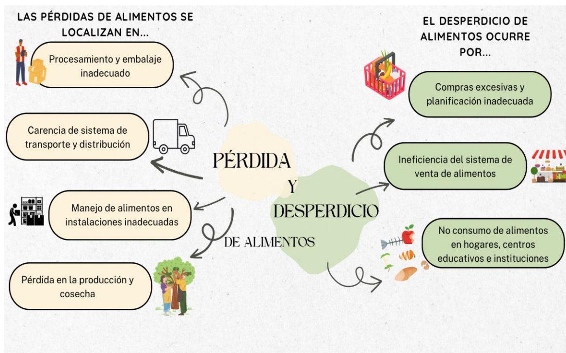
Figura 2. Elaboración Propia

cuando los alimentos se pierden por malas decisiones de los comerciantes y consumidores. (FAO 2014 en Guía didáctica para educadores de párvulos, 2022)