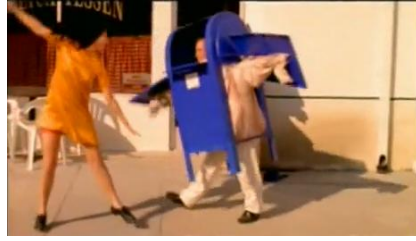
It's Oh So Quiet de Spike Jonze

En un segundo grupo estaría el videoclip que “comprende a toda una comunidad de realizadores provenientes del cine o del video experimentales que, en alianza con los intérpretes y compositores más osados, logró transformar este formato televisivo en un vasto campo abierto a la reinención del audiovisual” 8 . Pensamos que es en esta categoría que podríamos encontrar algún lenguaje específico del videoclip, independiente de que este sea narrativo o experimental. Si el tipo de experimentación en la imagen se hace a partir de un trabajo previamente realizado por el mismo equipo técnico que guarde relaciones reales entre la música y el texto, este videoclip experimental puede tener tanta o más riqueza de lenguaje que uno que solamente cuente una historia. Dentro de esta agrupación estarían los videoclips “coreográficos-ficcionales”, los “ficcionales”, que se optan por redefinir como “narrativos” y “experimentales”.