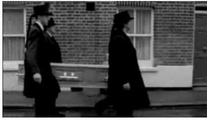
The Importance of Being Iddle de Dawn Shadforth