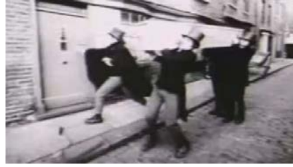
Dead End Street de autor desconocido