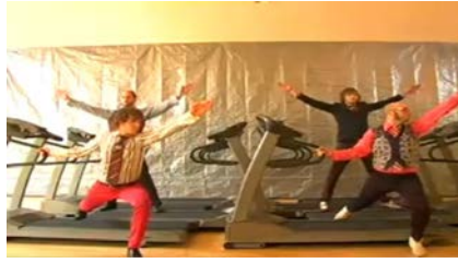
Here it Goes Again de Trish Sie