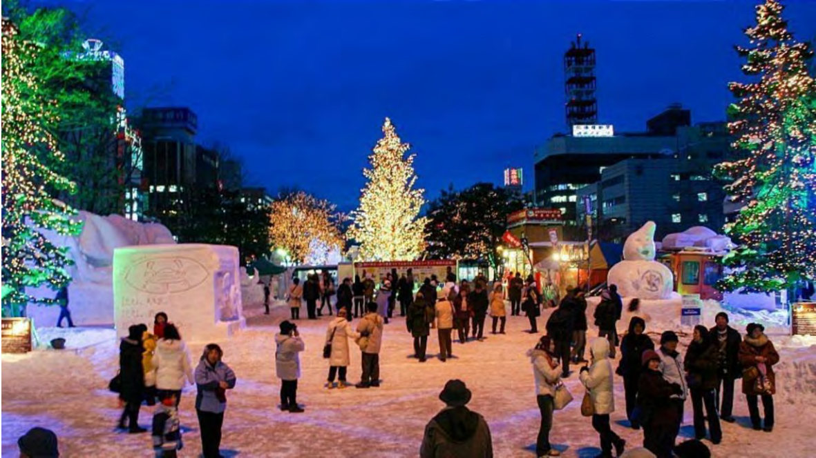
Ilustración 10 Sapporo Snow Festival, Hokkaido, Japón. (Japan Guide, 2022)