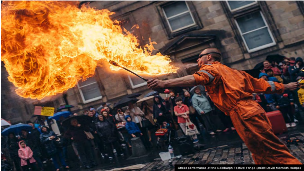
Ilustración 19 Festival Fringe de Edimburgo. (Edinburgh Festival City, 2021)