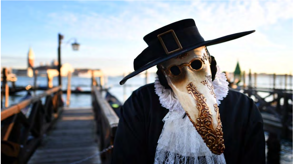
Ilustración 12 Carnaval de Venecia. (Vincenzo Pinto, 2019)