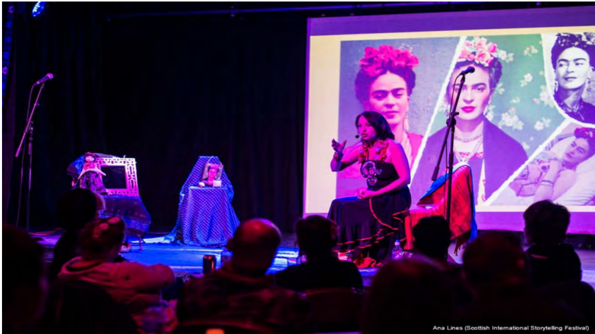
Ilustración 22 Festival Internacional de Cuentacuentos de Escocia. (Edinburgh Festival City, 2021)