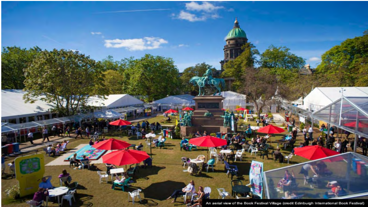
Ilustración 21 Festival Internacional del Libro de Edimburgo (Edinburgh Festival City, 2021)