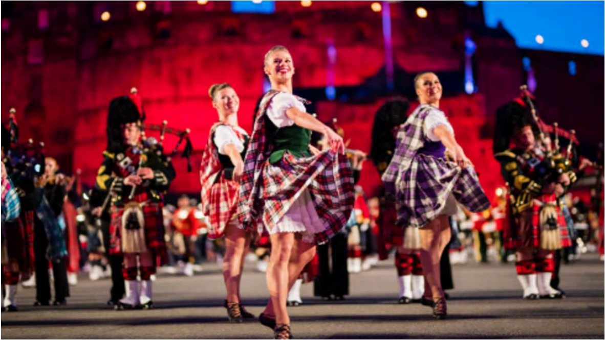
Ilustración 20 The Royal Edinburgh Military Tattoo (Creative Scotland, 2021)