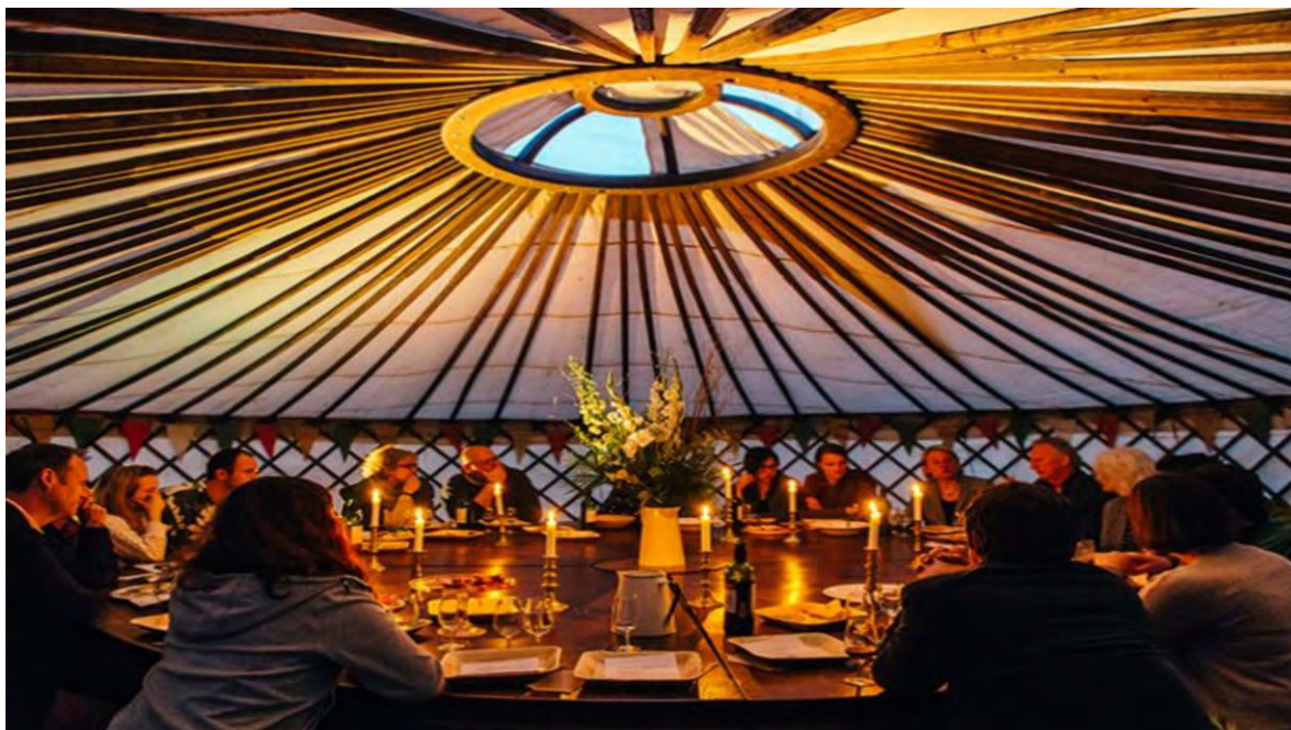
Ilustración 25 How The Light Gets In Festival (Festival Insights, 2019)