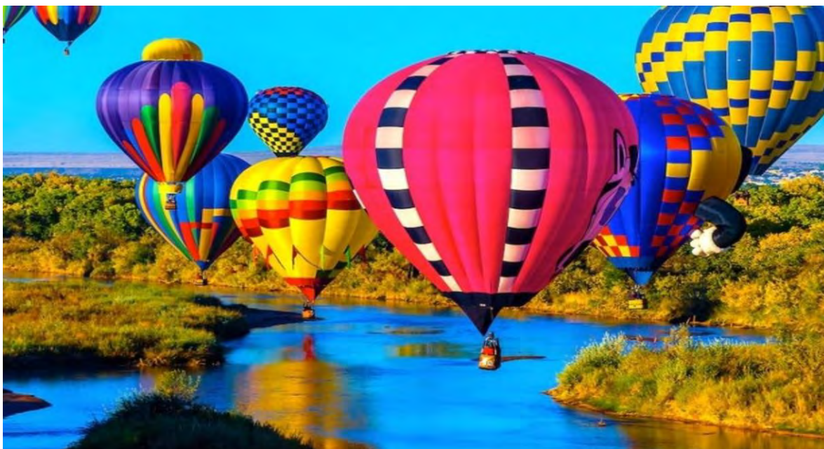
Ilustración 8 Albuquerque International Balloon Fiesta, Nuevo México, Estados Unidos. (Destinos experienciales, 2018)