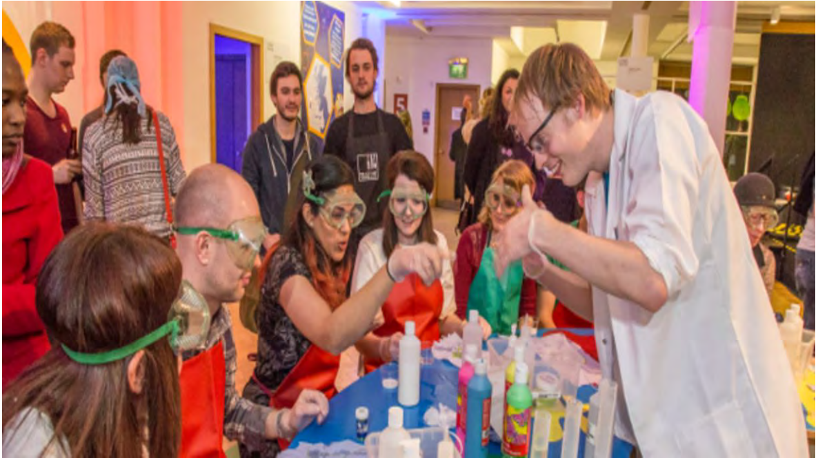
Ilustración 13 Festival Internacional de Ciencias de Edimburgo. (National Geographic, 2020)