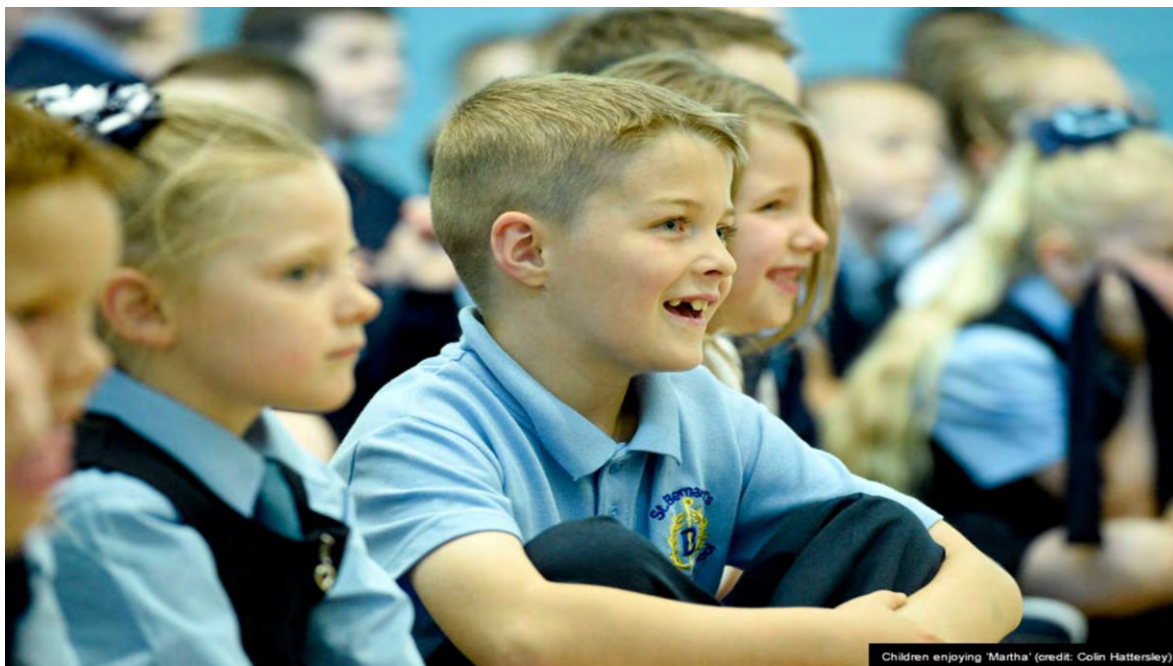
Ilustración 14 Festival Infantil Internacional de Edimburgo. (National Geographic, 2020)