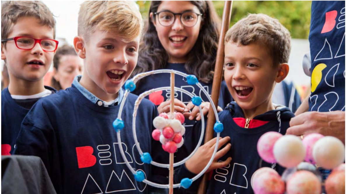
Ilustración 27 Festival BergamoScienza. (Fondazione Same, 2019)