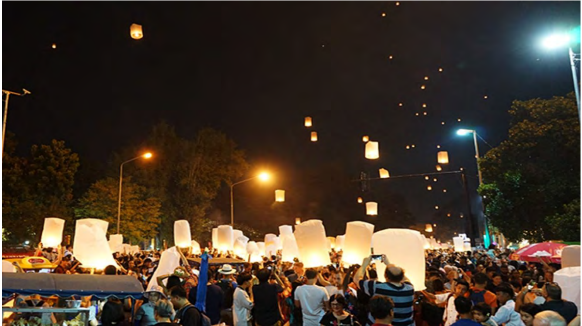
Ilustración 7 Yee Peng Lantern Festival, Tailandia. (Vilar, 2022)