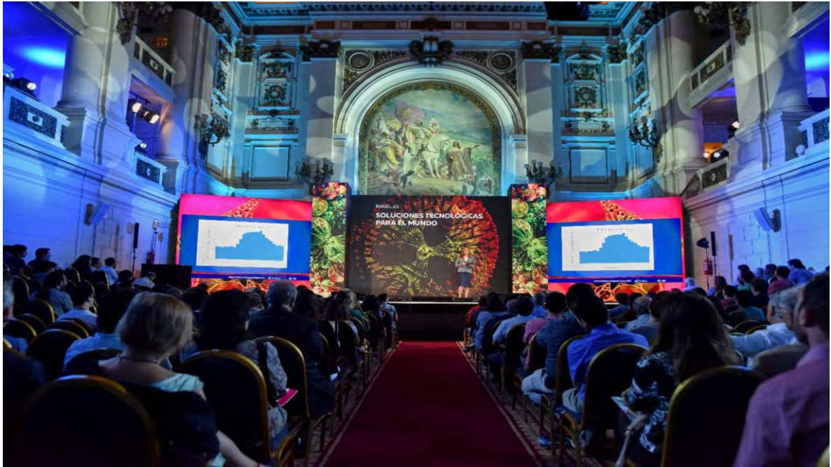
Ilustración 3 Congreso Futuro (El Mostrador Cultura, 2021)