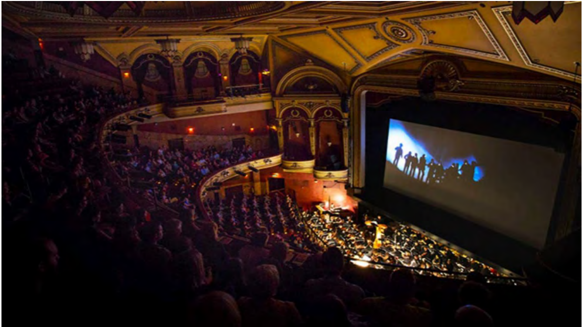
Ilustración 15 Festival Internacional de Cine de Edimburgo. (Innovation for media content creation, 2018)