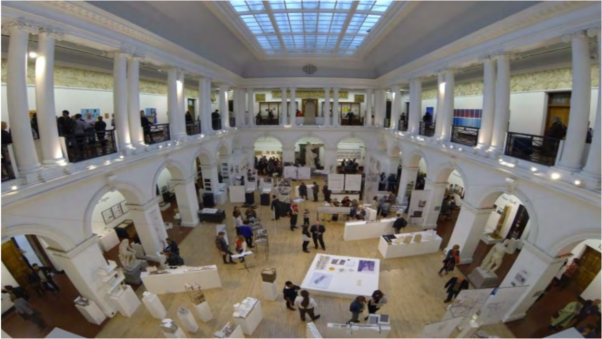
Ilustración 17 Festival de las Artes de Edimburgo. (Edinburgh Festival City, 2021)