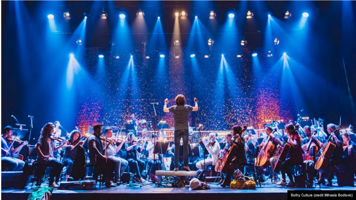
Ilustración 18 Festival Internacional de Edimburgo. (Edinburgh Festival City, 2021)