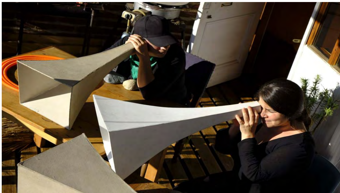
Ilustración 4 Festival Tsonami 2021 (Ros, 2021)