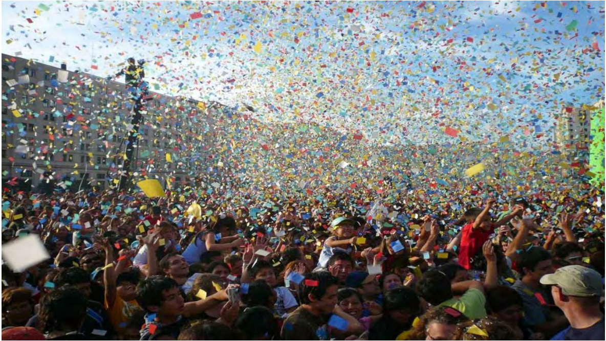
Ilustración 2 Festival Internacional Teatro a mil (Fundación Teatro a mil, 2022)