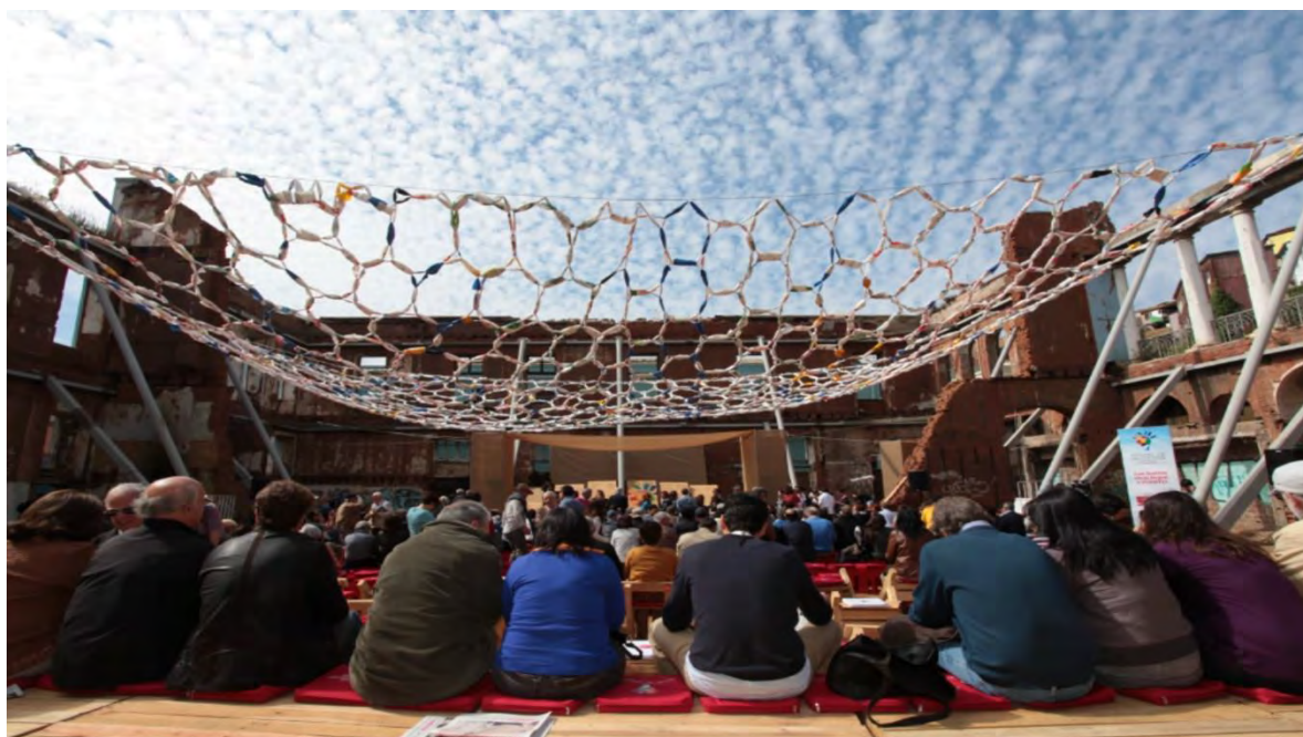
Ilustración 1 Festival Puerto de Ideas Valparaíso (El Mostrador Cultura, 2021)