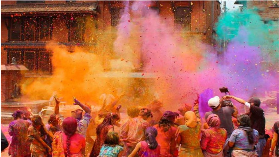
Ilustración 6 Holi Festival, India.