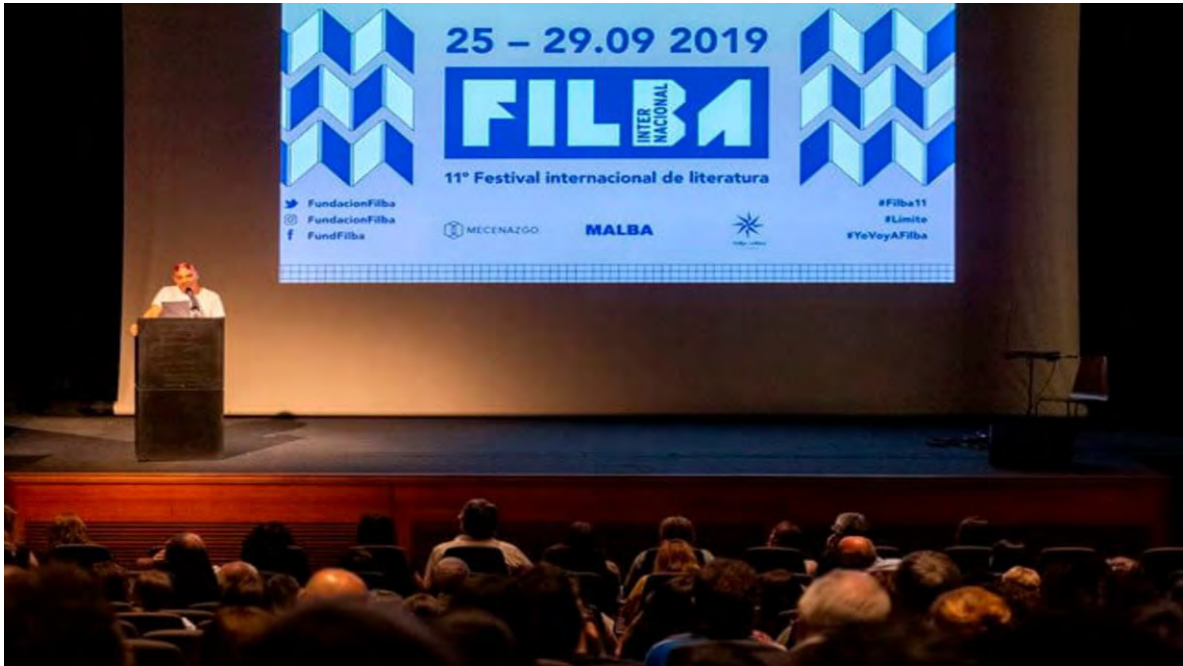
Ilustración 26 Festival Internacional de Literatura. (Fundación FILBA, 2019)