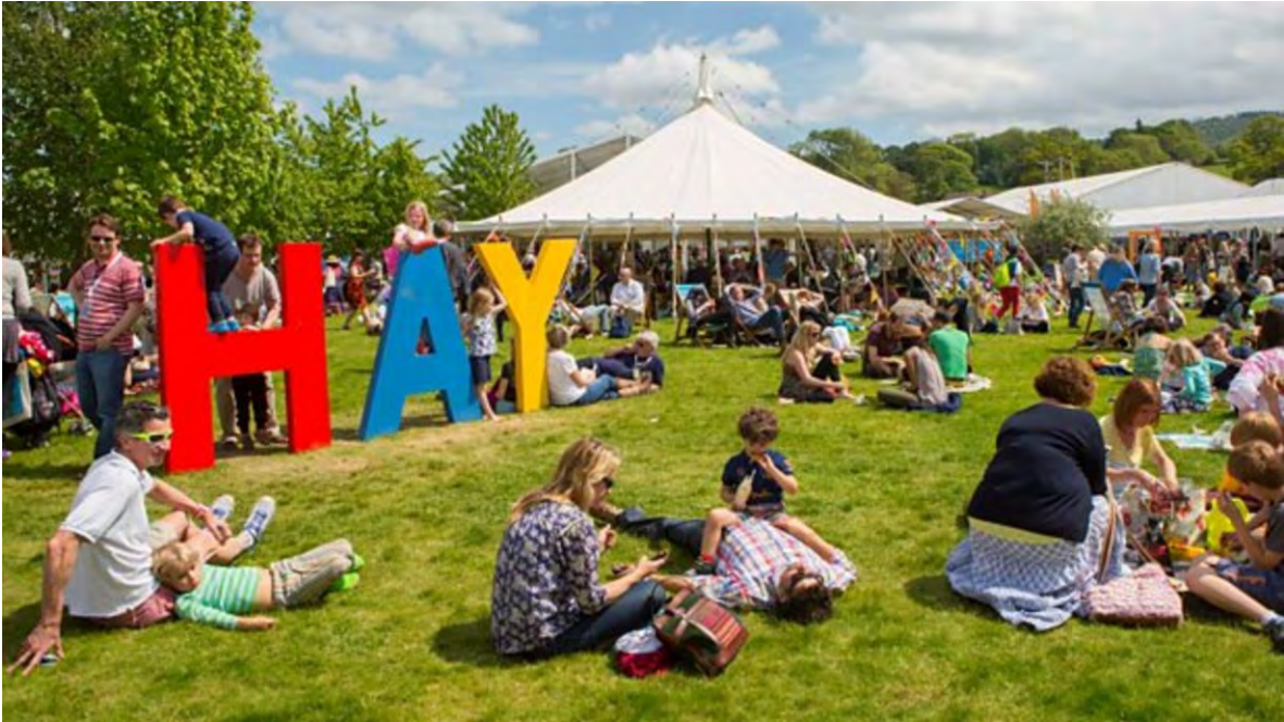
Ilustración 24 Hay Festival (BBC Arts , 2019)