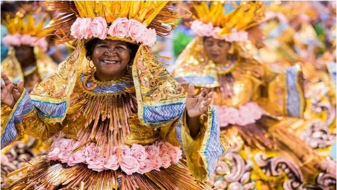
Ilustración 9 Carnaval do Rio de Janeiro, Brasil. (Moreira, 2019)