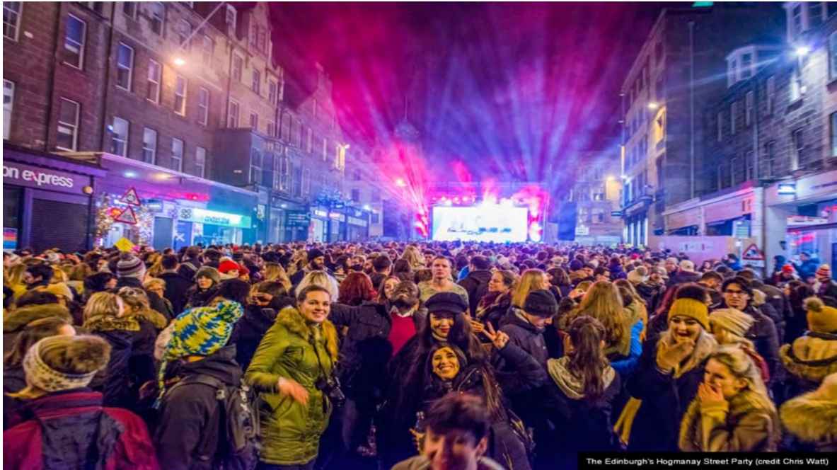
Ilustración 23 Fiesta de Hogmanay de Edimburgo – Nochevieja (Edinburgh Festival City, 2021)