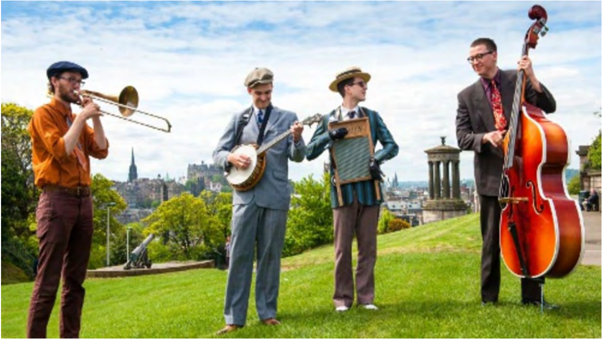
Ilustración 16 Festival de Jazz y Blues de Edimburgo.