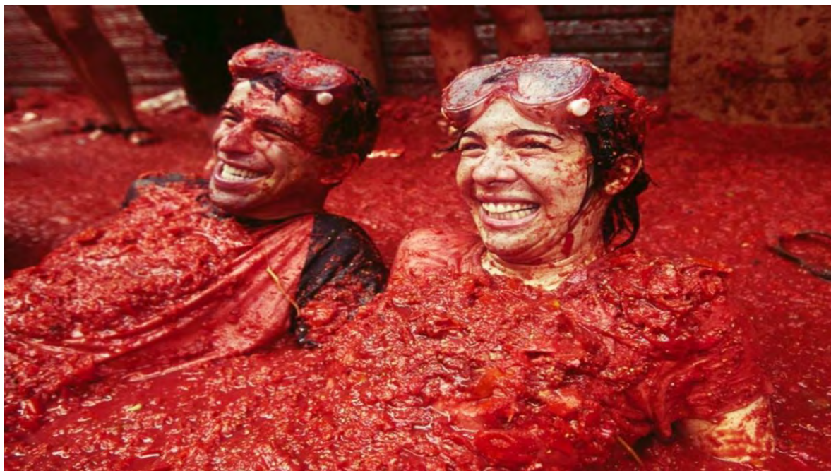
Ilustración 11 La Tomatina Festival (La Tomatina , 2021)