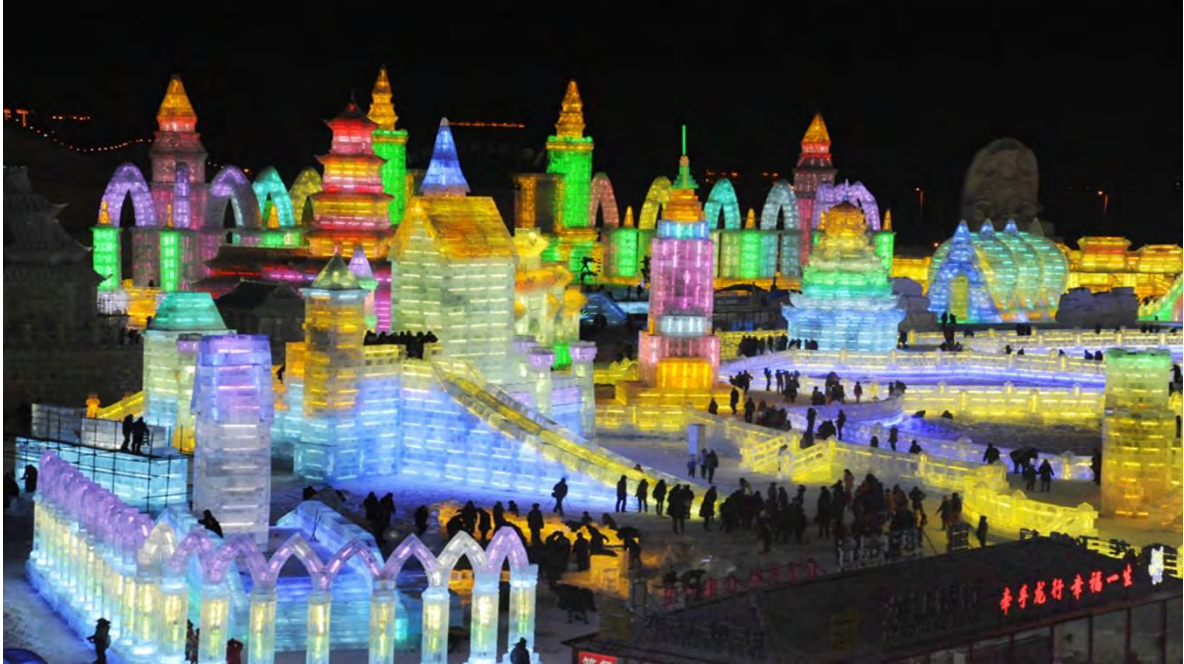
Ilustración 5 Festival Internacional de Esculturas de hielo y nieve de Harbin, China. (National Geographic, 2020)