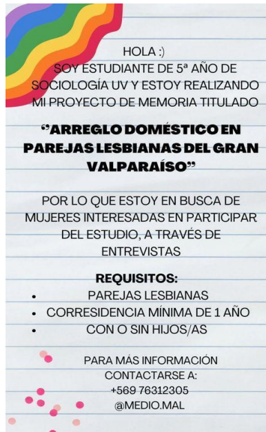
Ilustración 1 Gráfica para el reclutamiento de informantes voluntarias por redes sociales