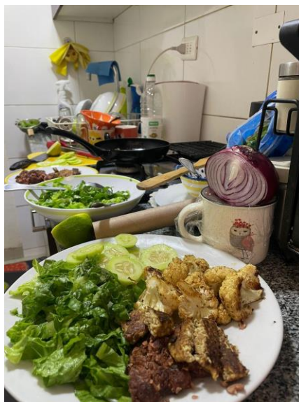
Ilustración 4 Preparación del almuerzo