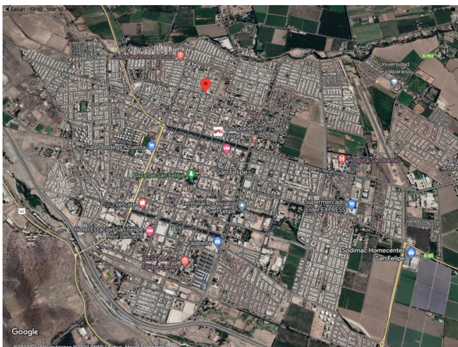
Ilustración 2 Mapa ubicación escuela.