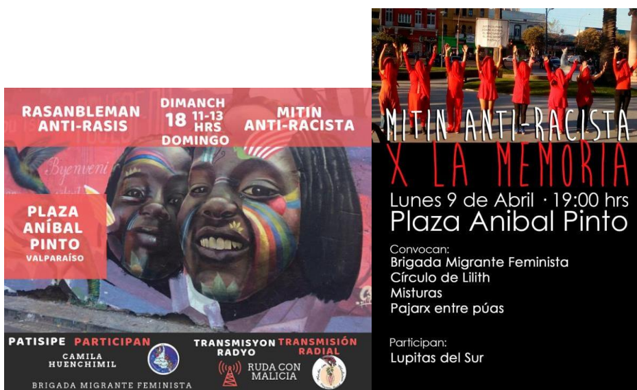
Mítines antirracistas, convocados en conjunto.

La performance, el canto, la danza y otras formas de arte, también han sido una apuesta últimamente muy bien utilizada por las colectivas al momento de convocar a una acción callejera. También se organizan jornadas más destinadas a la masificación de una denuncia o información, como radio abierta 28 , volanteadas, incluso espacios de conversación y aprendizaje (E8, 2019). Incluso las colectivas que colaboraron con esta investigación se han aliado y convocado en conjunto a los “mitin antirracistas” u otras concentraciones de acuerdo a la contingencia.