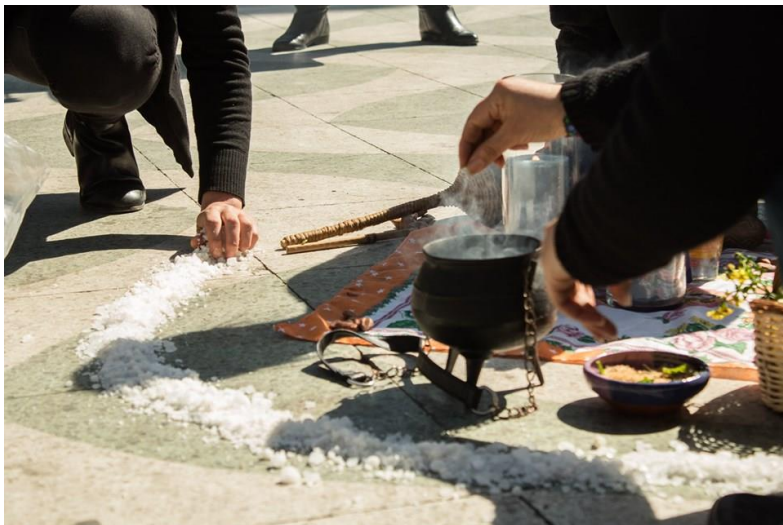
Rito a la calle en la Plaza Victoria, durante el 25 de Agosto y el 25 de Septiembre de 2019.

En este caso, los elementos habituales de una intervención callejera como podrían ser un megáfono, un lienzo o gritos con consignas preparadas, son reemplazados por tambores, sonajas, cantos, y un altar donde están presentes el agua, la tierra, el fuego y el aire, más otros elementos importantes como pétalos de flores, imágenes, amuletos o nombres de mujeres que han sido asesinadas o desaparecidas. Se hace una entrada a la plaza en hilera, mientras se sahúma, luego se ubican en círculo resguardando otro dibujado en el piso con sal, para la protección y contención de la energía que allí se liberará.