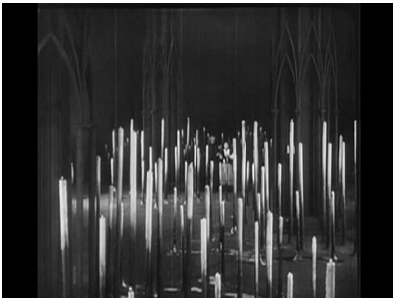
Fotograma nro22 Plano general, secuencia 3 análisis filme "Der mude tod".