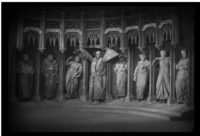
Fotograma Plano general, filme "Metrópolis".