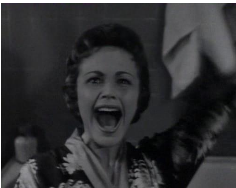
Fotograma nro18 Plano medio corto filme secuencia 1 análisis filme "While the city sleeps"