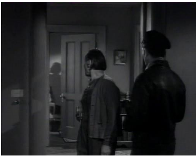
Fotograma nro6 Plano medio largo secuencia 1 análisis filme "While the city sleeps"