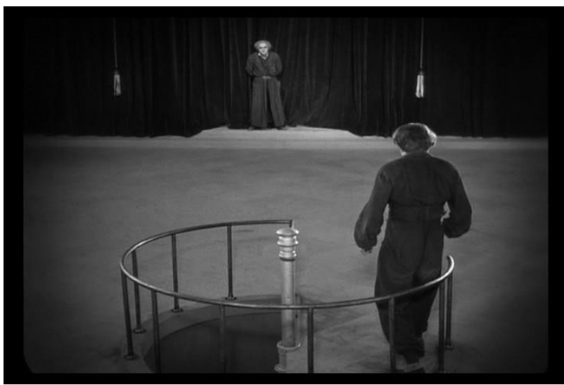
Fotograma Plano general, filme "Metrópolis".