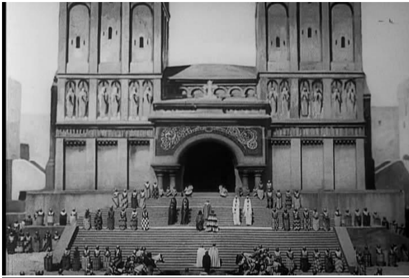
Fotograma nro30. Gran plano general, secuencia3 análisis filme "Der mude tod".