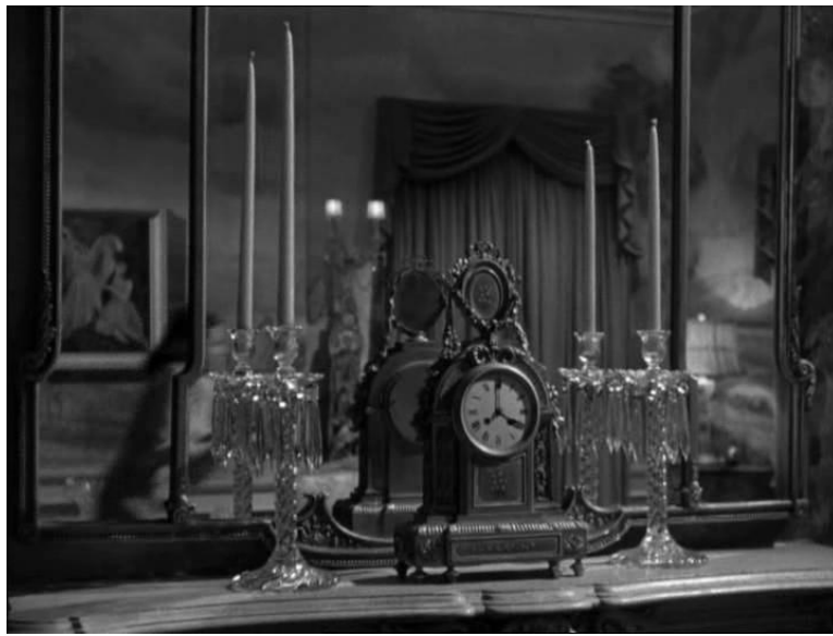
Fotograma nro22 Plano conjunto secuencia3 análisis filme "Secret beyond the door"