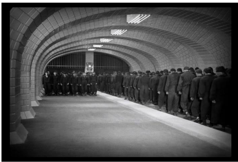
Fotograma nro2 Plano general secuencia1 análisis filme "Metrópolis"