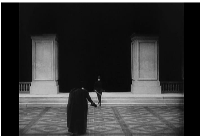
Fotograma nro7 Plano general secuencia4 análisis filme "Der mude Tod"