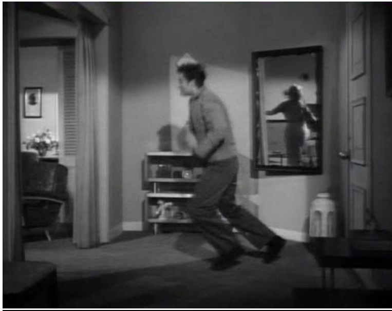
Fotogramanro18 Plano general secuencia3 análisis filme "While the city sleeps