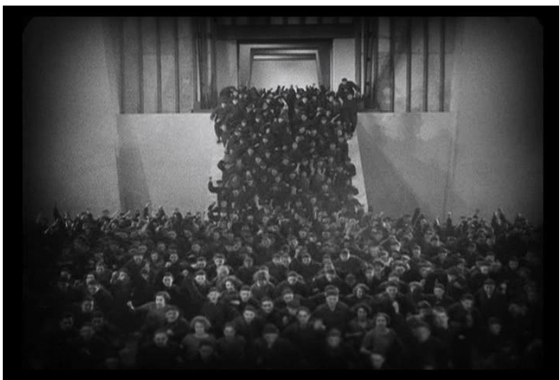
Fotograma Gran plano general filme "Metrópolis".