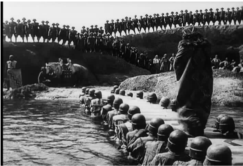
Fotograma nro4 Plano general secuencia3 análisis filme "Die Nibelungen"