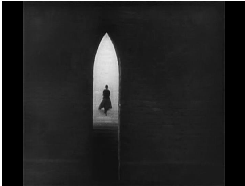
Fotograma nro18 Gran plano general, secuencia 3 análisis filme "Der mude tod".

En este suplemento presentaremos los fotogramas más notables, de los filmes que presentamos anteriormente, solo algunos forman parte de las secuencias analizadas, los demás fueron elegidos para ejemplificar, algunos argumentos expuestos durante esta tesis y su conclusión.