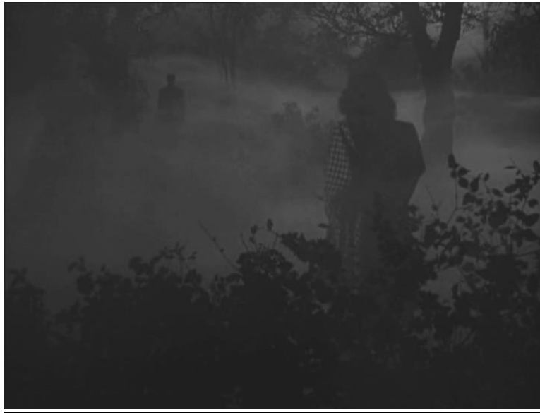
Fotograma nro45 Plano general secuencia3 análisis filme "Secret Beyond the door"