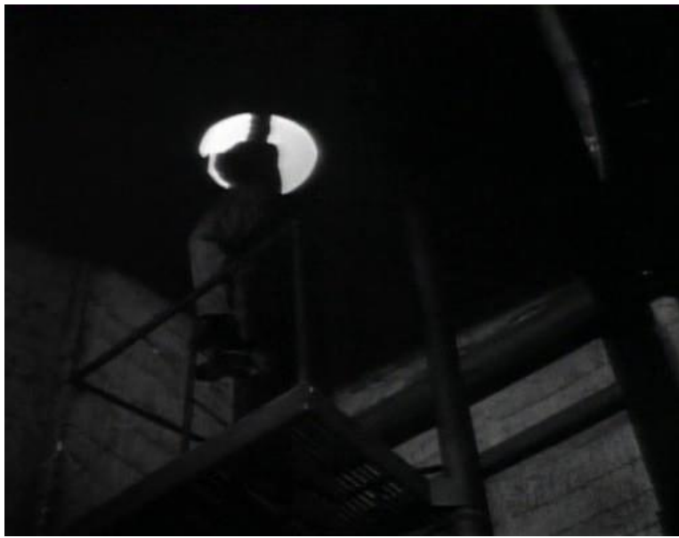
Fotograma nro73 Plano conjunto contrapicado secuencia3 análisis filme "While the city sleeps