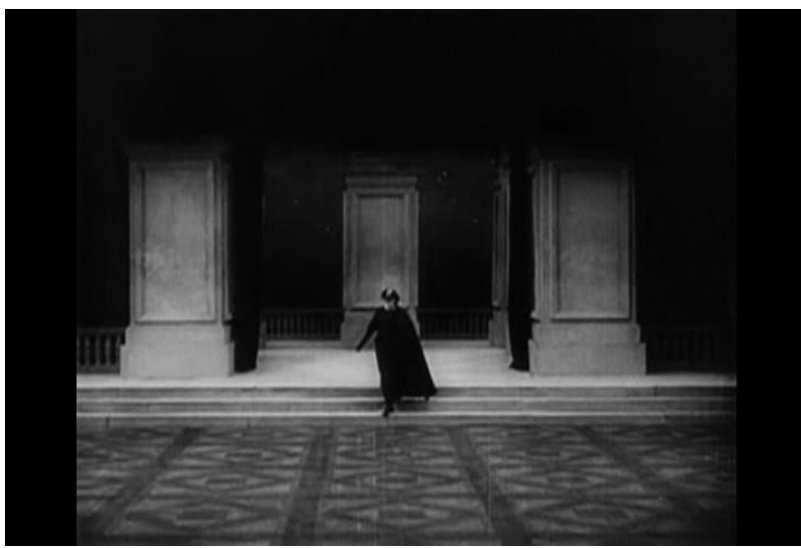
Fotograma nro6 Plano general secuencia4 análisis filme "Der mude Tod"