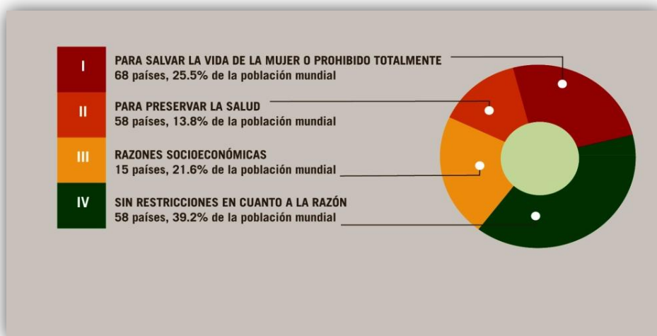
Figura 2. Lectura