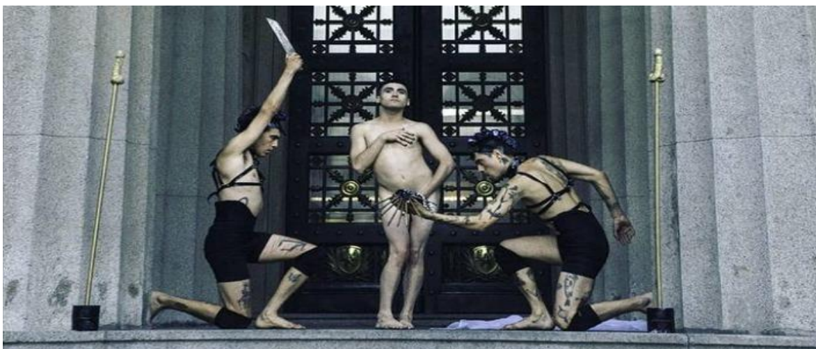
Imagen 2. Colectivo Tinta Negra

En el caso de lxs performers, de un total de seis entrevistadxs, cuatro pertenecen a compañías y/o colectivos porteños pequeños en comparación a la “Conga Comparsa La Kalle”. La primera persona entrevistada pertenece a “Tinta Negra”, compañía que tiene 7 años de existencia y está compuesta por 8 personas. Se define como una compañía de artes escénicas y performance que da paso a cuerpos en experimentación constante. Sus intervenciones