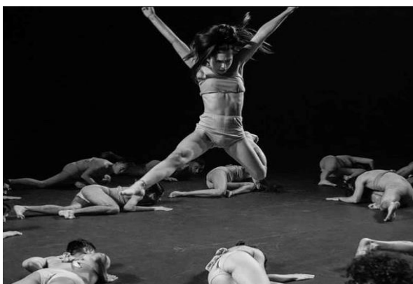
Imagen 3. Compañía Amateur

La segunda persona entrevistada pertenece a la compañía “Amateur”, la cual nació hace 1 año a partir del sueño –hecho realidad- de hacer una película sobre trastornos psicológicos retratados a través de la danza y performance. Está compuesta por 25 cuerpos diversos que buscan desbordar el género y el erotismo interior a través de una mirada y estética performática.