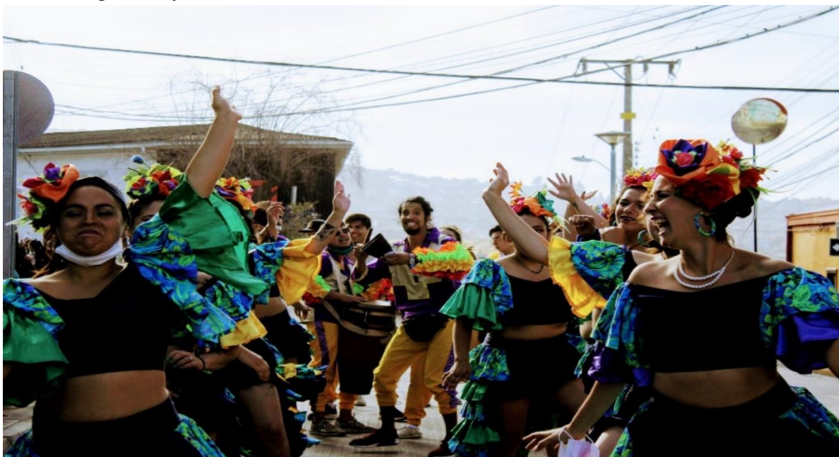
Imagen 1. Conga Comparsa La Kalle

especialmente presente en luchas ambientales, contra el racismo, por la salud digna y educación gratuita y de calidad.