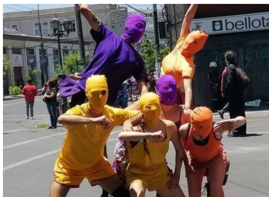
Imagen 4. Compañía Limo

La cuarta persona entrevistada pertenece a la compañía de danza “Limo”, la cual tiene 10 años de existencia y está compuesta por 12 personas. Se define como un laboratorio de investigación del movimiento con un enfoque multidisciplinario. Se caracteriza por intervenciones callejeras con mensajes explícitos que se condicen con una lucha antifascista desde estéticas que se desprenden de las normas de género hegemónicas. La quinta persona entrevistada forma parte del colectivo “La Xoxo y La Tuli”, la cual nace en el contexto pandémico del 2021 y está compuesta por 2 personas. Básicamente, el colectivo se basa en un ejercicio performático en el cual dos mujeres trans encarnan satíricamente la identidad de dos mujeres burguesas racistas, clasistas y homo/transfóbicas. Cabe rescatar que este colectivo se limita a un espectáculo virtual por el momento.