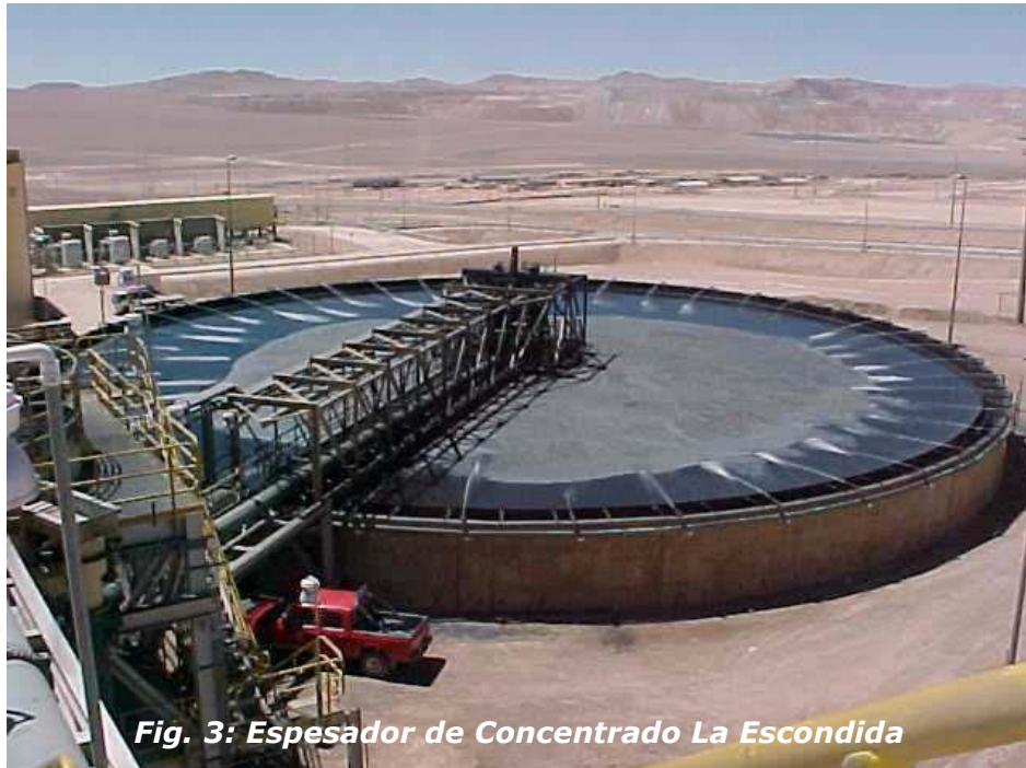
Fig. 3: Espesador de Concentrado La Escondida

comerciales a través de la adición de reactivos químicos, los que suelen ser altamente tóxicos 14 .