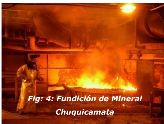
Fig: 4: Fundición de Mineral Chuquicamata

Este es el último proceso de la minería metálica y consiste en la recuperación de los metales contenidos en el mineral por medio del calentamiento a altas temperaturas.