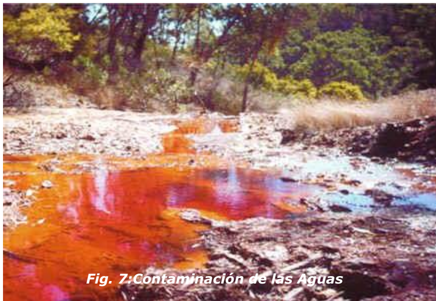
Fig. 7:Contaminación de las Aguas

Un factor grave es el hecho de que uno de cada tres seres humanos en los países del sur carecen de agua potable y un 80% de las enfermedades producidas en ellos es por la contaminación de las aguas.