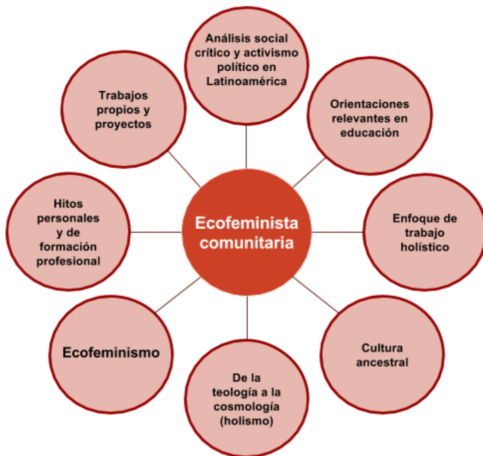
Figura 3. Categorías y núcleo de contenido: relato de Judith Resz.