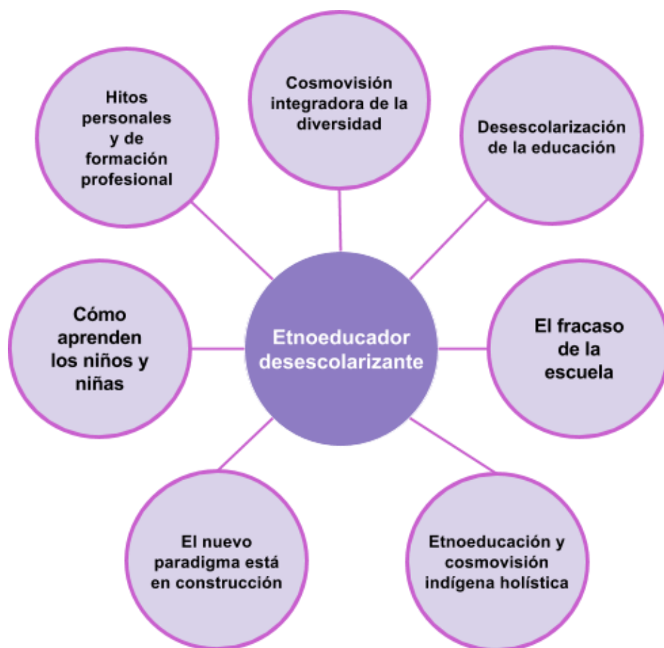
Figura 2. Categorías y núcleo de contenido: relato de Carlos Calvo.

Este núcleo temático fue construido a partir de un análisis relacional de las categorías obtenidas mediante el proceso inductivo del análisis de contenido, como se visualiza en la Figura 2.