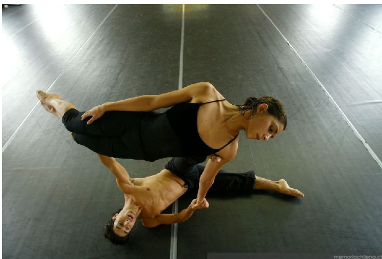
Bailarines del BANCH

En la actualidad la única compañía de danza contemporánea que recibe subvención del estado es el Ballet Nacional Chileno, Ballet perteneciente a la Universidad de Chile, creado en 1945 y que posee en la actualidad una línea de creación contemporánea.