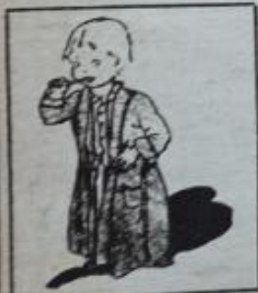
Paddy aprende a lavarse los dientes.

Acuérdese que el niño necesita verdura, fruta, aceite de bacalao, leche, dándoselos según lo aquí indicado. Así se previenen muchas de las enfermedades comunes de Chile. Es mejor y más fácil prevenir que curar.