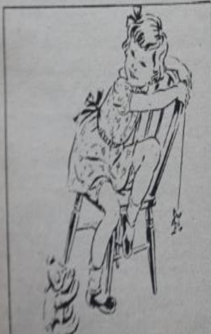
¡Nunca más quiere quedarse sin los lindos moldes de juguetes que ofrece "Margarita"!

El hilillo de agua no contestó. Pensaba: "Si la sustancia a estas raicillas, no podrá crecer y