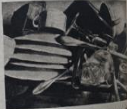
— Peligrosa manera de amontonar los platos lavados.