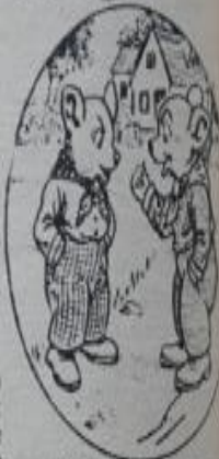
—Oye, Oute; cómo ser así pobres en tu casa.

Al día siguiente el hilillo de plata no brillaba al sol; un pequeño derrumbe de tierra y cascotes de piedra le había sepultado; fué el Falsán, que, intencionalmente, cuando hacía el ni-