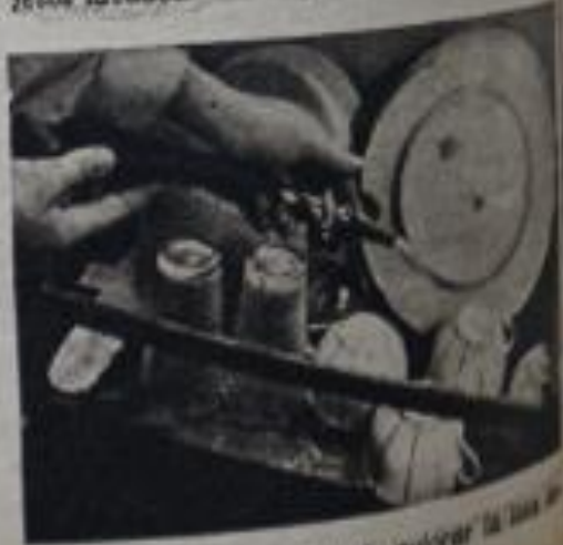
— Correcta manera de colocar la loza lavada en el lavaplatos.