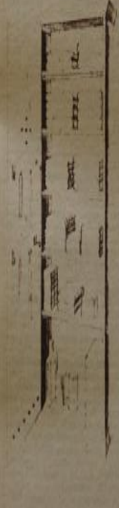
Modelo de armario especial para el cuarto de toilette; cabe en un espacio reducido y sus divisiones prestan muchos servicios.

En la primera fotografía la revista de 1934 entrega una sección denominada "Margarita en tu casa". En esta página se utilizan diversos elementos gráficos. Tales como una mujer tejiendo, muebles de un hogar y una alfombra redonda. Las dos últimas imágenes poseen directa relación con el texto que hay.