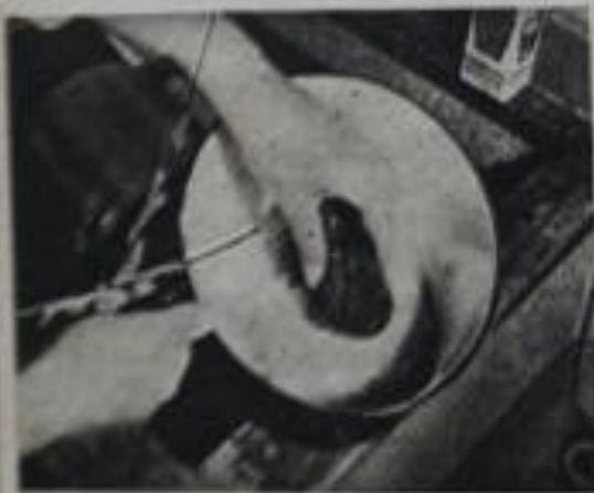
— Una esponja de metal para limpiar las cosas.