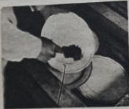
— La escobilla se empleará en lugar del trazo.

de la cantidad de suciedad que se desprende con este sencillo procedimiento. No es necesario poner las manos en esta agua sucia. Se toma cada pieza por lavar por el borde y se escobilla hasta dejarla limpia con una buena escobilla y con agua caliente. Después se coloca al lado izquierdo del lavaplatos y se vuelve a enjuagar con agua caliente. Se entiende que antes de lavar la loza, se botarán de ella todos los restos de comida al tarro de la basura. Para no ensuciarse las manos se toma para ello un pedo de papel, hecho pelota.