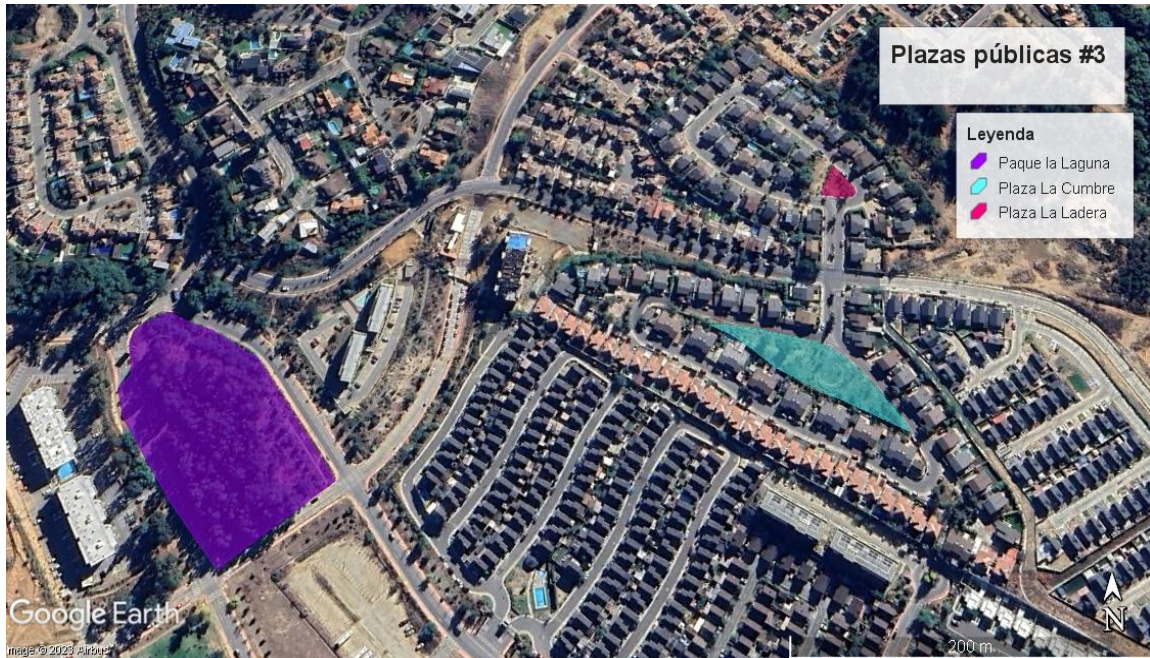
Mapa N° 3; Localización Plazas públicas en Curauma, Placilla.