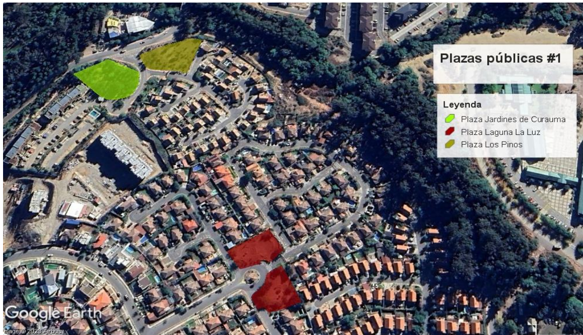
Mapa N° 1; Localización Plazas públicas en Curauma, Placilla.