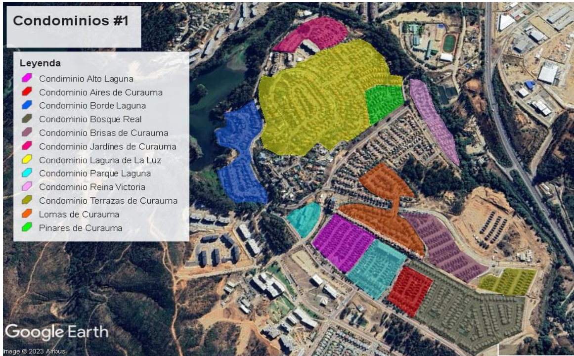
Mapa N° 1; Localización condominios de Curauma, Placilla.