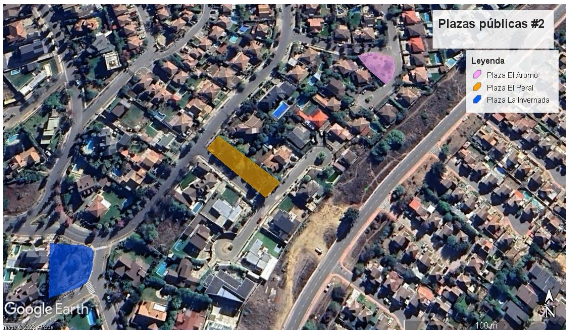
Mapa N° 2; Localización Plazas públicas en Curauma, Placilla.