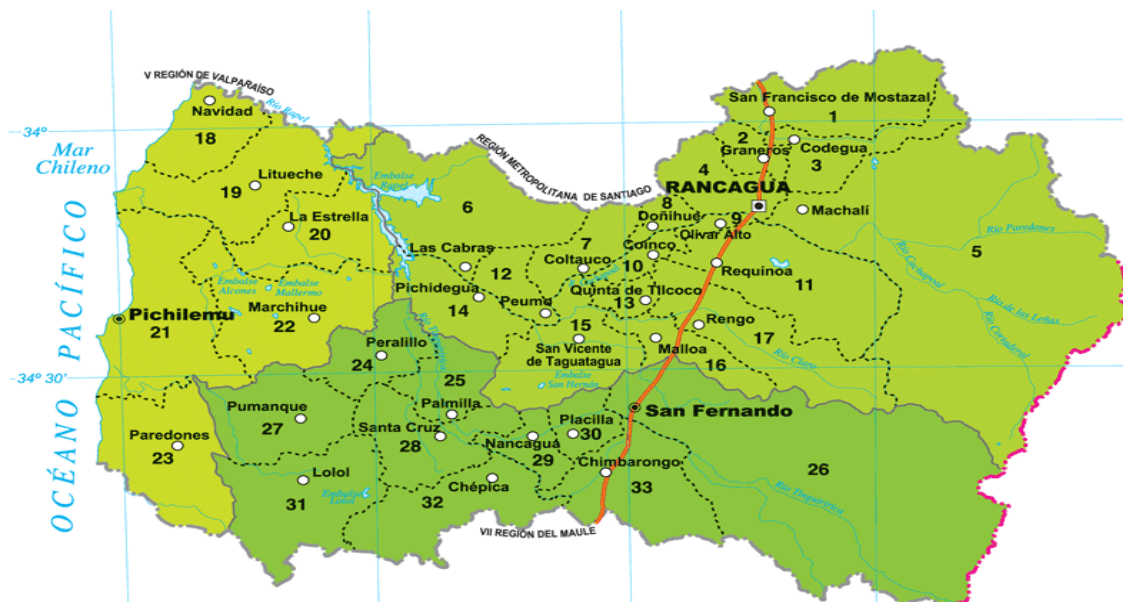
Figura 1.1 División política administrativa de la Región de O'Higgins