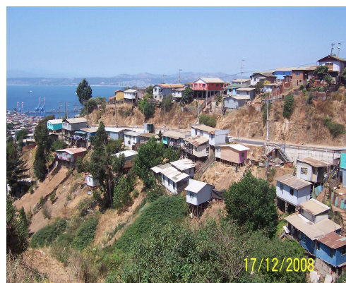
Fotografía 26: Viviendas sector Cañería.