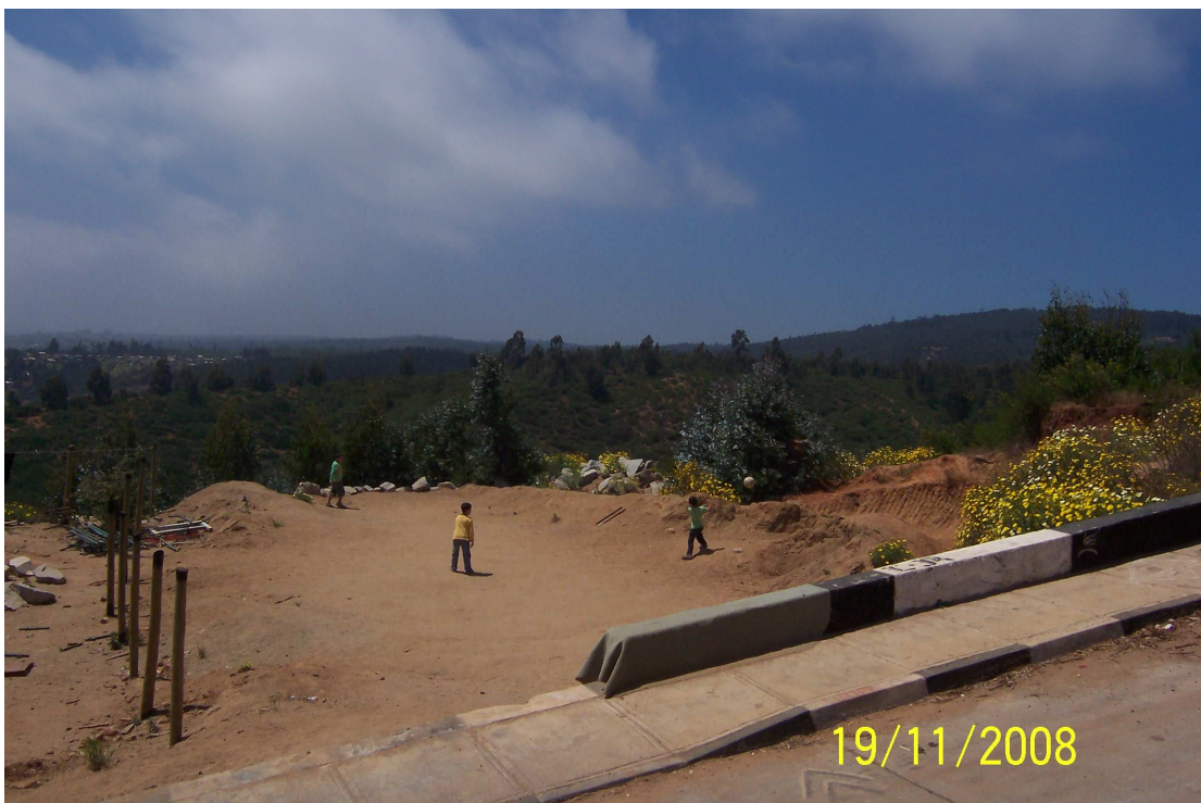
Fotografía 4: Sitio cedido en comodato a al comité de vivienda para la construcción de una cancha de futbol.