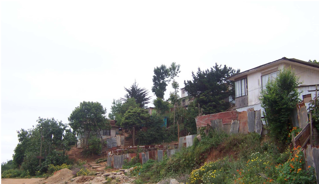
Fotografía 10: Viviendas sector quebrada Eduardo Frei población Héroes del Mar.