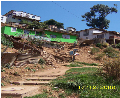
Fotografía 27: Viviendas Quebrada Sector Cañería.

Por otra parte es importante destacar que se han hecho esfuerzos por mejorar la calidad de vida de los habitantes del sector como por ejemplo la participación como organización comunitaria en fondos concursables para el mejoramiento de la calidad de vida del barrio, lo que en reiteradas ocasiones han podido ganar y así mejor la infraestructura urbana del sector lo que va en pro del mejoramiento de la calidad de vida de las personas.