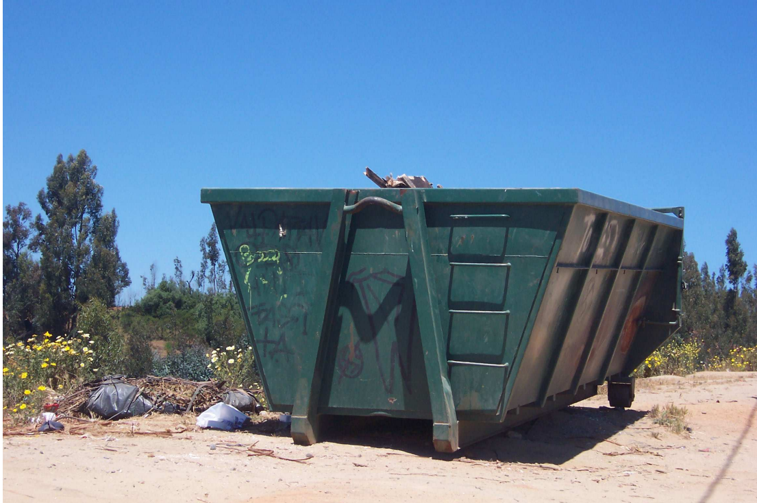
Fotografía 1: Batea Población El Vergel Cerro la Cruz

Población El vergel Alto, Cerro la Cruz.