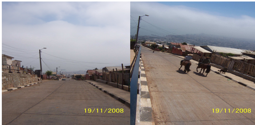
Fotografía 13: Principal vía de acceso a la población.