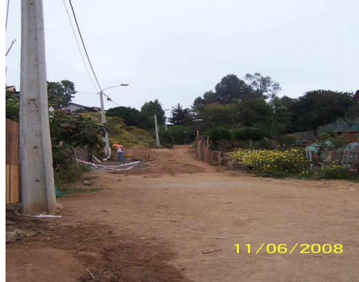
Fotografía 18: Trabajos de Alcantarillado en el sector.