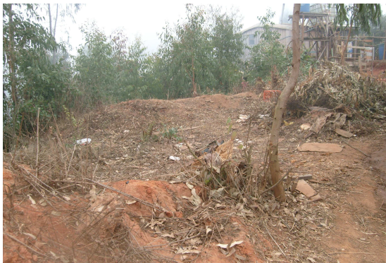
Fotografía 7: Se presenta el medio ambiente que rodea la población del vergel alto, principalmente bosque de eucaliptos altamente combustible.

De esta manera los habitantes subsisten la ciudad entrega los recursos necesarios para la sobrevivencia en la quebrada, el vivir en esta zona permite el acceso a centro de comercio que abastecen una vez al mes a las familias se obtiene lo necesario a bajo costo, además es allí donde pueden llevar una vida que permita la crianza de animales que venderán y permitirán tener ingresos para poder llevar una mejor calidad de vida.