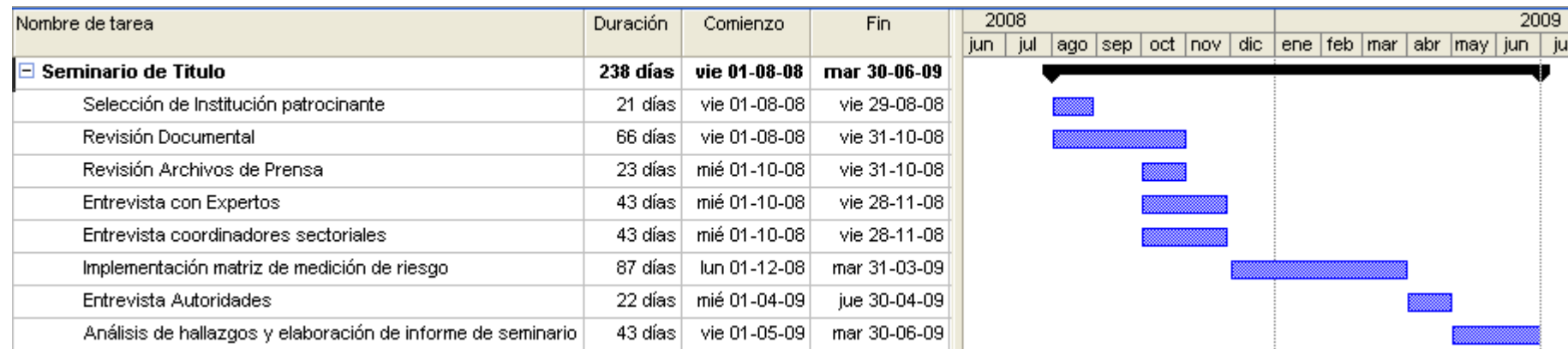
Carta Gantt con actividades del seminario de titulo 2008 - 2009: