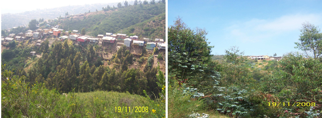
Fotografía 11: Entorno Población Manzana H Fotografía 12: Bosque cercano a la Población Cerro Mariposa Alto