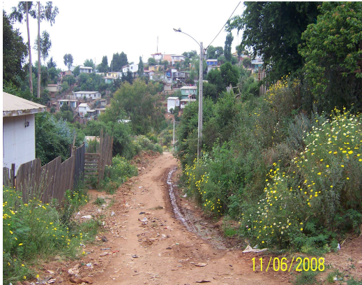
Fotografía 17: Sector Quebrada Eduardo Frei.