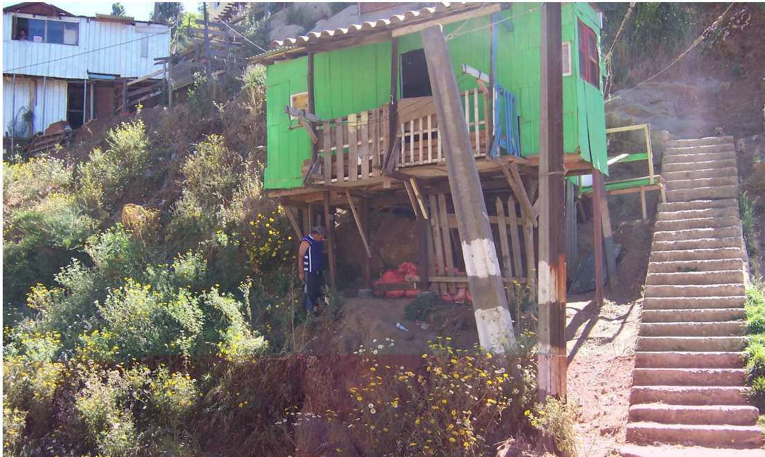
Fotografía 5: Vivienda construida en la ladera del cerro, sector cañería.