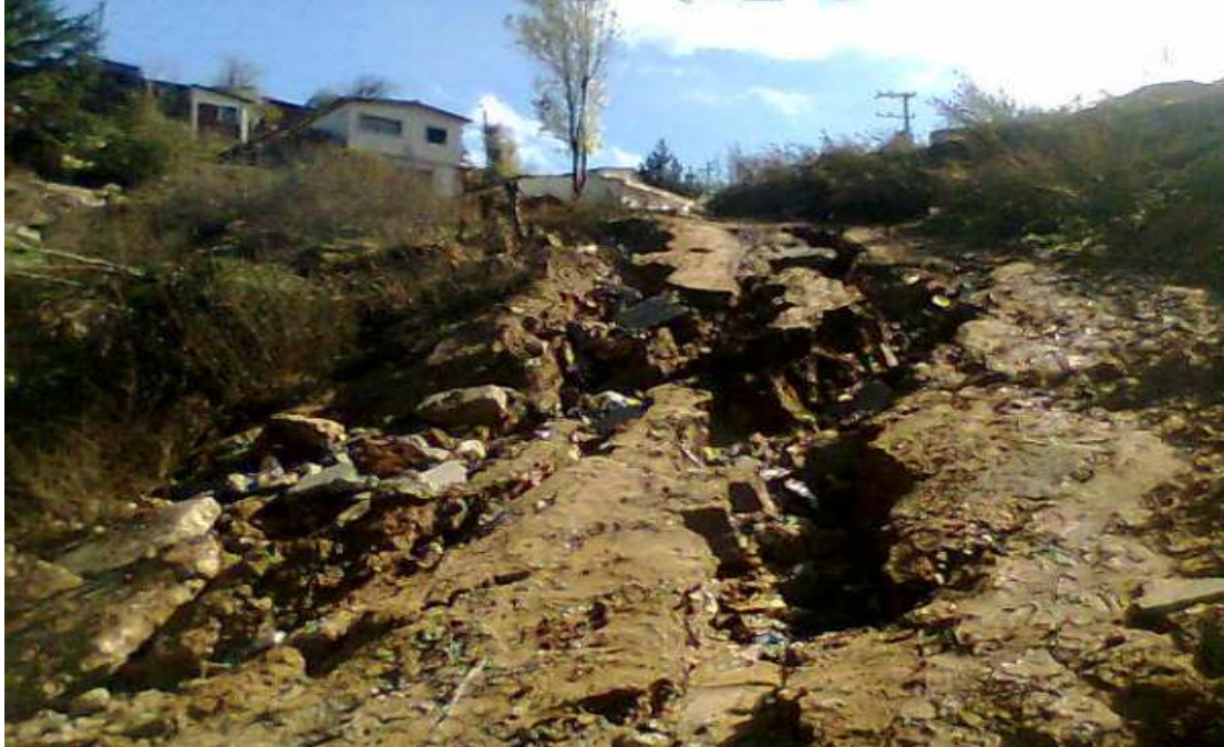
Fotografía 7: Deslizamiento de tierra sector quebrada colo colo.