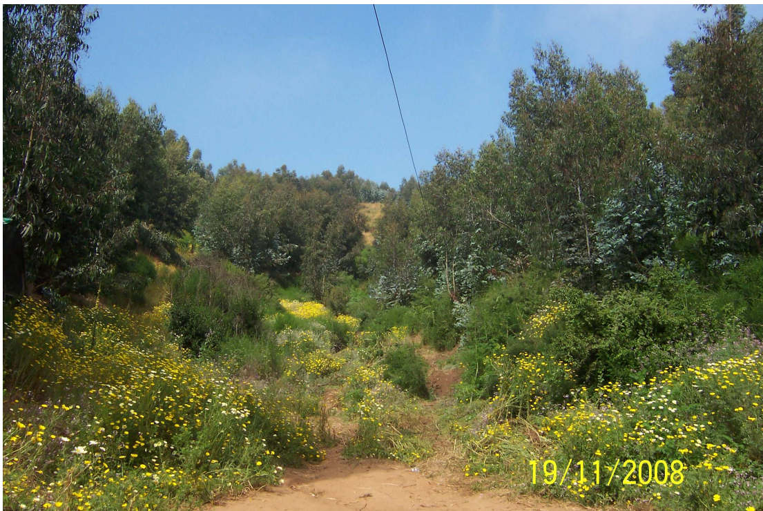
Fotografía 3: Fondo de quebrada, que separa el cerro mariposa del cerro mena.