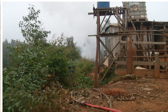
Fotografía 8: Incendio forestal, pone en peligro las viviendas aledañas.