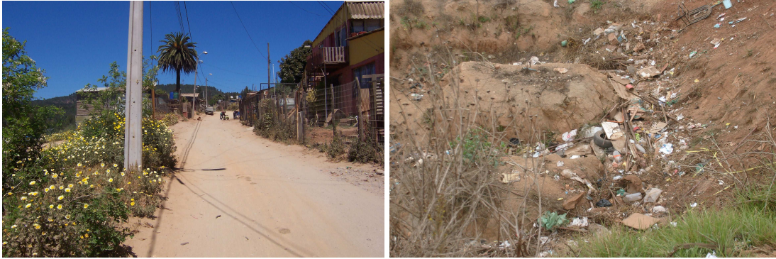
Fotografía 5: acceso principal a la población el Vergel Alto. Fotografía 6: escombros arrojados a la quebrada.