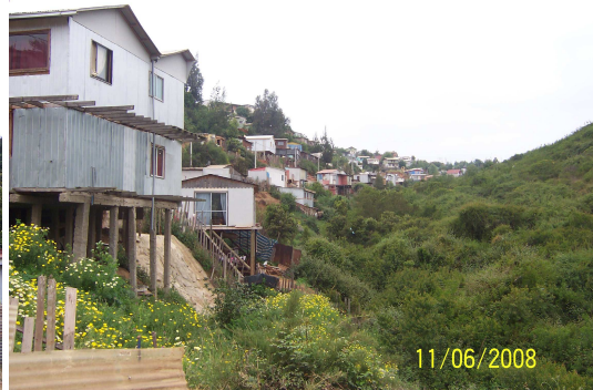
Fotografía 20: Viviendas sector quebrada Colo Colo.