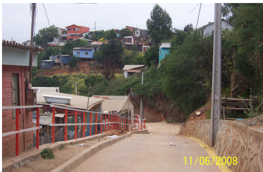
Fotografía 21: Trabajo de Pavimentación y barandas completo, sector quebrada Colo Colo.

Según los antecedentes recabados por quienes suscriben, a través del proceso investigativo, es posible establecer que la organización social comunitaria objeto de estudio, Juntas de Vecinos del sector 143 A y 143 B pertenecientes a la Unidad Vecinal 143, corresponden a organizaciones sociales de carácter formal vigentes amparadas y constituidas bajo los lineamientos de la Ley N° 19.418 de Juntas de Vecinos y Organizaciones Comunitarias.