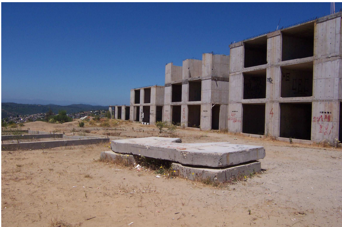
Fotografía 2: Proyecto de viviendas sociales no terminado, a pasos de la población.