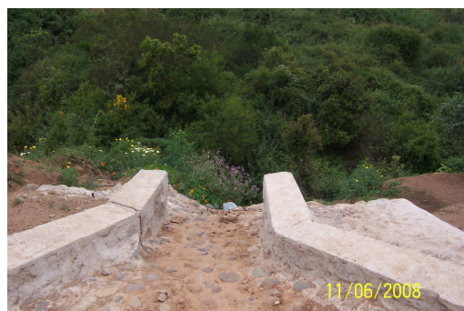
Fotografía 22: Obras de evacuación de aguas lluvias.