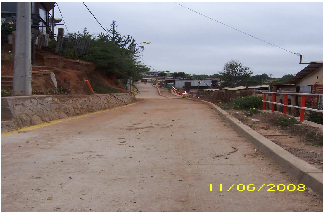
Fotografía 8: Obras de pavimentación quebrada colo colo.