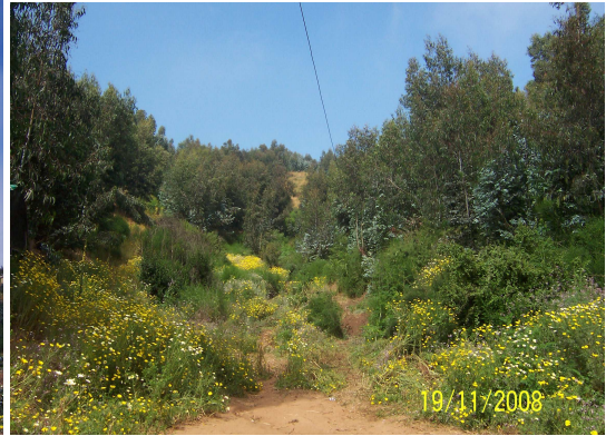
Fotografía 16: Fondo de Quebrada, divide el Cerro Mariposa del Cerro Mena.