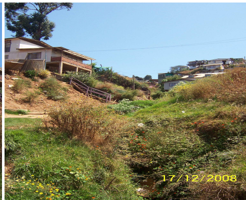
Fotografía 28: Quebrada Sector Cañería.