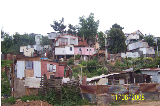
Fotografía 19: Viviendas sector quebrada Eduardo Frei.

Este escenario es propicio para que los infantes y los adolescentes se dediquen a la vagancia, o a no ocupar su tiempo libre en actividades productivas para su desarrollo. Conllevando a aumentar los riesgos en actos delictivos, consumo de drogas y alcohol, perjudicando el bienestar de la comunidad Héroes del Mar 56 .