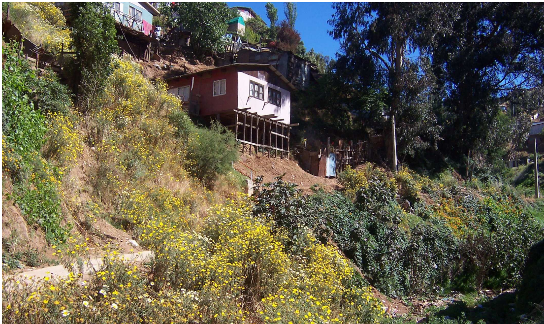
Fotografía 6: vivienda construida en ladera del cerro, se visualiza los rellenos en el terreno.