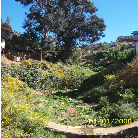
Fotografía 23: Quebrada Sector Cañería, Cerro Cordillera.