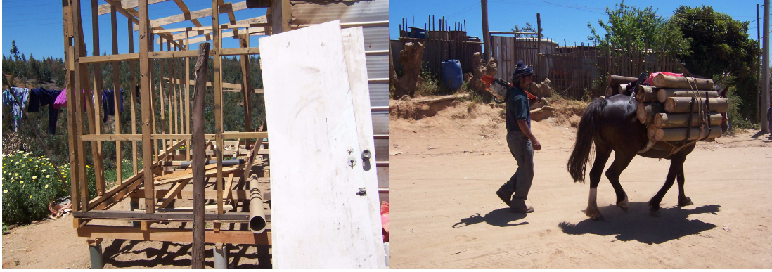
Fotografía 3: Autoconstrucción de vivienda, material ligero.