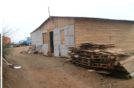
Fotografía 10: Autoconstrucción de una vivienda, cuyo material principal es la madera.