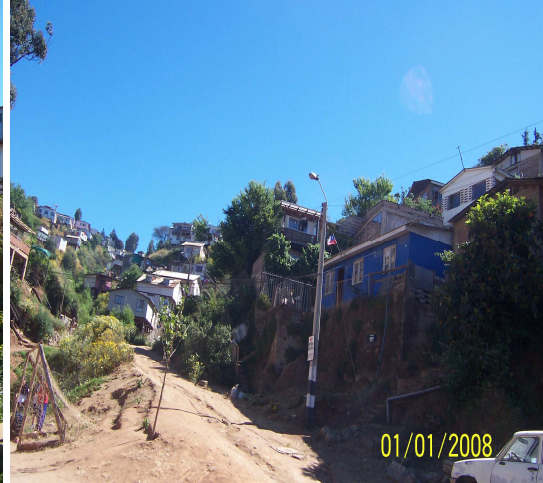
Fotografía 24: Sector Cañería, Cerro Cordillera.