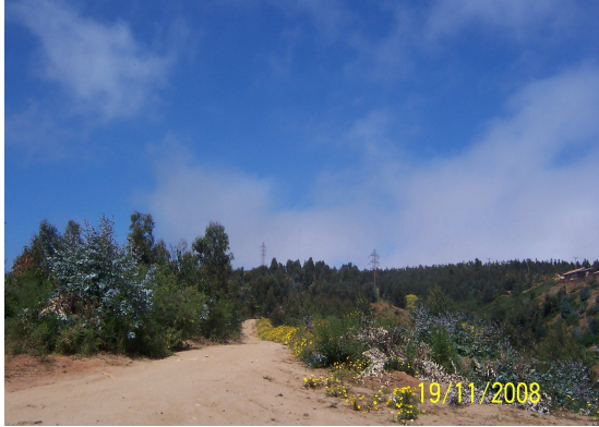
Fotografía 15: Cortafuego realizado por CONAF.