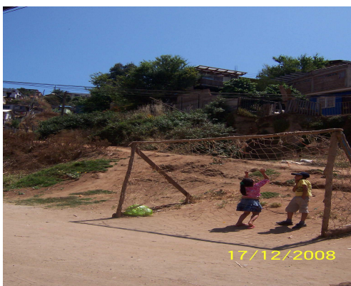
Fotografía 25: Niños jugando.

Asimismo la comunidad cuenta con iluminaría pública en su calle principal y en sus pasajes, el servicio de recolección de basura asiste regularmente al sector dos veces por semana a pesar de ello se observa la presencia de micro basurales.