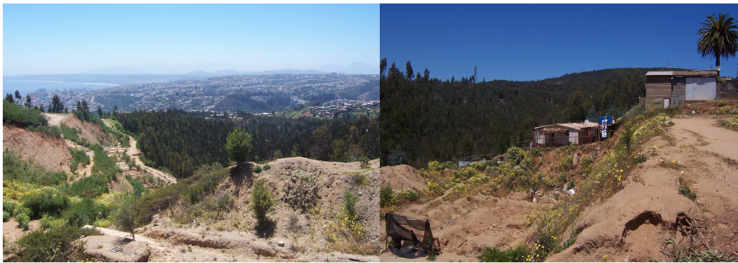
Fotografía 1: Entorno población el Vergel Alto, Cerro La Cruz. Bosques de eucaliptos ubicados en laderas y fondos de Quebradas.