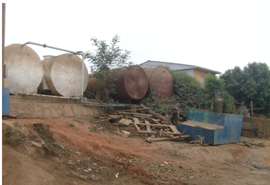
Fotografía 9: Estanques de agua. Abastecidos por camiones aljibes de la Ilustre Municipalidad de Valparaíso.