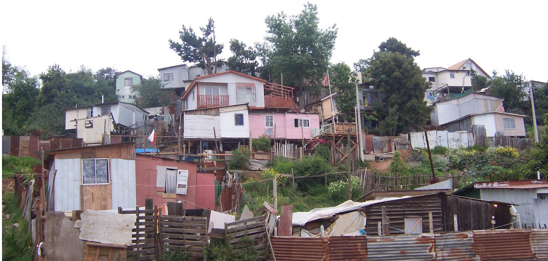
Fotografía 9: Viviendas sector quebrada Eduardo Frei población Héroes del Mar.