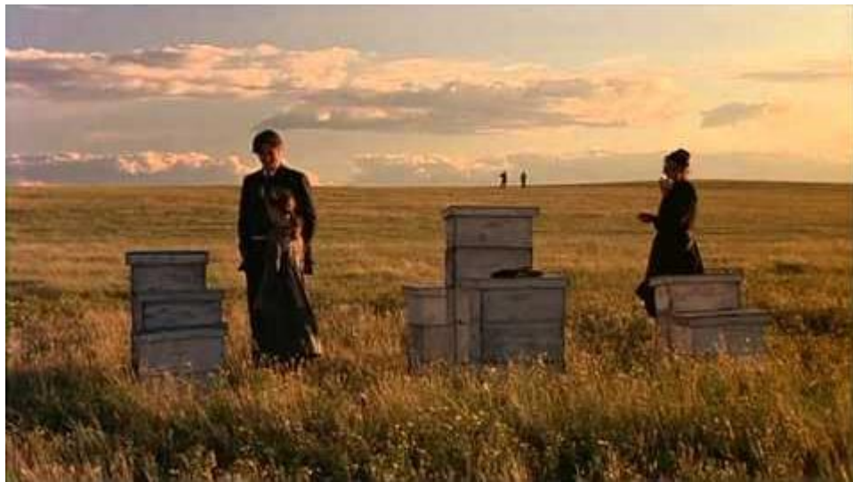
Ilustración 3 Days of heaven (1978) Dir. Terrence Malick