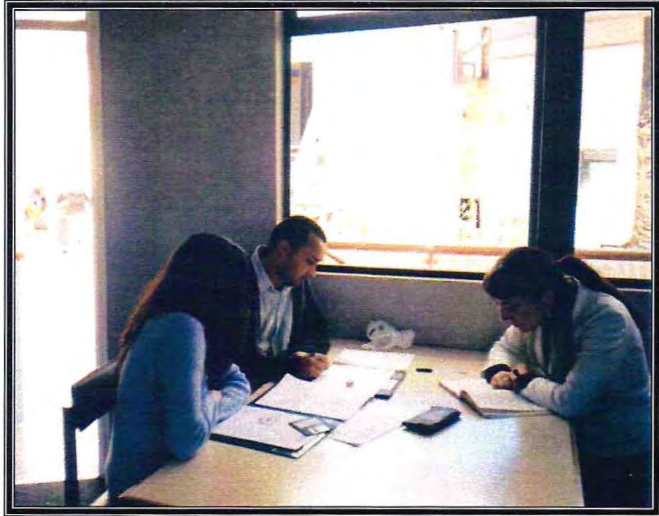
Sala de Estudio, 2° Piso de la Biblioteca de la Escuela de Trabajo Social, Universidad de Valparaíso.