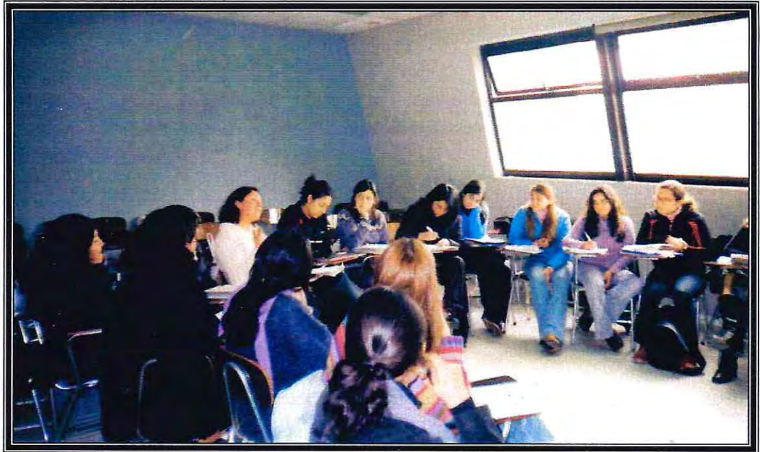
Taller grupal de Supervisión Académica de alumnas en Práctica de Trabajo Social de Comunidad.