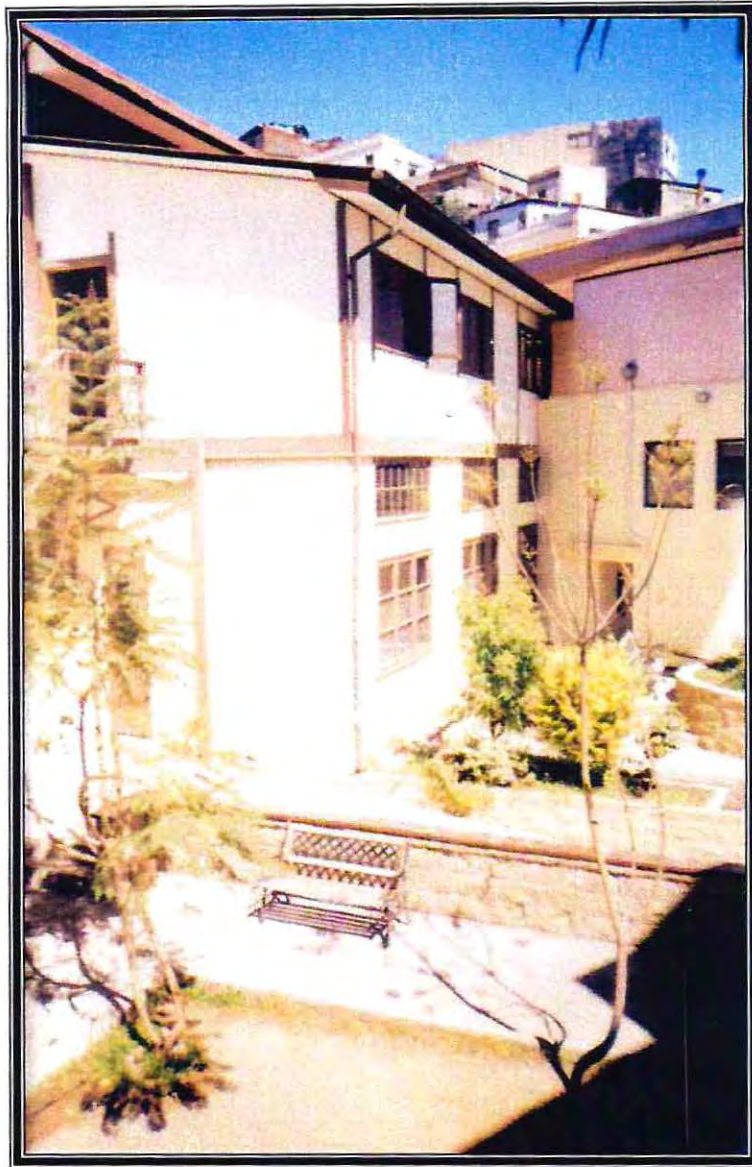
Patio Central de la Escuela de Trabajo Social, Universidad de Valparaíso. 2004.