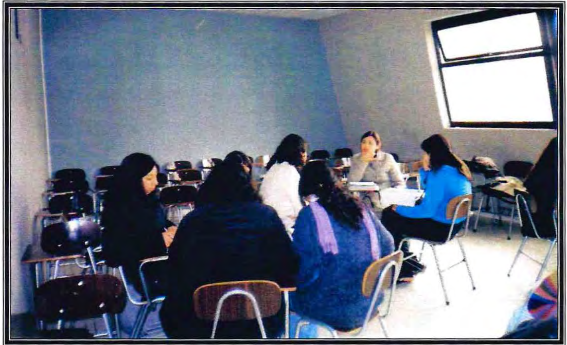
Taller grupal de Supervisión Académica de alumnas en Práctica de Trabajo Social de Comunidad.