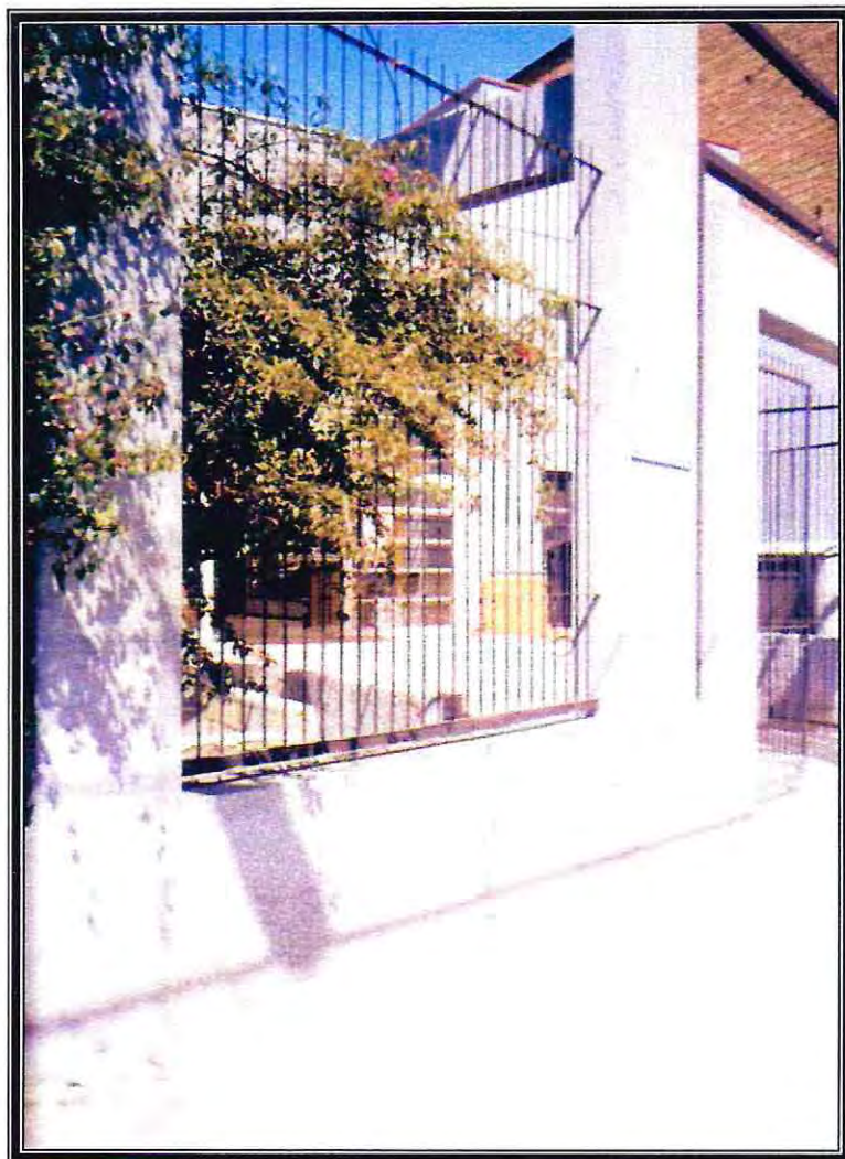
Frontis de la Escuela de Trabajo Social de la Universidad de Valparaíso. 2004.