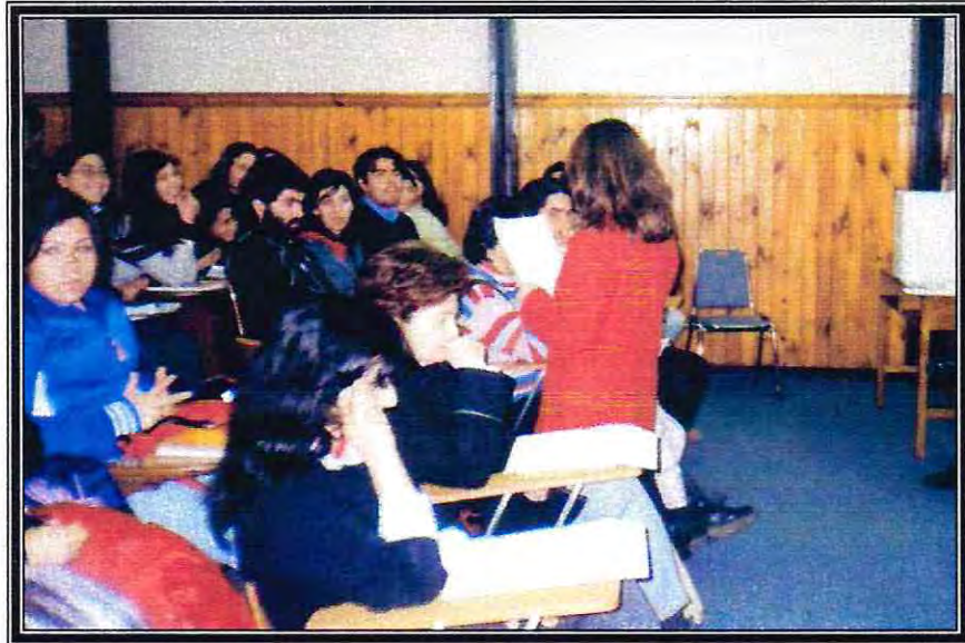
Asignación de Prácticas Profesionales, Nivel de Intervención Profesional de Caso.