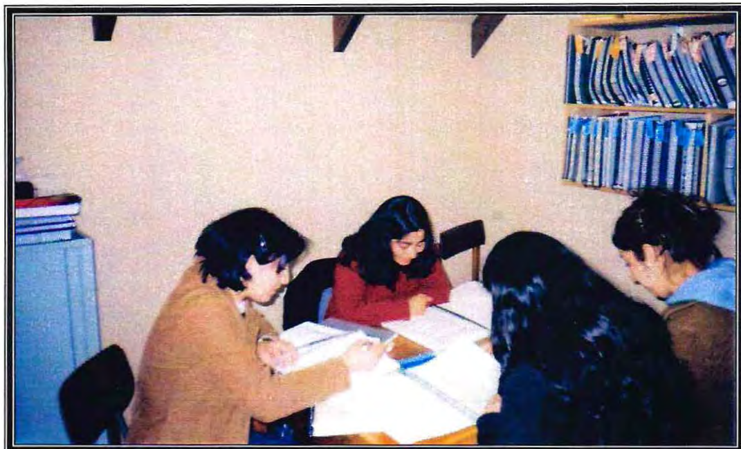
Alumnas trabajando en el Centro de Documentación de Prácticas Profesionales de Trabajo Social.