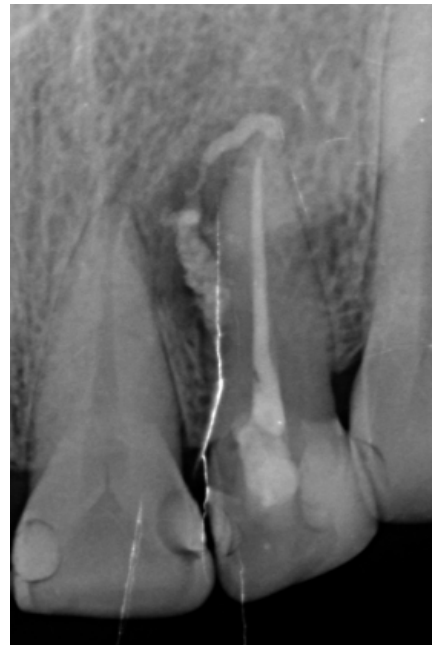
Figura 4: Radiografía de control de obturación final inmediata. Se observa obturación de los conductos laterales y una extensa extrusión de cemento a través del ápice hacia la zona de la lesión.