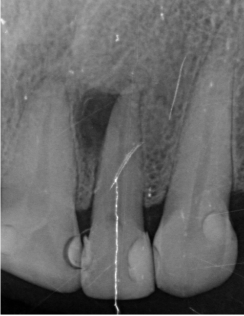
Figura 1: Radiografía inicial. Se observa la presencia de conductos laterales a nivel del tercio apical radicular y una lesión radiolúcida extensa apicolateral.