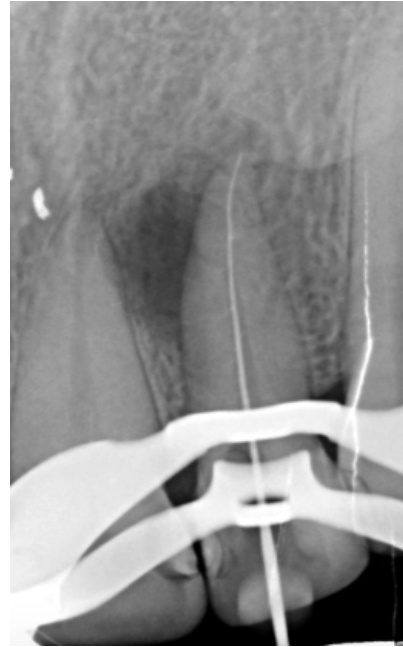
Figura 2: Radiografía de control de longitud de trabajo.