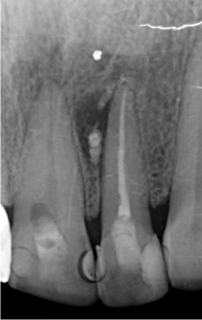
Figura 5: Radiografía de control a los 3 meses de obturación de conducto radicular. Se evidencia ausencia de cemento en los conductos laterales y aparente reabsorción parcial del cemento a nivel del tercio apical y disminución del tamaño de la lesión.