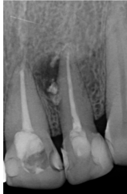
Figura 6: Radiografía de control a los 5 meses de obturación de conducto radicular. Se observa reducción del tamaño de la lesión comparado con las radiografías iniciales (ver figura 2 y 3) que demuestra cicatrización ósea en evolución.