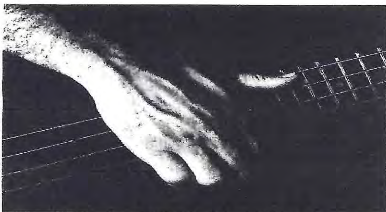
(Fig 1: "Thumb" extraída del texto "Slap Bass Essentials", Josquin Des Pres, 1995)

El Slap consiste principalmente de dos partes, el pulgar (o en inglés "thumb", su nomenclatura es la "T" o "S" por Slap-thumb en la partitura y tablatura) de nuestra mano derecha el cual es el elemento percusivo con el que se martilla y el "Popping" (su abreviación es la "P" en la partitura y tablatura), el cual corresponde a jalar o dar un tirón a la cuerda con nuestro dedo índice.