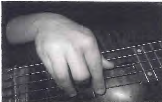
(Fig 3: elaboración personal)

En cuanto a los armónicos artificiales o falsos armónicos, son todos aquellos armónicos que no se encuentran disponibles de forma natural sobre las cejillas o dentro de cada traste. Debido a esto, estos armónicos se obtienen mediante el siguiente procedimiento; si se quiere obtener el Do ubicado en el traste 5 de la 1ª cuerda digitamos dicho traste con cualquier dedo de la mano izquierda y con la mano derecha pulsamos exactamente la misma nota (en la misma cuerda) una octava más alta, esto es, en el traste 17.