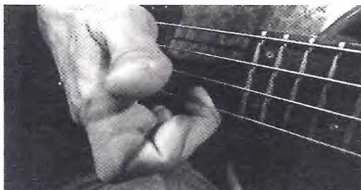
(Fig 2: "Popping" extraída del texto "Slap", Sergio Ferrante, 2002)

La siguiente imagen ilustra la notación escrita del Slap (Slap-thumb) y Popping: