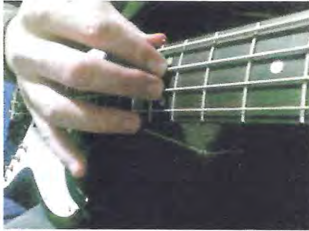
( Fig 4: extraída del portal http://bajomximos.blogspot.com/2013/12/tapping-ritmico-en-el-bajo-i.html )

En las palabras de DE BORJA (2011) 14 “Dentro del desarrollo que tuvo el tapping en el bajo, se pueden diferenciar dos vertientes distintas, una es el “tapping guitarrístico” y la otra “el tapping pianístico” (nótese que estas no son denominaciones standard). Por “tapping guitarrístico” me refiero a aquel tapping idéntico al utilizado por Van Halen pero llevado a las cuatro cuerdas. En este tapping, por lo general interviene un solo dedo de la mano derecha, el cual luego de haber producido la nota mediante un “tap”, se retira de la cuerda mediante un pull off. La mano izquierda por otra parte, se posiciona en la misma cuerda que la derecha, generando las notas mediante movimientos de “hammer-on” y “pull-offs”.