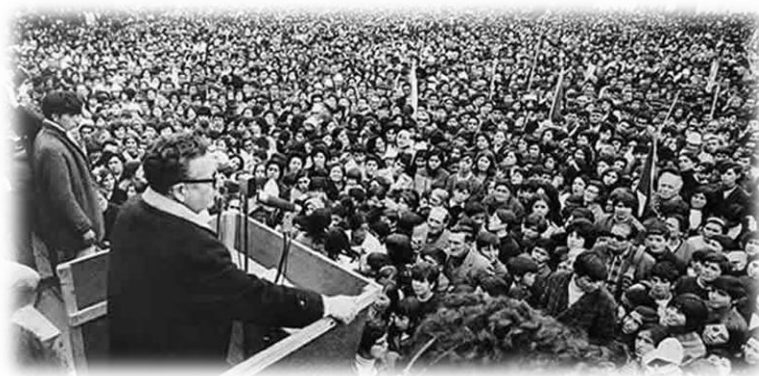
Discurso presidente Salvador Allende Gossens; 1970

Durante la unidad popular, a través del trabajo colaborativo y visión ideológica entre trabajadores y marxistas que pertenecían a partidos políticos como el socialista y partido comunista, Los sindicalistas avanzaron rápidamente en una agenda práctica, de mejoramiento de las condiciones de los trabajadores, como también en otra agenda ideológica, que tenía por finalidad una transformación nacional anti-capitalista.