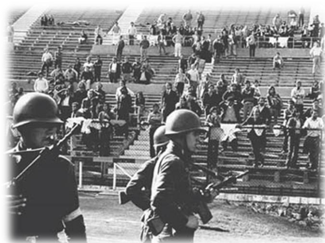
Estadio nacional, septiembre 1973; Detenidos a la espera de ser llamados a interrogatorio

Por otro lado, las violaciones a los derechos humanos afectaron a miles de chilenos entre los que se identifican políticos de izquierda, dirigentes sindicales y poblacionales, artistas y a todos quienes se sindicaron como simpatizantes del derrocado gobierno de la Unidad Popular. Estos hechos se convirtieron y se reconocen como una política de Estado en ese momento puesto que, la violación de los derechos humanos se llevó a cabo mediante los órganos estatales existentes. 22 Las fuerzas armadas, y unidades que se crearon especialmente para tales efectos como la Dirección de Inteligencia Nacional (DINA) y la Central de Inteligencia Nacional (CNI), se encargaron de llevar adelante y mantener la violación sistemática de tales derechos durante todo el período de dictadura militar, en primera instancia para exterminar todo lo relacionado al gobierno anterior y luego, para reprimir los movimientos sociales que exigían la democratización del país.