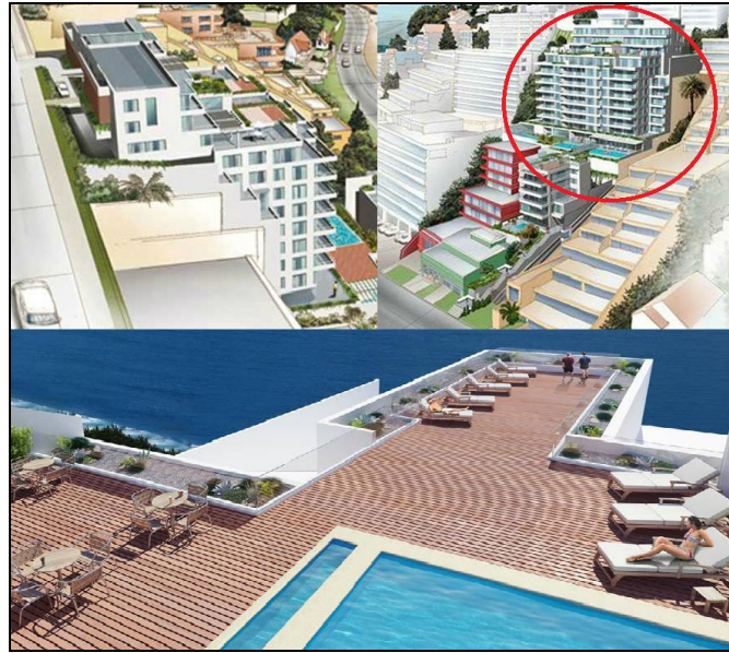
IMAGEN N° 2: Proyecto en ejecución de la empresa en estudio