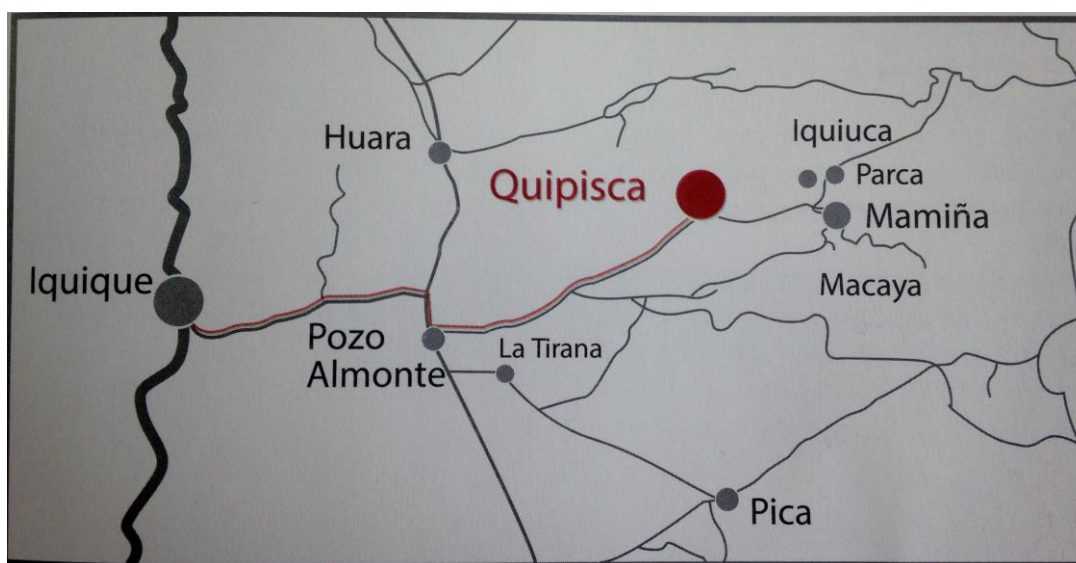
Imagen extraída de libro de la comunidad Indígena Territorial Quechua de Quipisca.

La comunidad indígena territorial quechua de Quipisca se encuentra ubicada en una de las quebradas de la precordillera de la región de Tarapacá, Chile. Ubicada a 2.100 metros sobre el nivel del mar, a 112 kilómetros de la ciudad de Iquique, en la comuna de Pozo Almonte, provincia del Tamarugal.