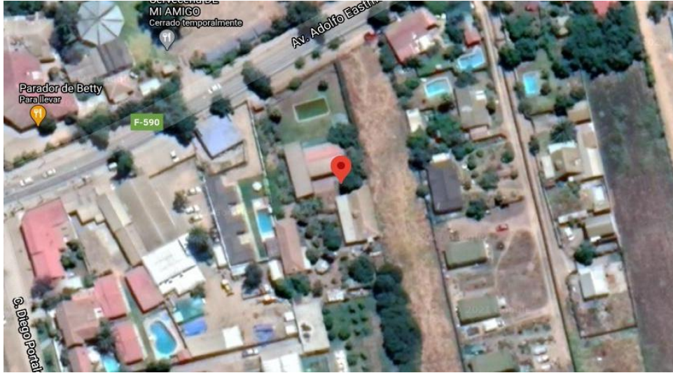
Figura 1. Mapa de ubicación geográfica Fundación Adultos Mayores Chile

La Fundación Adultos Mayores Chile (FAMCHI) es una institución sin fines de lucro, es decir, no tienen como finalidad el beneficio económico, sino más bien cuenta con un carácter social y humanitario hacia las personas mayores con un trabajo en terreno buscando “potencializar las relaciones entre los vecinos y concientizarlos para que puedan cuidar a las personas mayores de sus alrededores.” (FAMCHI, 2021).