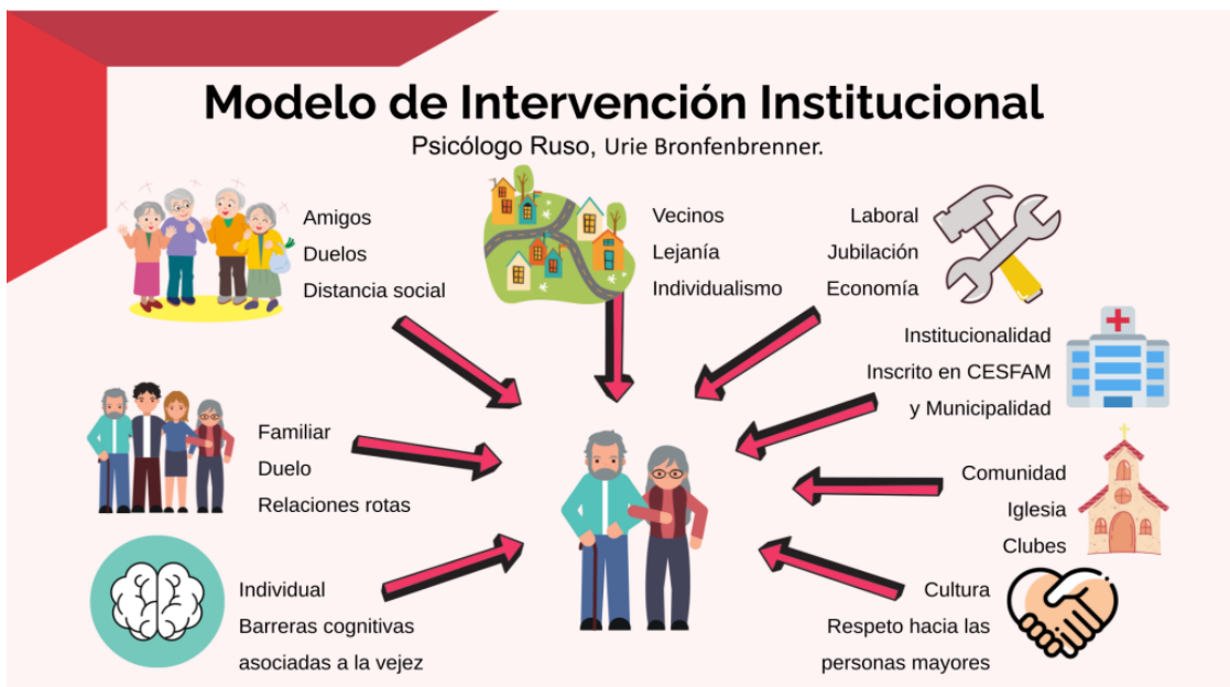
Figura 2. Modelo de Intervención institucional