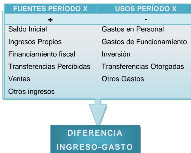
Figura N° 1: Esquema Diferencia Ingreso-Gasto

Esta Diferencia Ingreso-Gasto corresponde al Saldo Final del ejercicio de un período pasando a ser el Saldo Inicial del período siguiente, el cual puede ser comprobado y controlado con la diferencia que se produce entre los Activos y Pasivos señalados en el punto 2.1 de este capítulo, siendo en este caso los resultantes del período en revisión.