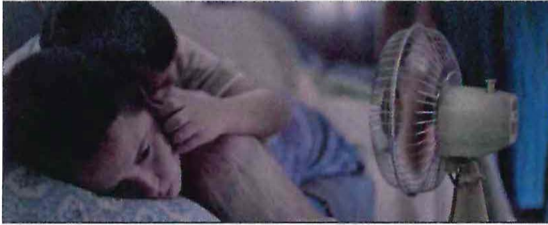
El verano del León eléctrico, 2018