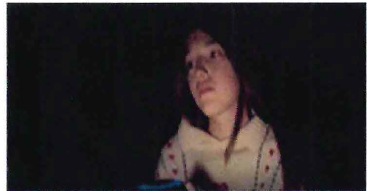
De jueves a Domingo, 2012