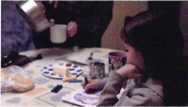
Alitas Cortadas, 2019