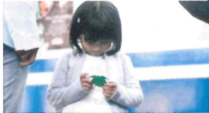
Michi no Tsukindensya, cortometraje