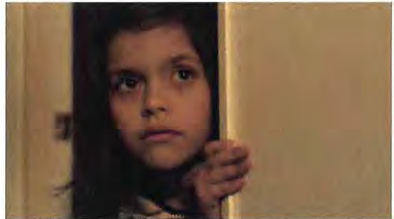
Alitas Cortadas , 2019 (maqueta)

que se hicieron durante el proceso no afecto a la estructura narrativa final.