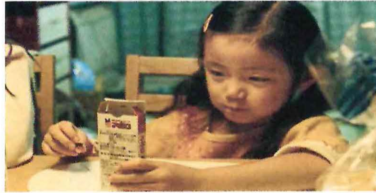
Nobody knows, 2004