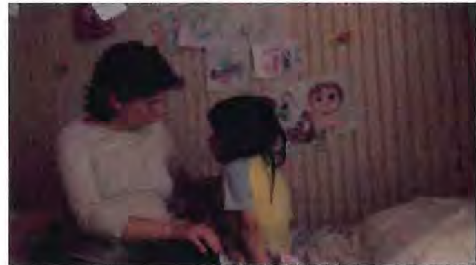
Alitas Cortadas, 2019