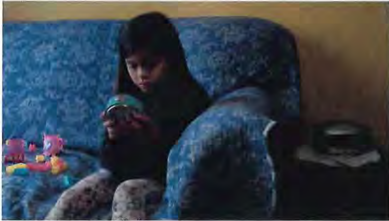
Alitas Cortadas, 2019