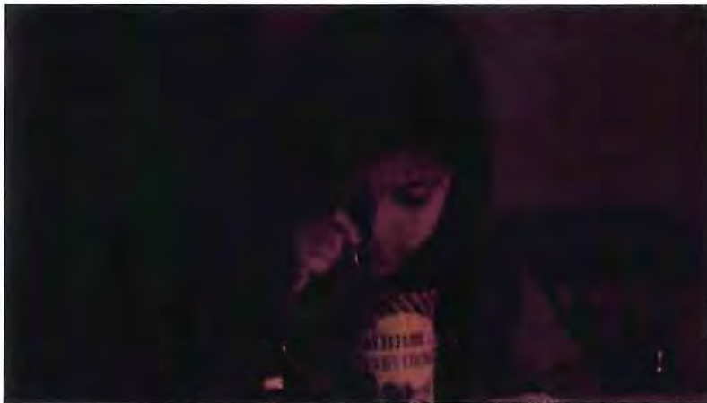
Alitas Cortadas, 2019

emboscada al personaje, esta luz manipulada crea sombras, arrugas, crea efectos psicológicos del personaje, en función de donde se coloque cambia la atmósfera de una película, en su mayoría se usó la luz natural con la cual fue siempre acompañada por luz artificial generando un alto contraste.