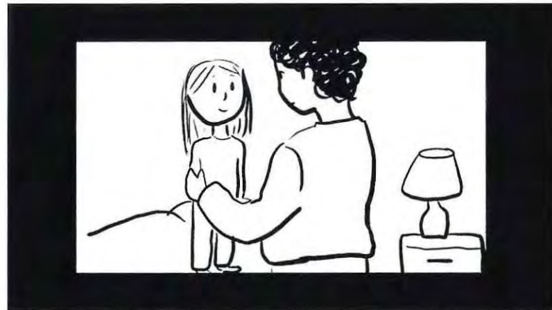
Alitas Cortadas, Storyboard, 2019