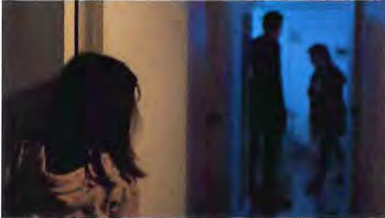
Alitas Cortadas , 2019 (maqueta)