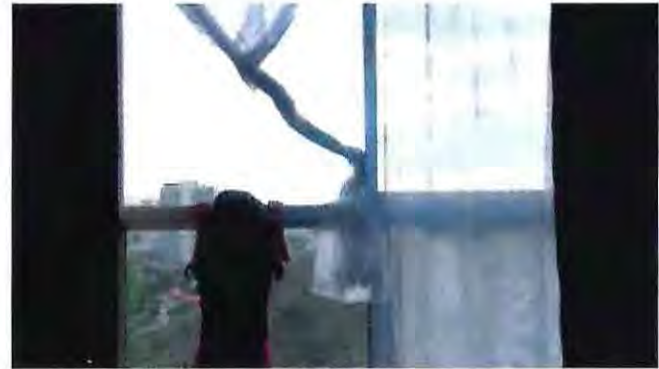
Alitas Cortadas, 2019

algunas técnicas planteadas que me servirán y aplicare en el futuro profesional próximo.