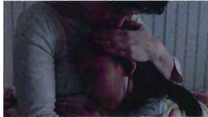
Alitas Cortadas, 2019