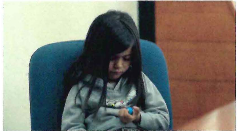
Alitas Cortadas, 2019