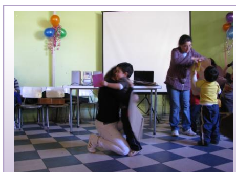
Fomento del afecto al interior de la familia.

Es con respecto a lo anterior que resulta importante destacar que la entrega de valores a los padres, madres y/o apoderados/as, es entendida no tan solo en lo que respecta a la convivencia en el jardín infantil, si no que se pone especial énfasis en la necesidad de que esto sea llevado a la practica en otras esferas de la vida cotidiana de quienes participan de la comunidad educativa. Todo ello a través del ejemplo como equipo educativo, lo cual da paso a generar una transformación en la forma de