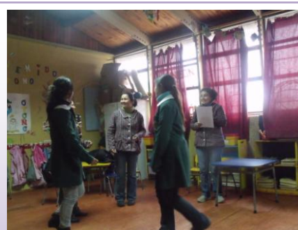
Actividad autocuidado equipo educativo Jardín Infantil Ramaditas.

se programa y realiza una actividad de autocuidado 1 , donde además se expresa la necesidad de generar una cultura de paz en toda la comunidad educativa, esto a través de la generación de actividades tendientes a promover los lineamientos centrales de los jardines infantiles, específicamente en la creación de afiches, actividades con los padres, madres y/o apoderados/as donde se haga