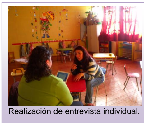
Realización de entrevista individual.

En cuanto al trabajo con padres, madres y/o apoderados/as se observó la existencia de la capacidad de diálogo y búsqueda de consensos que se plantean en las coordinadas para el crecimiento en la paz de la corporación Serpaj, ello en la forma en que se manejan los conflictos y en el respeto frente a la individualidad de la persona buscando resguardar por sobre todo la privacidad que ameritan ciertas temáticas que son trabajadas por el equipo y el estamento que se menciona, propiciando con ello una zona de paz donde se resuelvan de una manera pacífica los conflictos. A su vez se trabaja en la instauración de valores ético-sociales en las familias, ello a través del desarrollo de habilidades acordes a la etapa de crecimiento de las/os niñas/os, de modo que se fomenta la generación de independencias en los/as mismos/as por parte de sus padres y madres, lo cual tiene por finalidad la transformación de acuerdo a la cultura de paz.