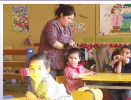
Existe apoyo de las auxiliares de aseo en el trabajo con niñas/os.

Es importante destacar que si bien cada uno de los roles dentro de los equipos educativos poseen distintas funciones, éstas resultan ser igualmente importante, ya que sin una de ellas la otra no podría funcionar a cabalidad.