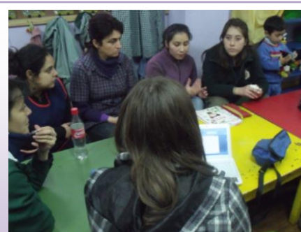
Entrevista grupal al equipo educativo Porteñitos por la Paz.

Las educadoras de párvulos entrevistadas, identifican como parte de su rol al interior de los jardines infantiles la planificación de actividades diarias realizadas con niños/as y apoderado/as, así mismo dichas planificaciones debiesen integrar la educación para la paz, como un objetivo transversal en todas las actividades que se realizan. Ateniéndose lo anterior a la misión y visión que plantea Serpaj como también los expuestos por los propios jardines infantiles, sumando a ello los principios pedagógicos de las bases curriculares de la Educación Parvularia. A través de dicha planificación es que surge una nueva función de las educadoras, la que dice relación con la necesidad de generar análisis críticos y reflexivos de las acciones que se realizan en torno a la educación para la paz, de modo que a través de dicha evaluación se creen nuevas formas de trabajo respecto a educación para la paz.