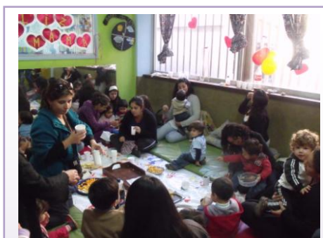
Celebración día de la madre Jardín Infantil Porteños por la Paz.

Con respecto a una actividad realizada por ambos jardines infantiles, la cual fue la celebración del día de la madre (07 de Mayo del 2010, Jardín Infantil Ramaditas y Jardín Infantil Porteños por la Paz), se pudo recoger ciertos antecedentes en cuanto al trabajo con los/as padres/madres en torno a la cultura de la paz. En dicho momento se manifestó la intención por parte del equipo educativo de trabajar en forma coordinada y colaborativa con el estamento, intentando hacer partícipes a las/os apoderadas/os de la actividad, estimulando a su