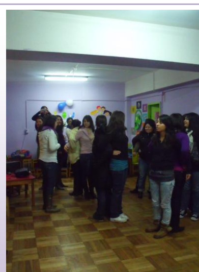
Jornada de capacitación Jardines Infantiles Serpaj Valparaíso.

En cuanto a este estamento cabe mencionar que el énfasis está puesto en la buena convivencia, el buen trato y la buena comunicación, así también con el respeto que se debe tener con cada una de las integrantes del equipo, ya que de esta forma se entiende que más que un grupo de trabajo se genera un equipo de trabajo, que posea metas comunes, para así poder desarrollar de mejor manera sus tareas al interior de la comunidad educativa.