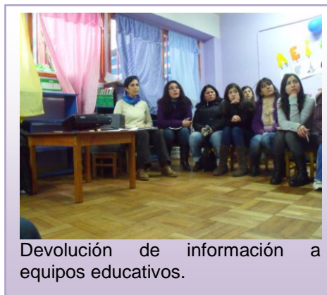
Devolución de información a equipos educativos.

Durante las entrevistas individuales se menciona una vez más la relevancia que se le otorga a la buena comunicación y al buen trato entre el estamento, de modo que se