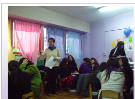
Jornada de capacitación de Serpaj Valparaíso para los Jardines Infantiles

Lo que se puede advertir de lo mencionado por las entrevistadas, es que aun cuando no existe un trabajo en el mismo equipo en cuanto a educación para la paz, si se generan estrategias para poder llevar de mejor manera el ejercicio sobre educación para la paz con los otros estamentos. Lo anterior dice relación con la necesidad de generar un compromiso a favor de la reconciliación social, puesto que existe la iniciativa de mejorar el trabajo que se realiza para lograr el entendimiento sobre educación para la paz y así aportar al cambio de mentalidad de la comunidad educativa, sin embargo surge la necesidad de fortalecer este trabajo de manera mas consiente, a través de actividades planificadas previamente desde y para el mismo equipo educativo.