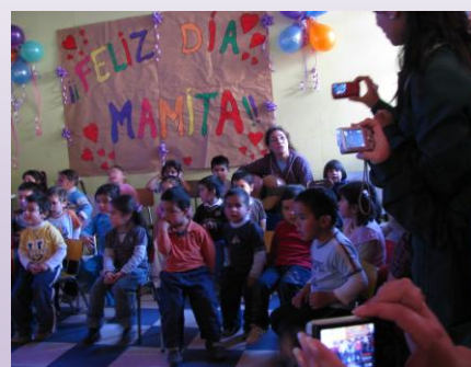
Celebración día de la madre Jardín Infantil Ramaditas.