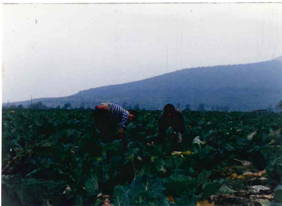
Jóvenes de la comunidad en edad escolar, realizando labores agrícolas.

cabe señalar, que la población mayor de seis años, constituida por los hijos de los parceleros y fuerza de trabajo de la comunidad, que actualmente no estudia, posee un bajo nivel de instrucción. Dicha situación es difícil de modificar, puesto que este grupo humano dejó de pertenecer al sistema formal de enseñanza para incorporarse a la actividad productiva, ya que según la opinión de los propios afectados, sus familias carecen de los recursos económicos necesarios para subsistir y, que a la vez, les permitan continuar estudiando.