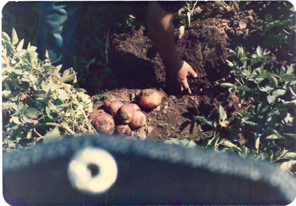
Tipo de producción de las parcelas de la Comunidad.

g) Flora : La comunidad estudiada, es eminentemente agrícola, por lo que la gran mayoría de las tierras cultivables son ocupadas por producción hortícola, en donde se destacan especialmente : tomates, alcachofas, repollos, lechugas, choclos y papas.