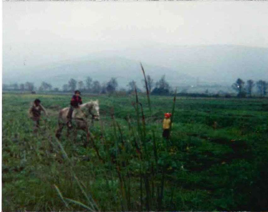
Técnica de producción agrícola tradicional utilizada por los campesinos del predio.

La comunidad campesina estudiada, utiliza técnicas de producción agrícola, principalmente de tipo tradicional. Es frecuente observar en el trabajo, el uso del arado, cultivadora y otros utensilios afines, de tracción animal. El desmalezamiento se realiza con herramientas rudimentarias como el azadón, pala y horqueta. Además, cabe destacar la utilización del caballo, para la realización de la actividad denominada triilla.