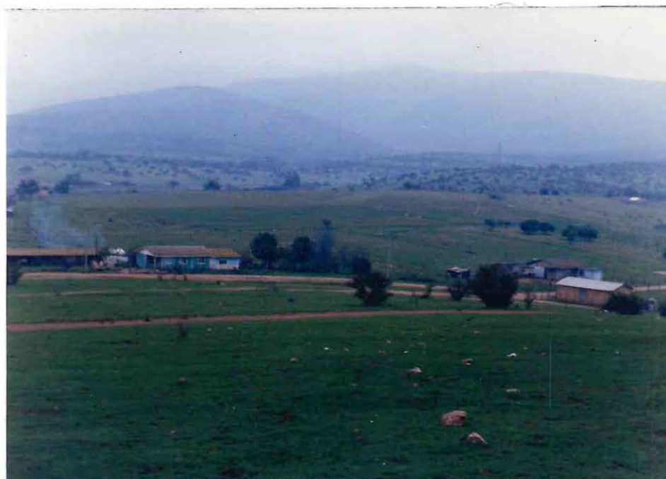
Visión parcial del sector de la comunidad que presenta relativa dispersión geográfica.

Ahora bien, en relación a la variable "Dispersión Geográfica", para efectos de esta investigación, fue definida como al lejanía física entre los grupos familiares de la comunidad campesina. El indicador de esta variable o la lejanía física de las viviendas, se entenderá cuando las casas estén ubicadas a más de 50 metros de distancia una de otra.