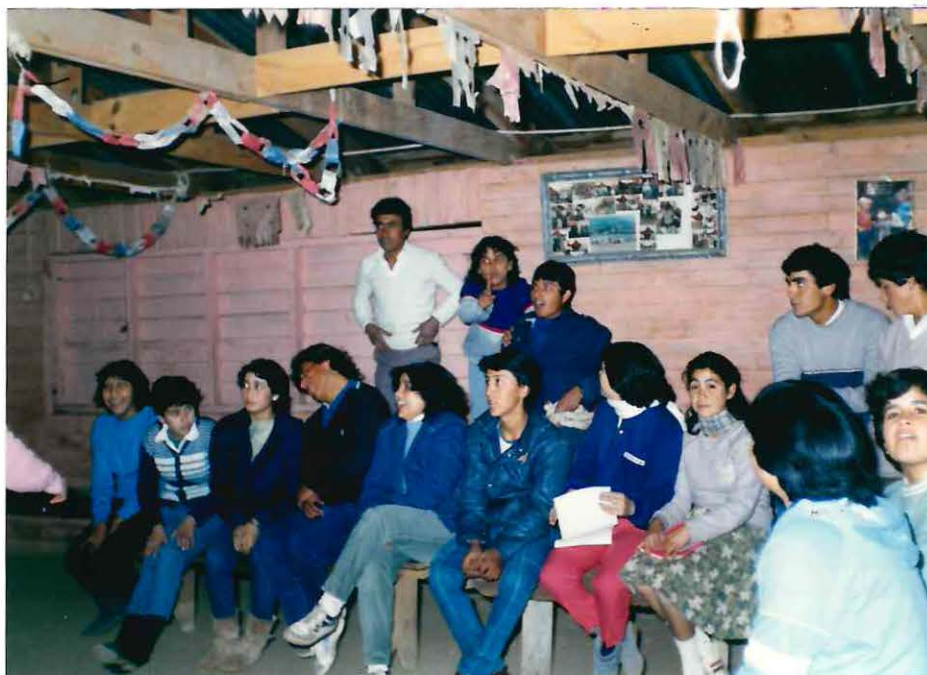
Algunos jóvenes campesinos durante el desarrollo de una sesión de la Organización Promocional Juvenil Campesina "Unión y Esfuerzo"

Desarrolla una labor destacada de información a los jóvenes campesinos, sobre diversos temas de su interés específico.