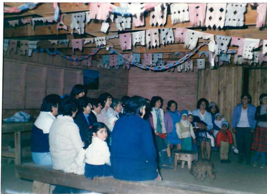
Algunas mujeres campesinas en el transcurso de una reunión de la Organización Promocional Femenina Campesina "Los Corazones".

La organización quedó conformada por 45 socias, las que realizaron las actividades necesarias para estructurarse internamente como tal, procediendo a elegir la directiva de la misma, la que quedó conformada por La Presidenta, La Vicepresidenta, La Secretaria y Prosecretaria, La Tesorera y Protesorera. Además, se eligió el nombre de la organización de entre varios propuestos, optándose por la denominación " Grupo Social Femenino " Los Corazones de El Cajón ". Asimismo, por acuerdo de las socias, la organización cuenta con un financiamiento interno obtenido a través de cuotas sociales de monto reducido, para que la totalidad de las integrantes pueda afrontarlas. Dichas entradas se incrementan con actividades diversas; tales como rifas internas, onces, etc., que se realizan periódicamente, de acuerdo a la disponibilidad de dinero de las socias.