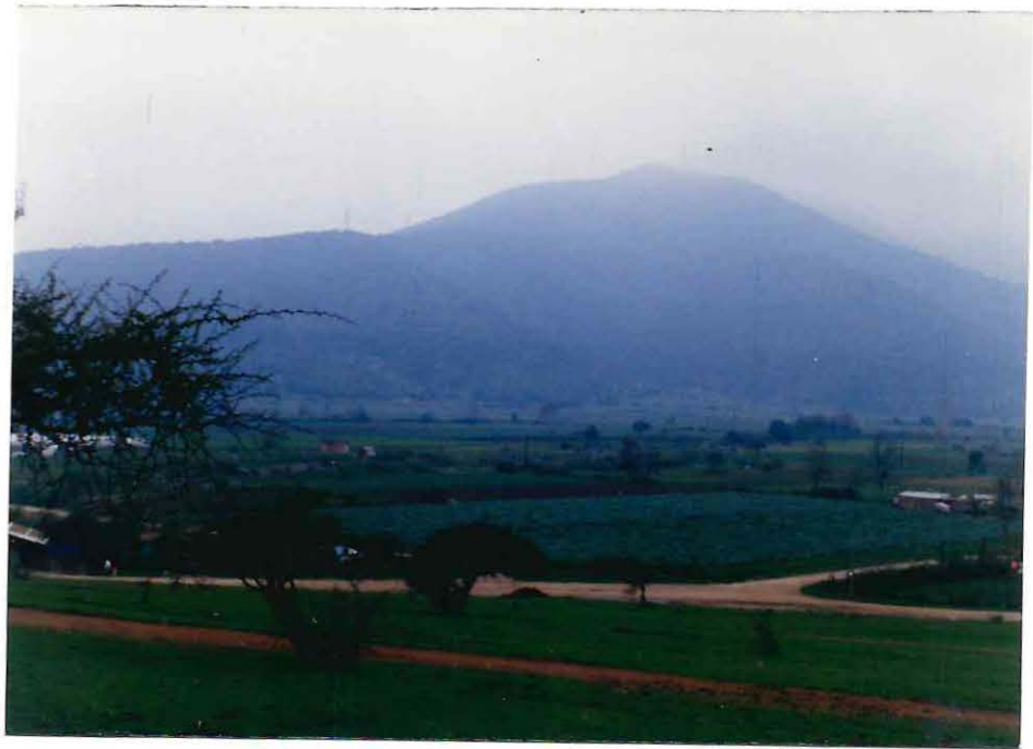
Panorámica de la Comunidad Campesina "El Cajón" de San Pedro.

b) Superficie del Terreno : El área territorial de la comunidad, cubre una superficie aproximada de 5.253,4 hectáreas. Dentro de ésta, encontramos 43 parcelas que cubren 341,2 hectáreas de la superficie total y que son utilizadas para el cultivo agrícola, principal actividad de la comuna estudiada. Además, existe terreno de secano arable, el que alcanza a 4.912,2 hectáreas y corresponde a aquellas tierras no parceladas, especialmente cerros, los que no son explotados con producción agrícola. Estos cerros fueron atribuidos a la comunidad como bienes comunes y tienen derecho a usufructuar de ellos, todos los asignatarios de parcela.