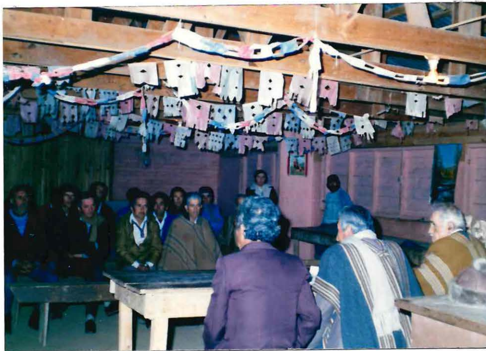
Vista parcial de asistentes a una reunión de la Sociedad Agrícola "El Cajón de San Pedro Ltda."

Es importante recalcar, que la entrega de contenidos se orientó principalmente a superar los problemas de funcionamiento que presentaba la Sociedad Agrícola "El Cajón de San Pedro Ltda." y a demostrar a sus socios - que ésta constituye una instancia altamente efectiva para afrontar y superar las problemáticas comunes que representan. Así, fue posible reforzar a los socios de la organización los conocimientos que éstos poseían acerca de los elementos que debían estar presentes para la mejor ejecución de una reunión. Cabe señalar, que éstos ya conocían algunos de estos elementos, como resultado de la capacitación entregada en su oportunidad por funcionarios de la Corporación de Reforma Agraria. Ello, tuvo gran importancia puesto que permitió que el Equipo de Seminario reforzara tales aspectos, en base al conocimiento que poseían. Es así, que se les complementó la información que tenían en relación a la buena marcha de una reunión, con charlas educativas acerca de la toma de decisiones, dinámica y tratamiento de temas en las sesiones.