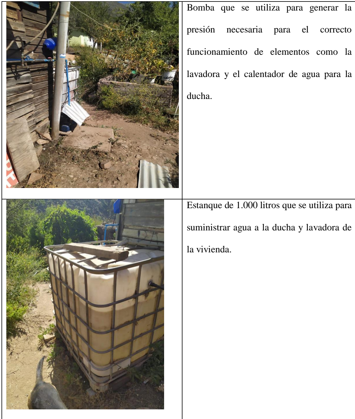
Tabla 1: Equipamiento de la Vivienda - René Astorga Gómez