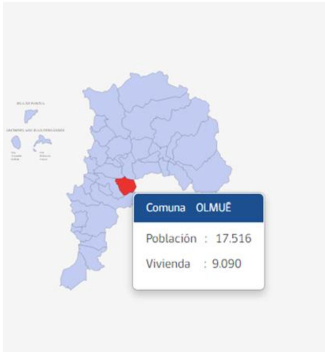
Ilustración 1: Mapa ubicación Olmué