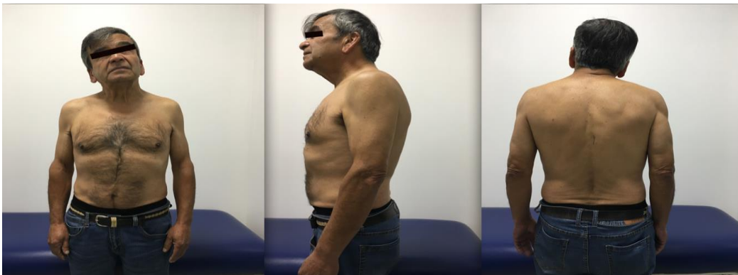
Figura 2: En este paciente se aprecia una inclinación acentuada del macizo cráneo facial en relación a la columna cervical hacia el lado derecho, con un leve descenso del hombro derecho.

En este tipo de pacientes se observa, en una vista frontal, una inclinación lateral del cráneo, con un descenso del hombro homologo, respecto de lo cual muchos refieren no haberse percatado, ni presentar dolores musculares y molestias.