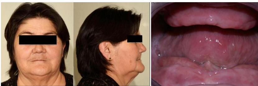
Figura 1: Paciente sexo femenino, adulto mayor, desdentada que presenta disfunción severa del SE por inestabilidad oclusal en céntrica consecutivo a la pérdida de todos

Los pacientes desdentados totales, con alteración postural cervical generalmente son adultos mayores que presentan disfunción severa del SE por inestabilidad oclusal en céntrica consecutivo a la pérdida de todos sus dientes, provocando una disminución de la dimensión vertical, lo cual se refleja a nivel funcional con un gran déficit de la eficiencia masticatoria, además de alteraciones estéticas, fonéticas y psicológicas. (11)