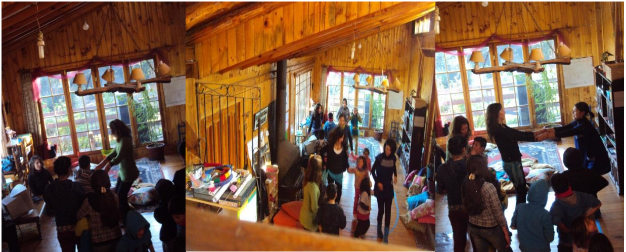
Fig. 3: Pilar 2 “Herramientas bio-inteligentes”; Biodanza

La biodanza, según Rolando Toro (2007, p 39) se define como un “sistema de integración humana, renovación orgánica, reeducación afectiva y re aprendizaje de las funciones originarias de vida. Su metodología consiste en inducir vivencias integradoras por medio de la música, del canto, del movimiento y de situaciones de encuentro en grupo”.