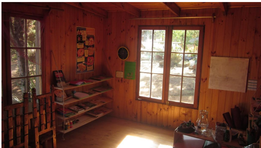
Imagen del espacio físico taller (nivel educativo) Tao”

Son nueve los párvulos pertenecientes al taller (nivel educativo) Tao.