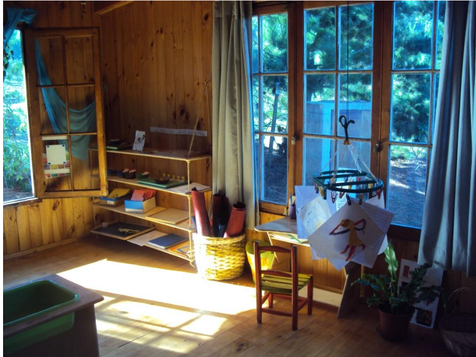
Imagen del espacio físico del taller (nivel educativo) “Mandala”

También hay un estante grande del cual se desprende un soporte para dos lavatorios que sirven para el lavado de los materiales usados. En este estante también se encuentran materiales de cocina tales como, cuchillos, ralladores, tenedores, cucharas, tasas y platos