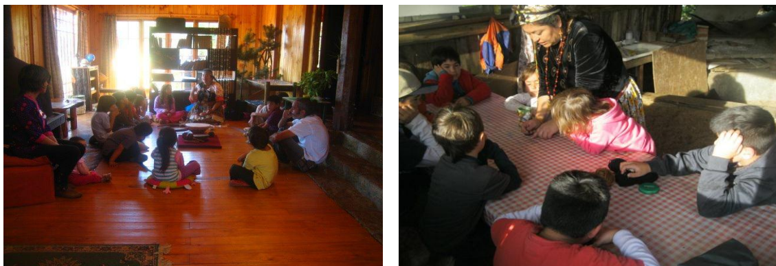
Fig. 6: Pilar 7 “Experiencias educativas de los pueblos ancestrales y originarios”

Avelino Siñama y Elizardo Pérez, nombrados en el marco referencial, crearon entre los años 1931 y 1940 una experiencia educativa dentro de la escuela Ayllu ubicada en Warisata, Bolivia.