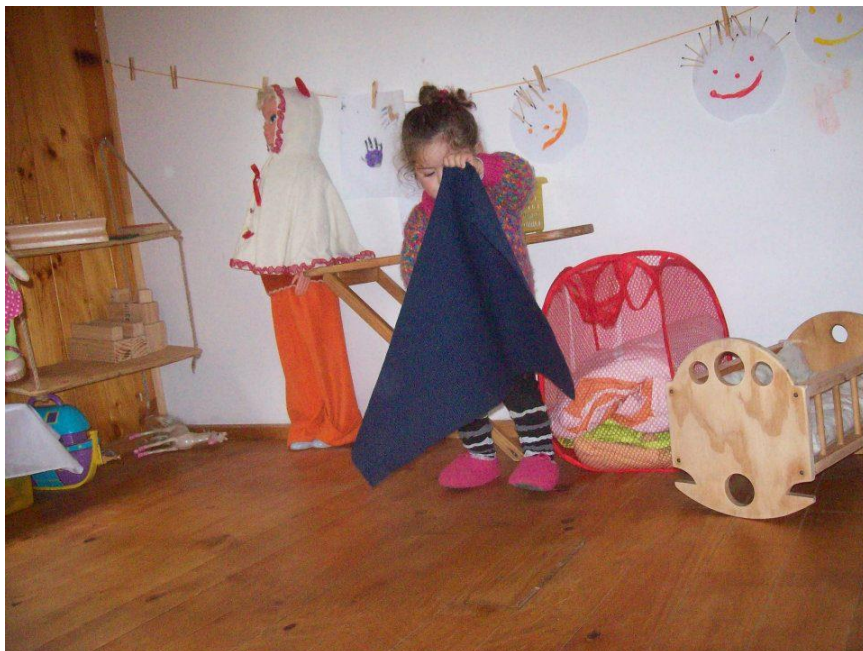
Imagen del espacio físico del taller (nivel educativo) “Naitun”