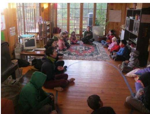
Fig. 1: Pilar 2 “Herramientas bio-inteligentes”; Yoga.

El primero que presentaremos es el pilar dos, el cual comprende las herramientas bio-inteligentes, bio-mórficas y bio-reconectoras. En este caso fotografiamos herramientas bio-inteligentes como: yoga, enraizamiento y arraigo con la naturaleza, biodanza y bio-huerto.