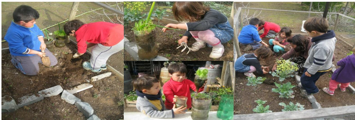
Fig. 4: Pilar 2. Herramientas bio-inteligentes, Bio-Huerto

El bio-huerto es terapéutico, enseña una vida sana, desarrolla la vida social de niños y niñas (a cultivar juntos) y a fortalecer el contacto con la tierra. En las fotografías se observa cómo ellos y ellas están en contacto con la naturaleza trabajando en el bio-huerto.