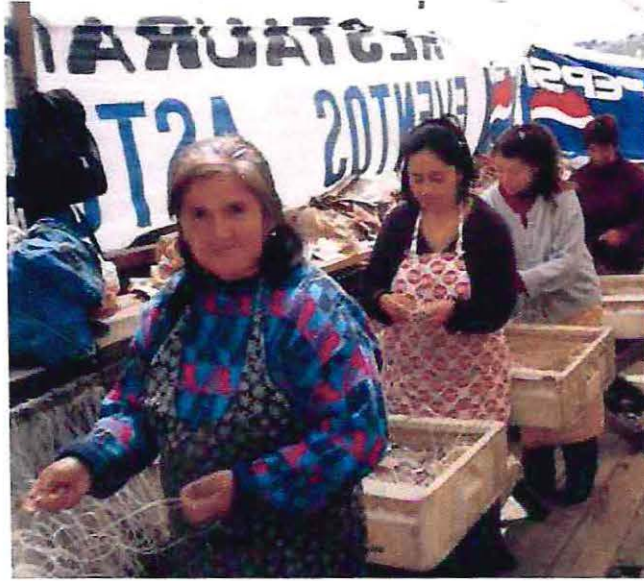
Foto N° 3: La imagen muestra a un grupo de mujeres encarnadoras realizando la actividad en la Caleta.

Con respecto a aquellas mujeres que se denominan transformadoras su actividad consiste en filetear, limpiar, descolar, procesar y/o conservar los recursos marinos. Sus características laborales, personales y sociales se asimilan a las encarnadoras de caleta, lo que se explica en que comparten el mismo espacio laboral.