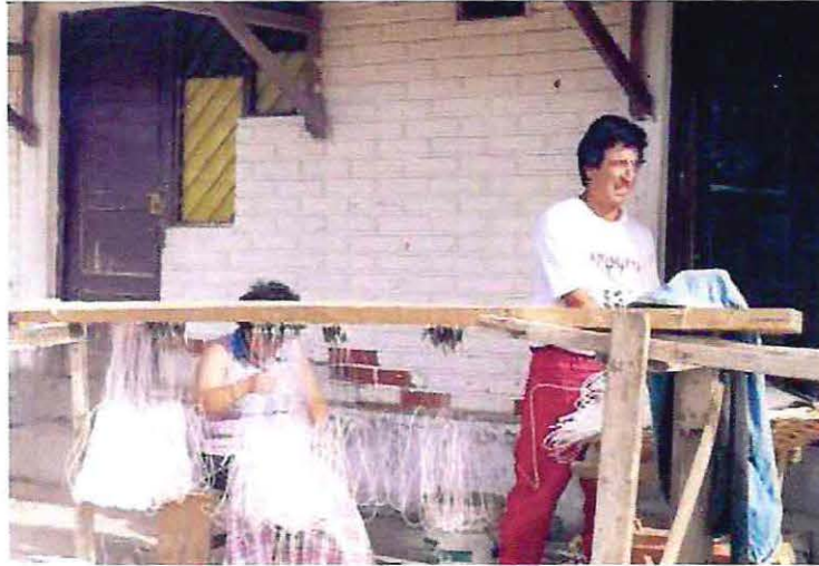
Foto N° 2: La imagen muestra a una familia realizando la actividad de encarnado en su casa.

Como se ha mencionado con antelación el lugar de trabajo produce en las mujeres de la pesca artesanal diferentes características laborales, personales y sociales. Es así como las mujeres que trabajan en sus casas ejecutan la labor en talleres donde los grupos naturales cobran relevancia. La actividad adquiere características familiares siendo desarrollada por los integrantes del grupo familiar en una de sus casas. También puede realizarse de modo individual donde no se hace presente la interacción familiar, pero se observa a veces la presencia de amigos o vecinos. Las condiciones físicas son por lo general insuficientes, de autoconstrucción donde no está garantizado un adecuado higiene.