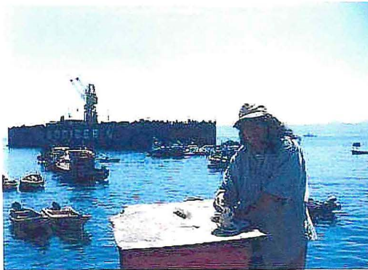
Foto N° 4: la imagen presenta a una mujer desarrollando la actividad de transformadora, comúnmente denominada "filetear" en la Caleta Sudamericana, Valparaíso.

Con respecto a aquellas mujeres que se denominan transformadoras su actividad consiste en filetear, limpiar, descolar, procesar y/o conservar los recursos marinos. Sus características laborales, personales y sociales se asimilan a las encarnadoras de caleta, lo que se explica en que comparten el mismo espacio laboral.