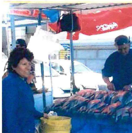
Foto N° 6: La imagen muestra a una mujer desarrollando la actividad de comercializadora, específicamente venta de pescado en el Mercado Puerto.