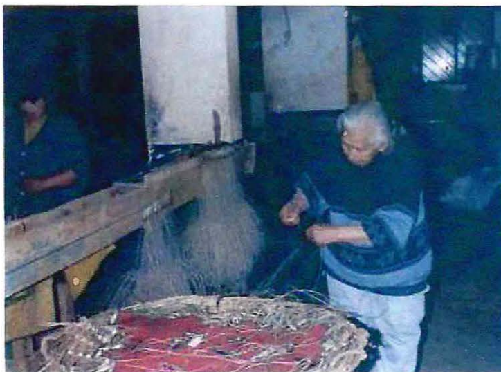
Foto N° 1: La imagen muestra a una mujer realizando la actividad de encarnado dentro de la Caleta El Membrillo de Valparaíso.

La actividad que concentra el mayor número de mujeres es la de encarnado, que consiste en colocar la carnada en los espineles que luego serán utilizados por los pescadores artesanales. Para ello las encarnadoras deben limpiar, desenredar, encarnar y cambiar anzuelos; esta labor es desarrollada por las mujeres en sus casas o en la Caleta. Aquellas que trabajan en sus casas no establecen un contacto directo con los pescadores artesanales, sino más bien con un intermediario o acarreador que es quien reparte los espineles y paga la remuneración a las mujeres. En cambio quienes trabajan en la caleta mantienen una interacción constante con los pescadores, debido a que se insertan en el mismo espacio laboral.