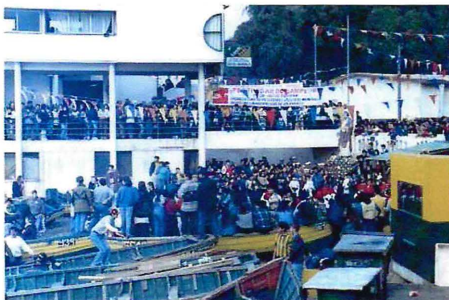
Foto N° 8: La imagen muestra la celebración de la festividad de San Pedro en la Caleta el Membrillo, Valparaíso.