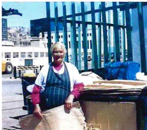
Foto N° 5: la imagen presenta a una mujer que ejerce la actividad de proveedora de servicios, específicamente vendedora de papeles en la Caleta Sudamericana, Valparaíso.

En cuanto a las comercializadoras o proveedoras de servicios realizan su actividad de modo independiente y su lugar de trabajo por lo general también es la caleta, de modo que su perfil conductual concuerda con otras mujeres que también se desempeñan en este lugar.