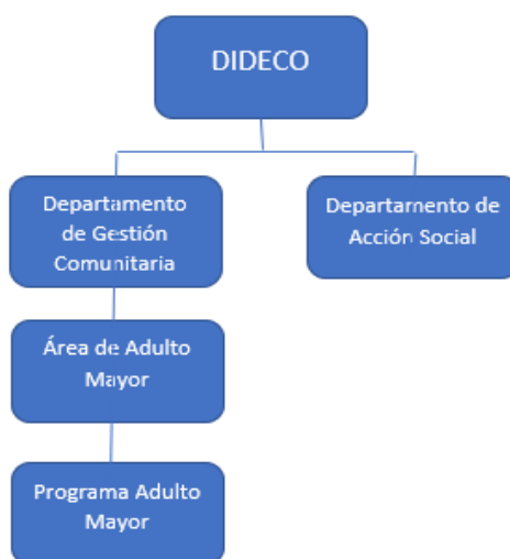
Gráfica N°2: Organigrama de Área de Adulto Mayor, Municipalidad de Cerrillos.