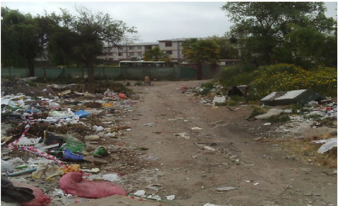
Basural y cercanía a zona residencial