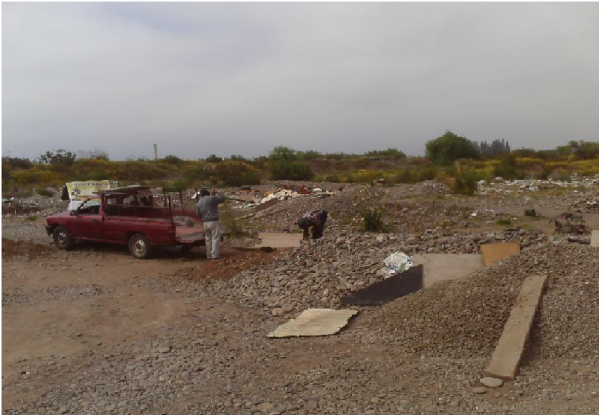
comprador y extractor de áridos