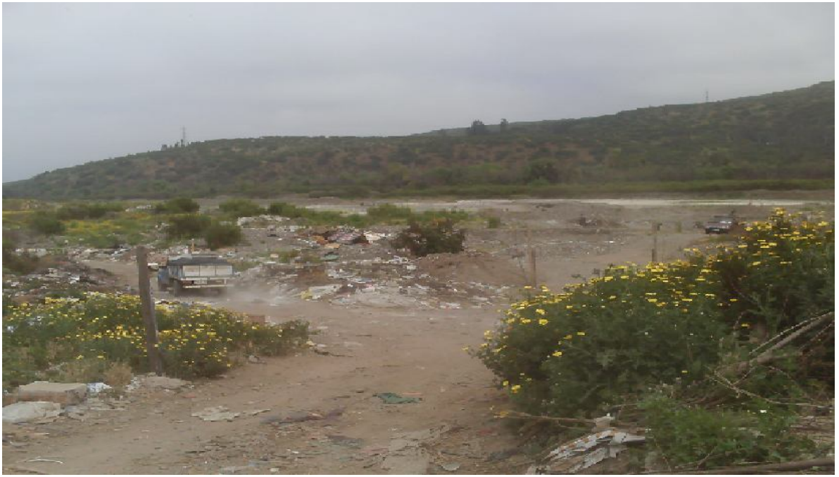
Entrada a la zona de extractores de áridos