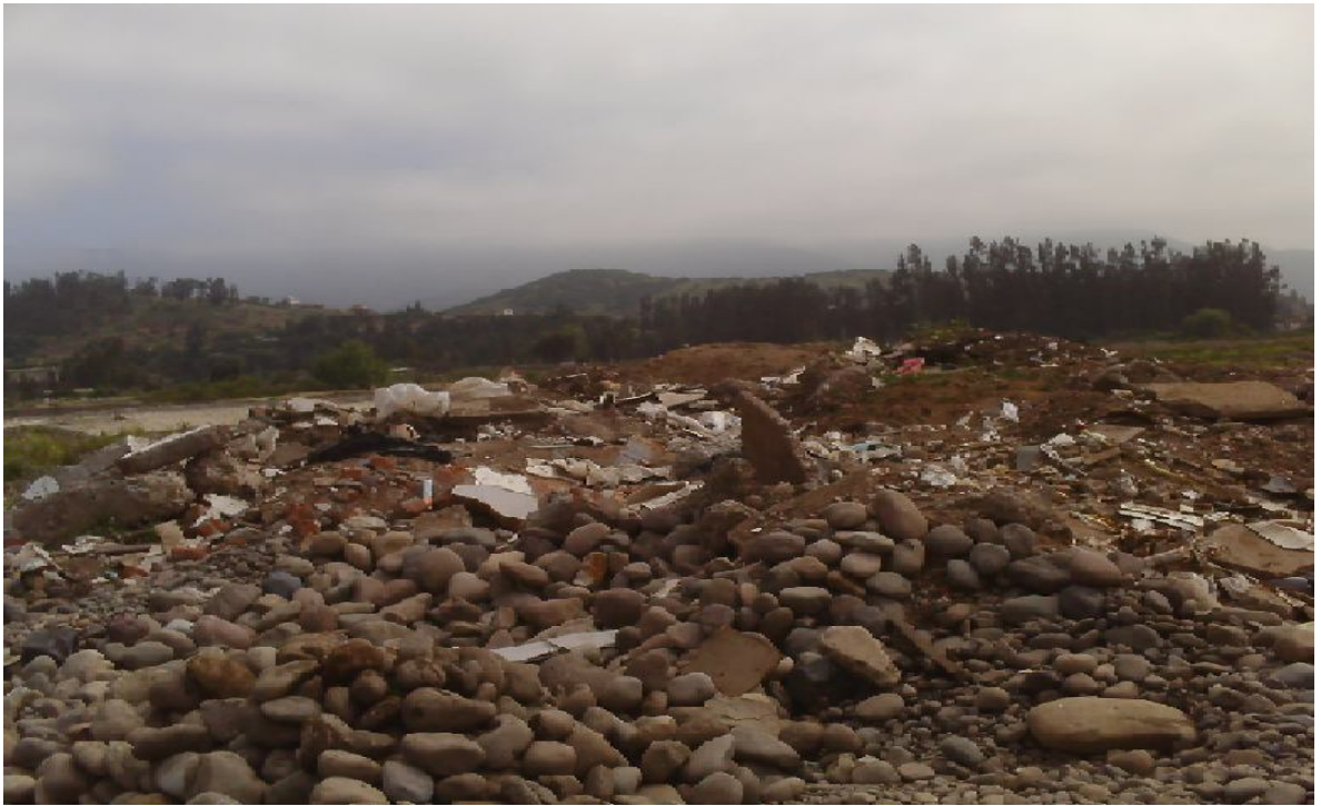
Problemática ambiental en zona de trabajo