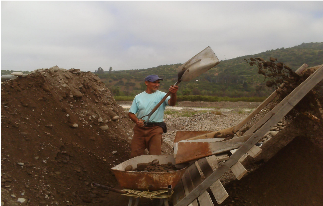
Arenero en faena de areneado