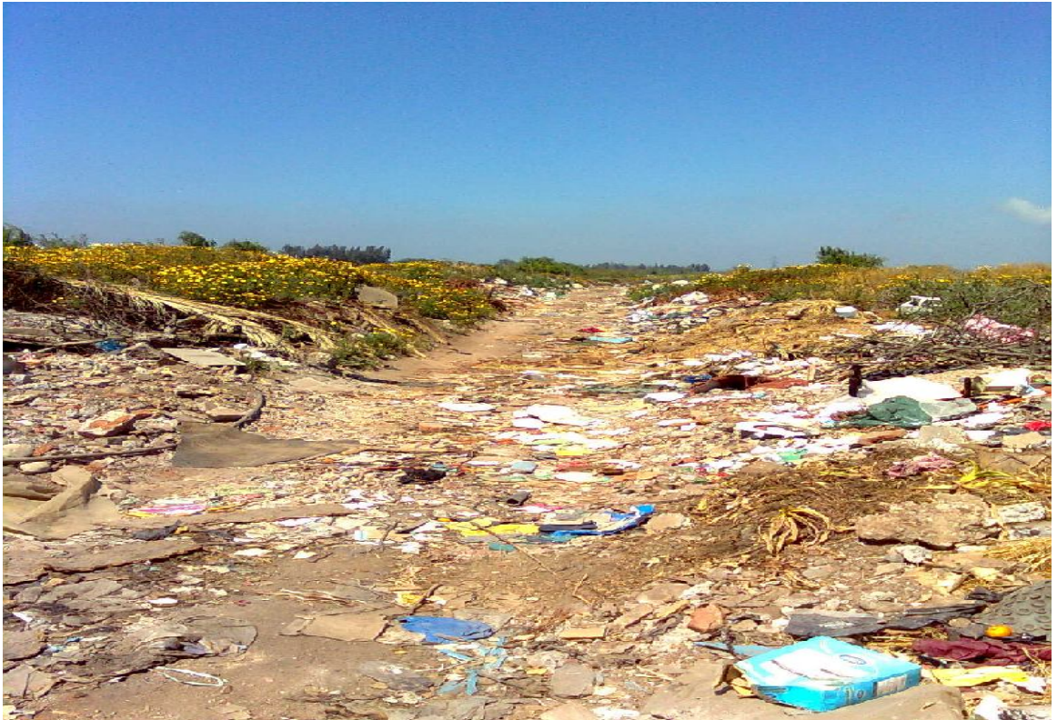
Dispersión de basura en el territorio