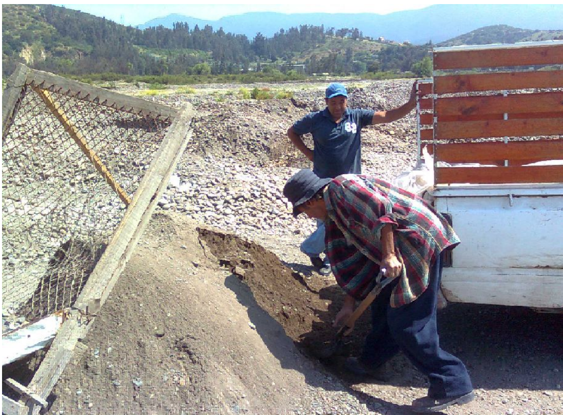
Extractor de áridos cargando material