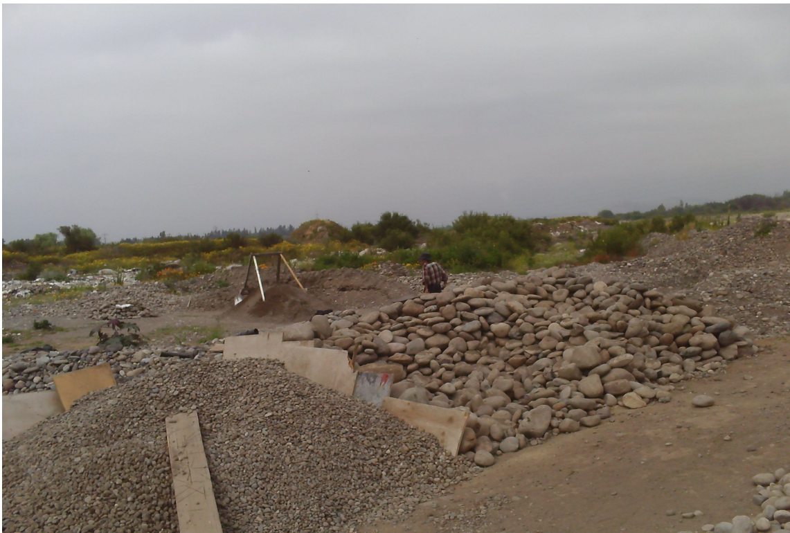
Segmentación de material