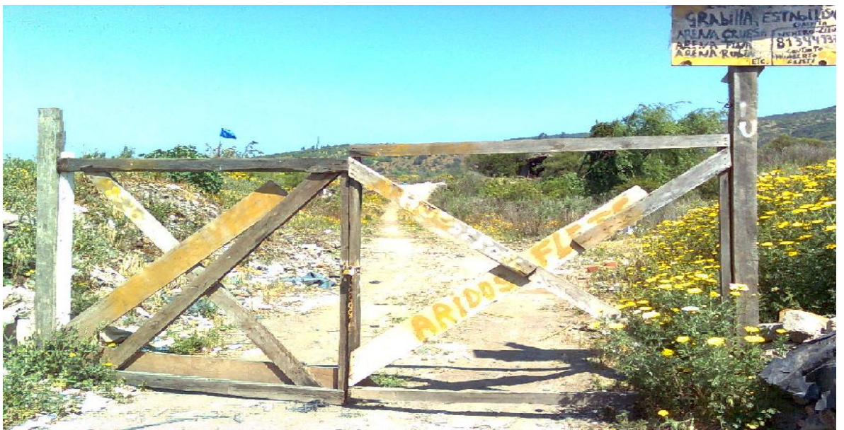
Al fondo bandera señala el espacio de los areneros