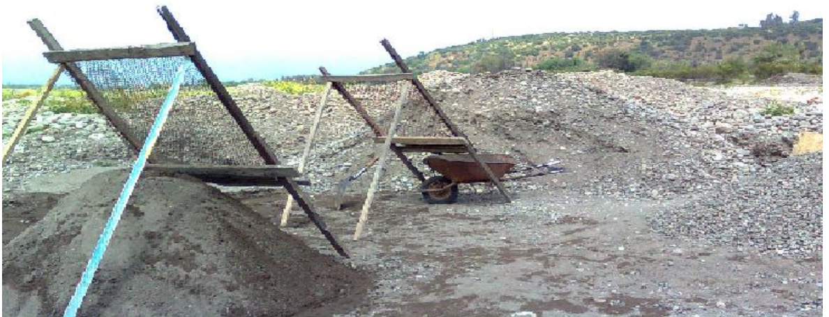
calichera de extracción de áridos