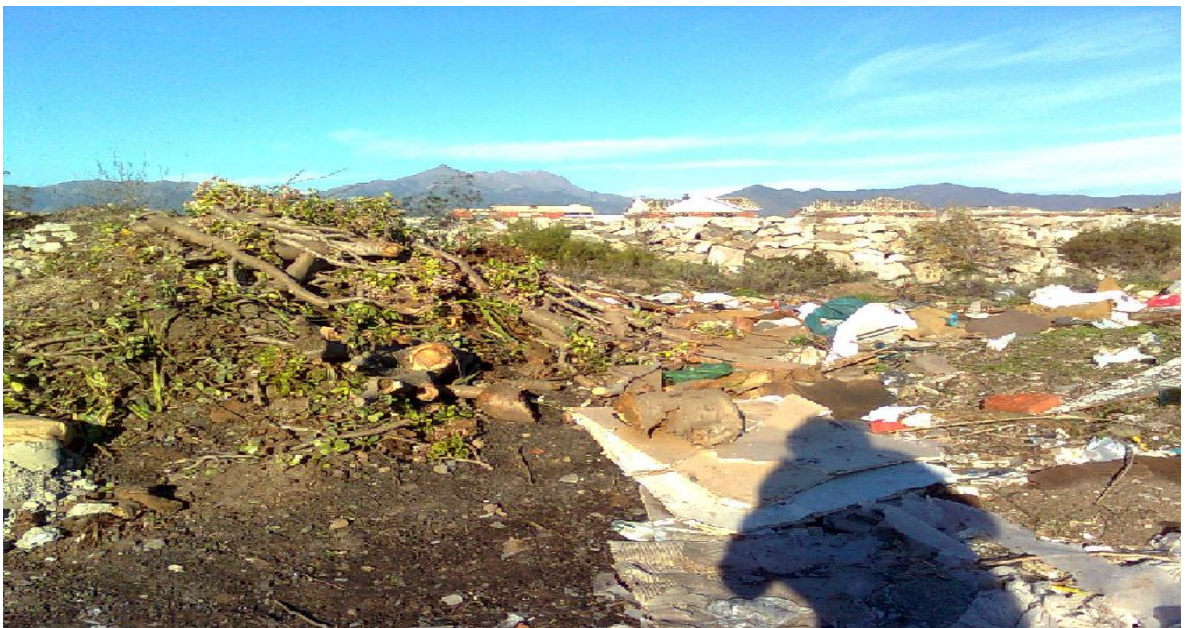
Contaminación y cercanía de hogares