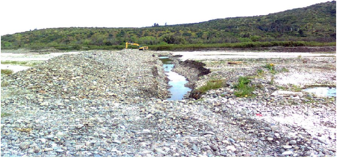
Corte del lecho como forma de extracción por parte de la empresa de áridos