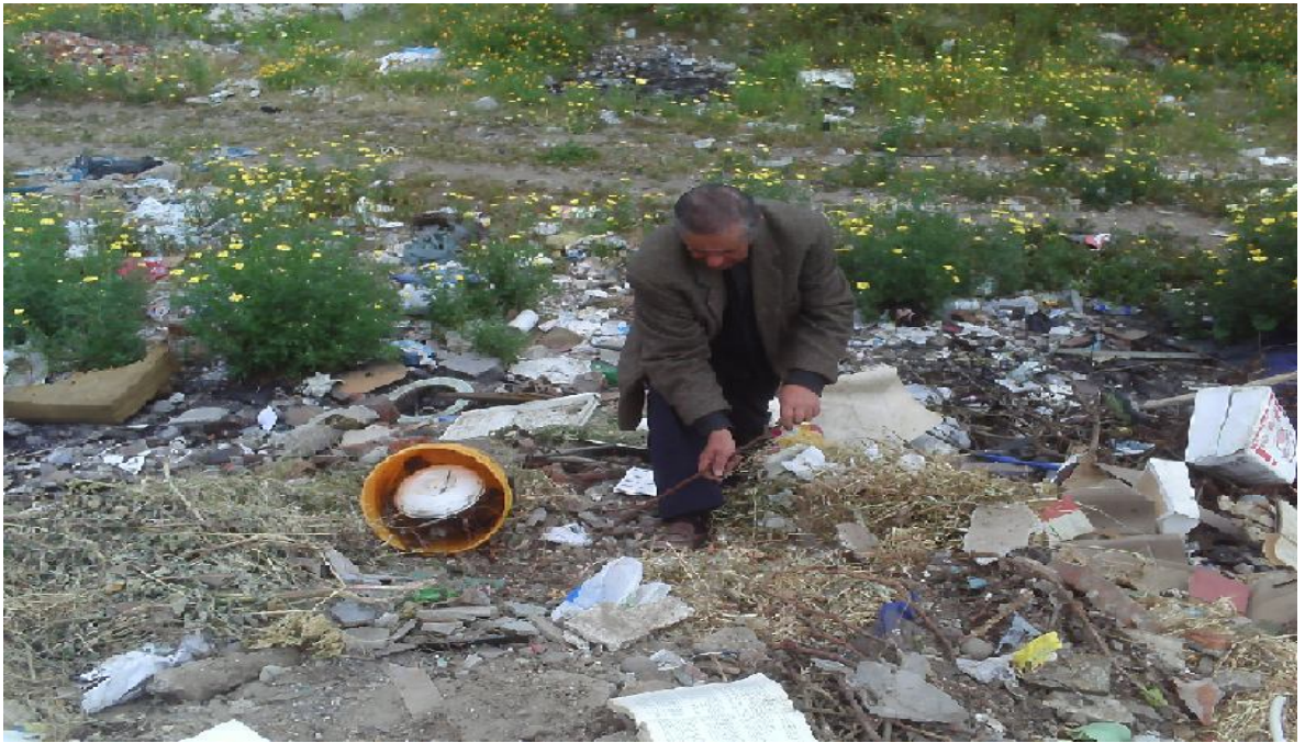
Reciclador en trabajo de búsqueda de material