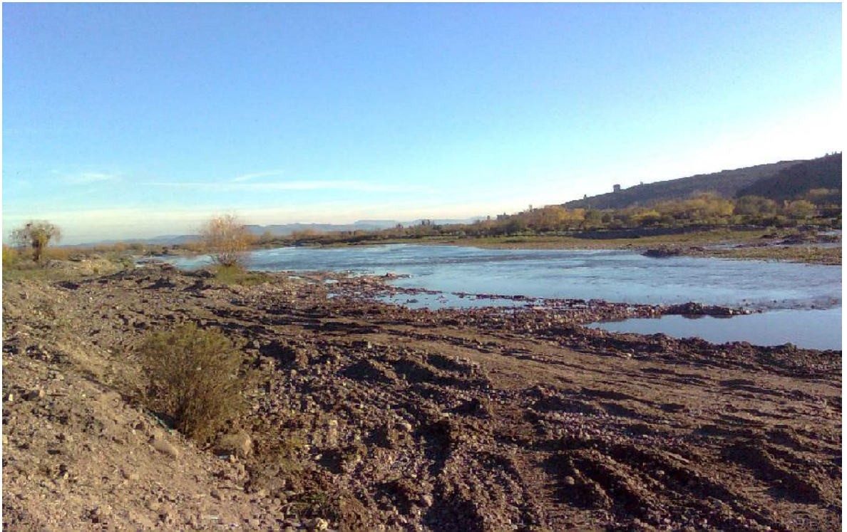
Zona de extracción empresa de áridos