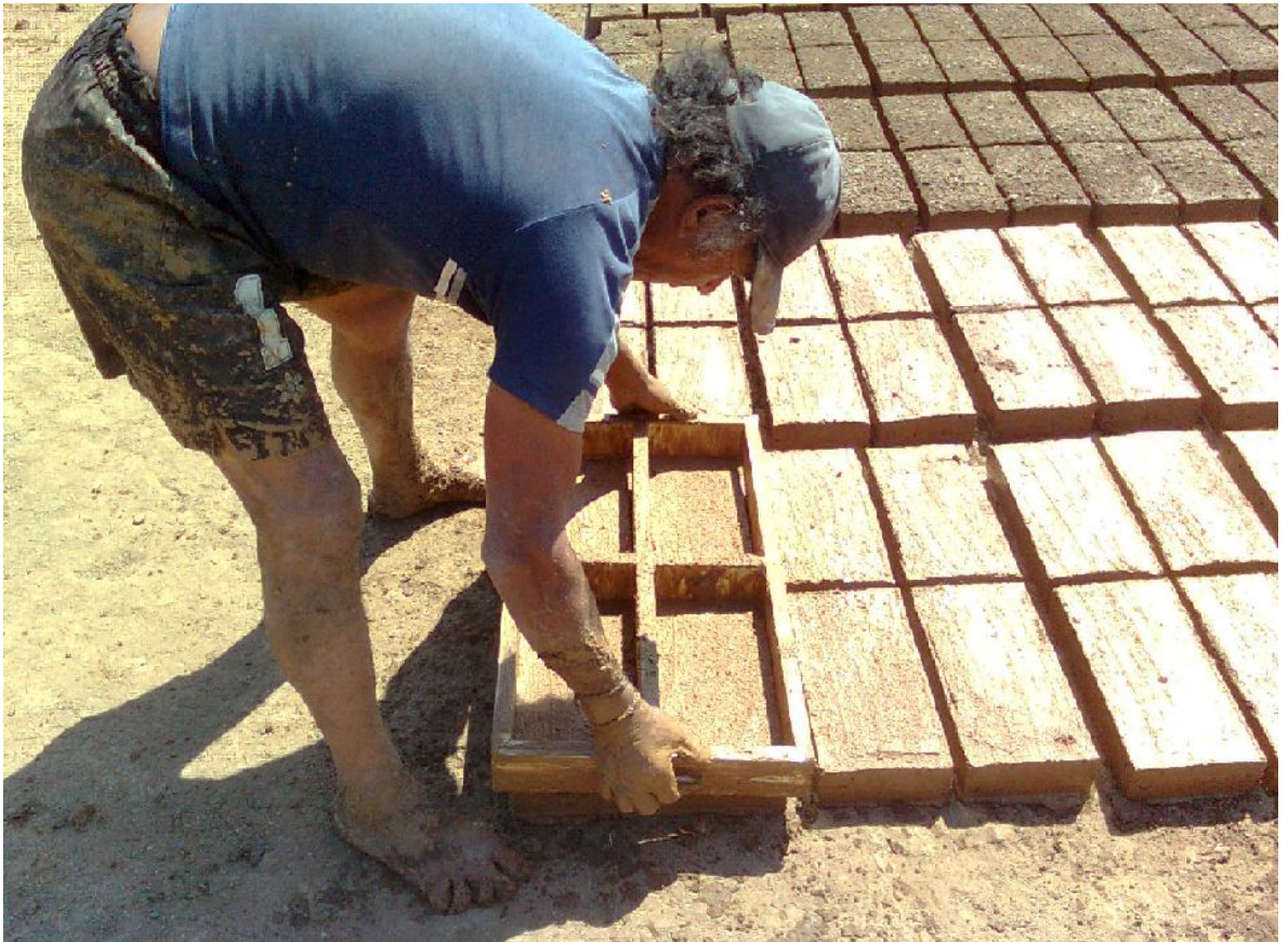
Otras actividades en el territorio: Los Ladrilleros