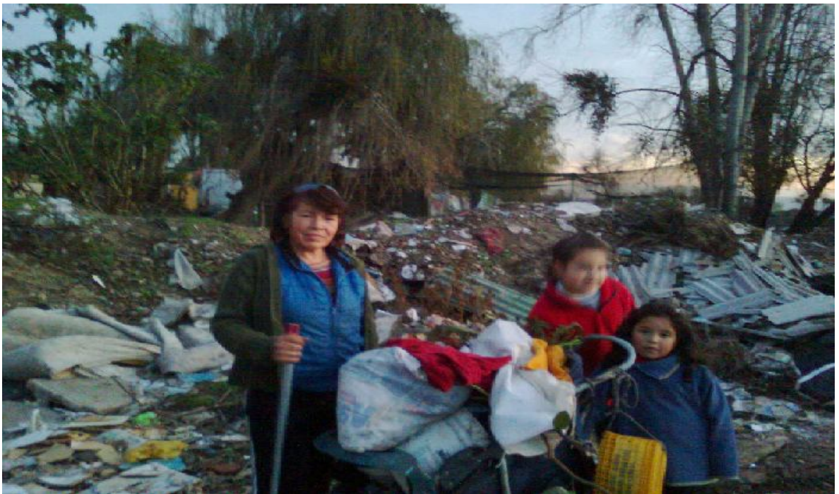
Recolectora de ropa