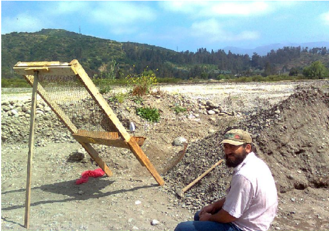
Extractor en tiempo de descanso