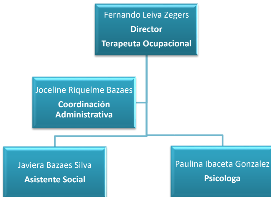
Ilustración 1: Organigrama CCSSR, Fuente: Elaboración propia.