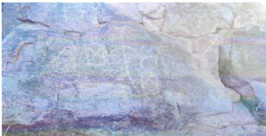
Petroglifos Incas En la piedra Intihuatana Cerro Mercachas.