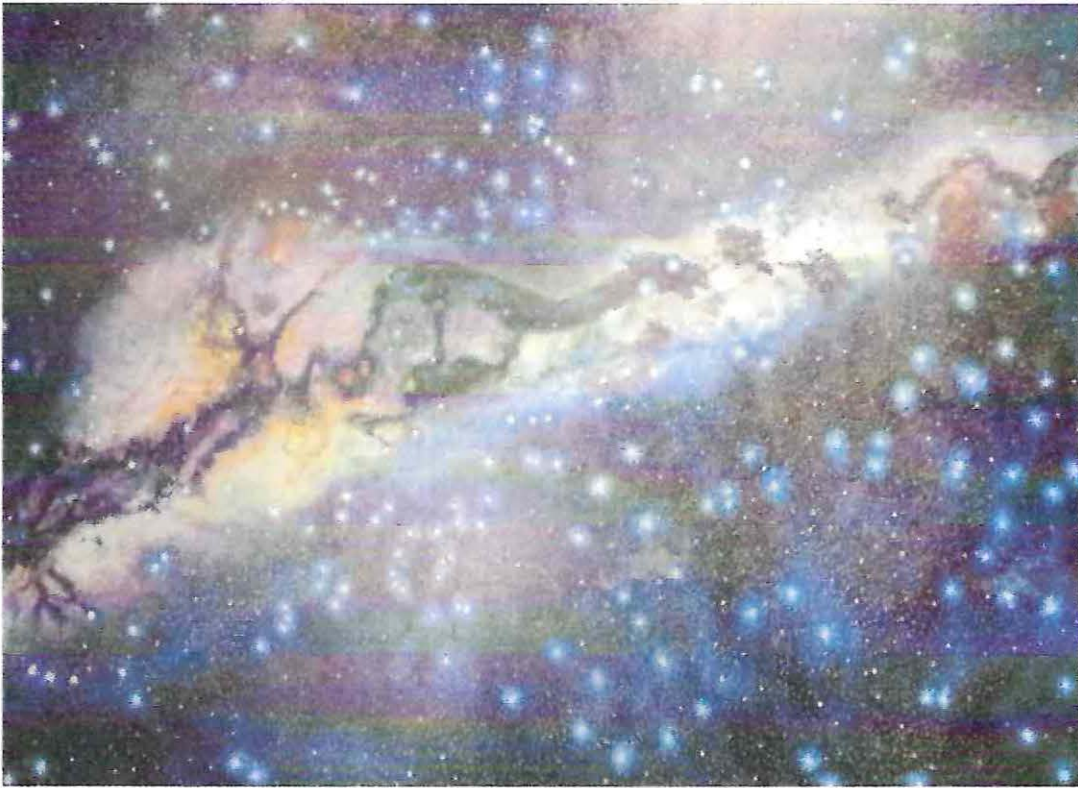
Vía Láctea Constelaciones Incas.