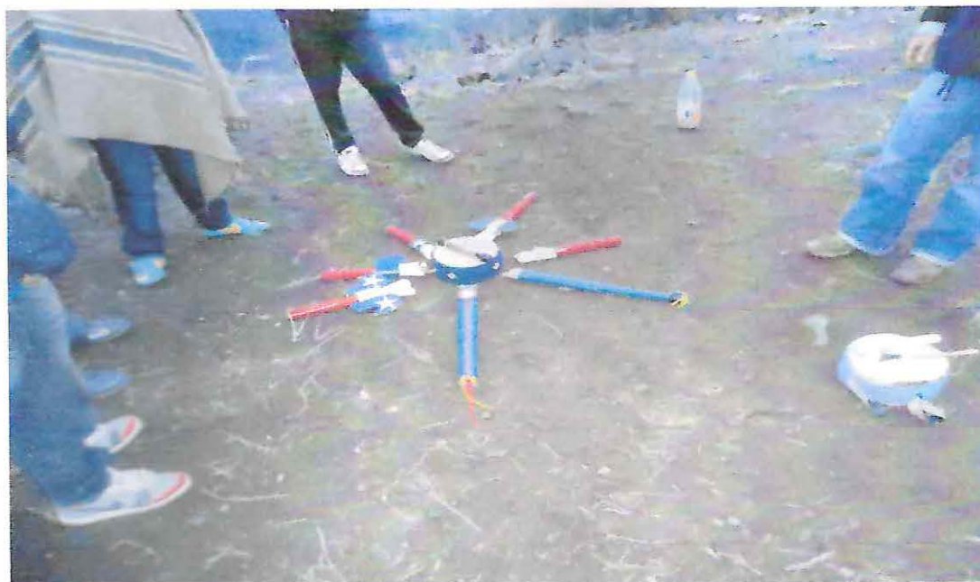
Flautones del Baile Chino Adoratorio Cerro Mercachas.