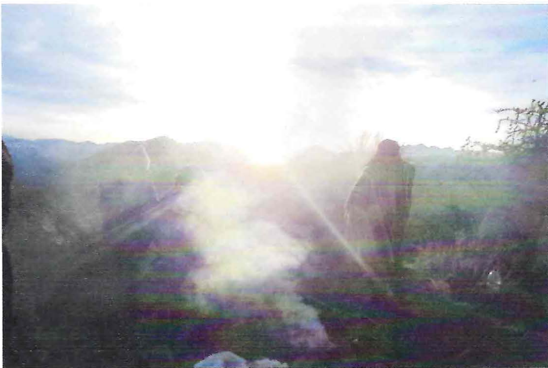
Bienvenida y ceremonia al nuevo sol (Anti).