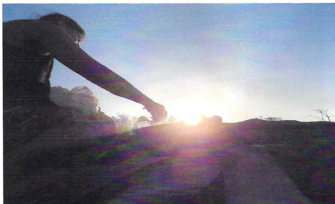
Ceremonia en la piedra intihuatana, despedida del sol.