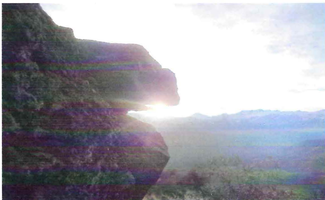
Piedra intihuatana amarre del nuevo sol. (Anti)