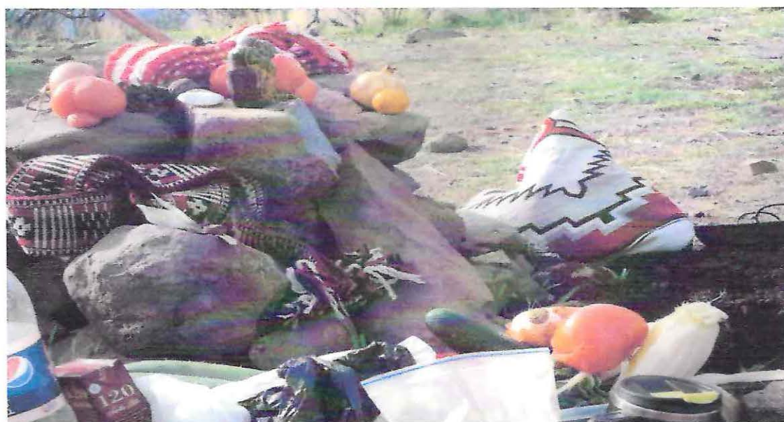
Ceremonia de cierre y entierro de las ofrendas.