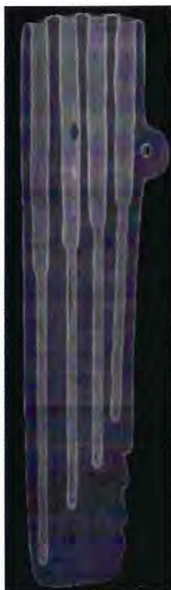
Flauta Antara Aconcagua

El material que ellos utilizaban no era el más apropiado, debido a la dureza de la piedra, sin embargo, la extraordinaria excelencia artesanal lograda en la confección de las flautas demostraban el alto nivel cultural de este pueblo y a pesar de todas las dificultades, eran capaces de lograr excelentes resultados acústicos muy complejos, muy desarrollados y extraordinariamente precisos como es el caso del llamado “sonido catarra”(frullato). “La piedra era un material luminoso, que emanaba de los cerros, dotada de la vida (a diferencia de nosotros, que la creemos muerta) y poseedora de poderes, sobre todo las piedras elegidas cuidadosamente, como esa.” (11).