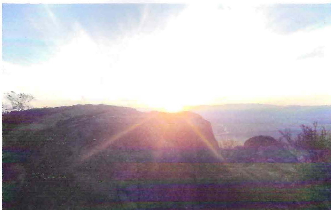
Piedra intihuatana, amarre del sol viejo (Inti).