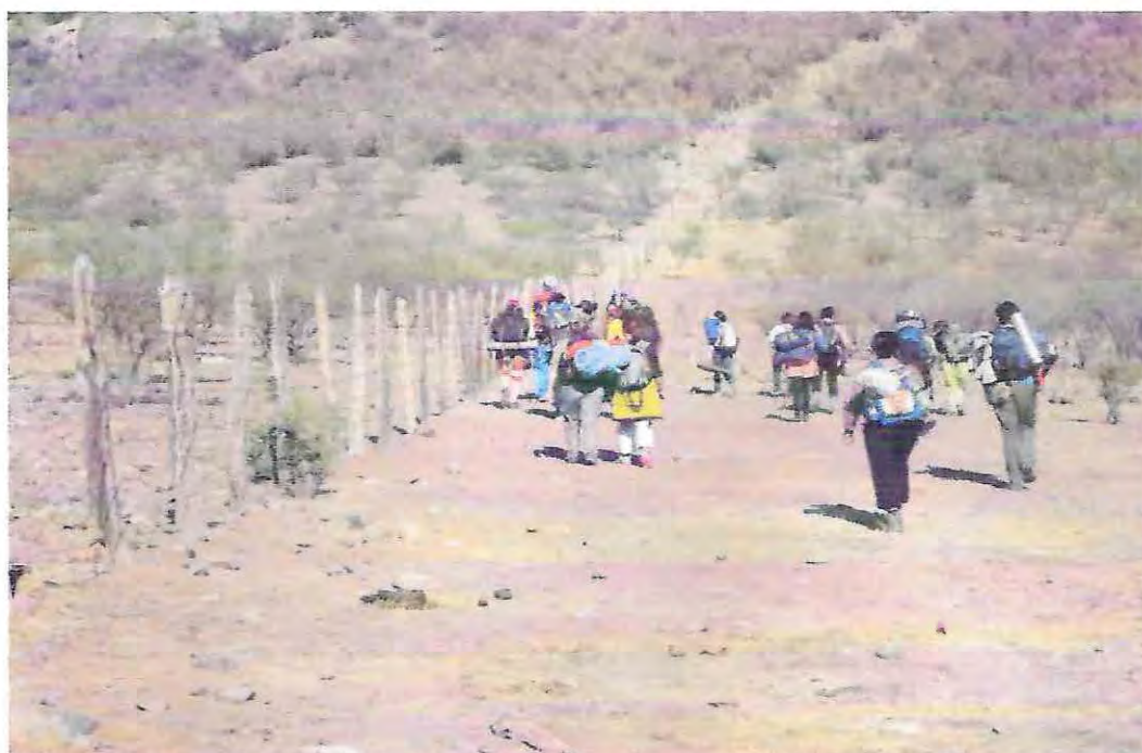
Ascenso al Cerro Mercachas