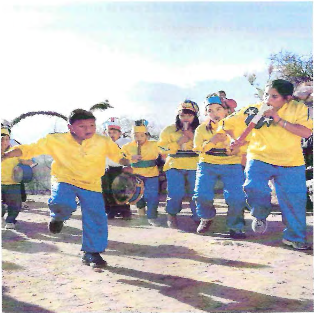
Baile Chino Adoratorio Cerro Mercachas