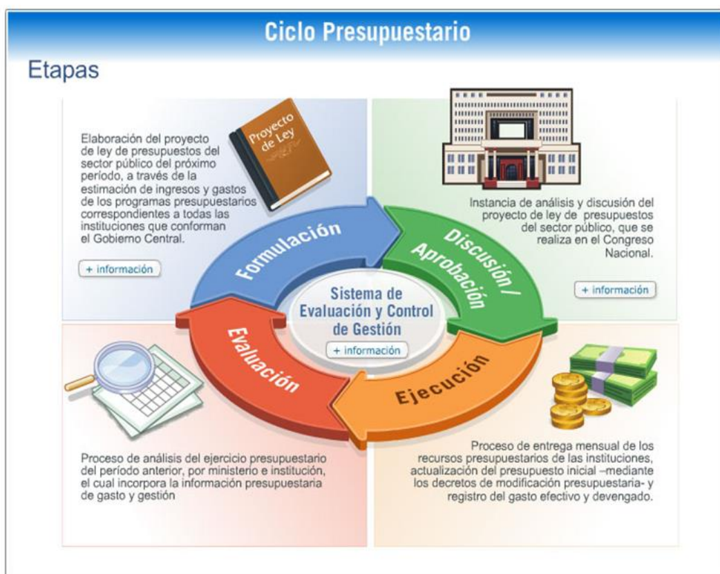
.Cuadro N°1: Etapas del Ciclo Presupuestario en el Sector Público