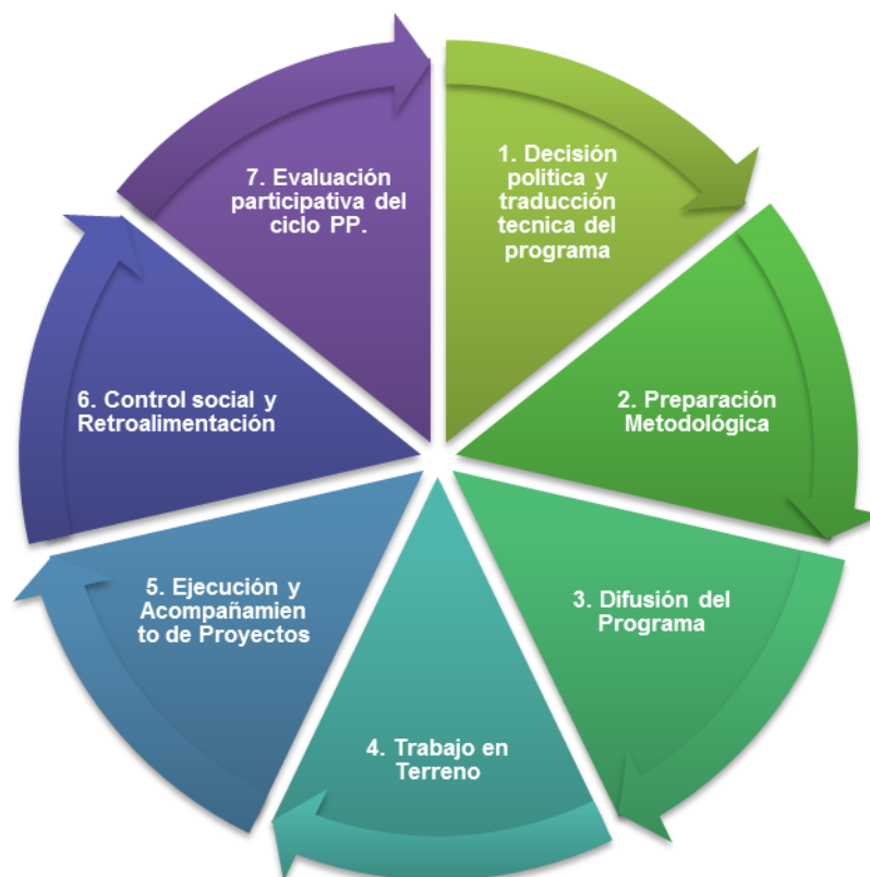
Cuadro N°5: Ciclo Básico del Presupuesto Participativo en Chile (elaboración propia. Fuente. Manual Operativo para la implementación de Presupuestos Participativos) 17

Si bien no existe un modelo único para la elaboración e implementación de los presupuestos participativos en Chile, si existe uno general y que promueve el foro chileno de presupuestos participativos. Este se divide en 7 etapas que no necesariamente tienen un desarrollo lineal. Algunas etapas pueden superponerse o se realizan de manera paralela.