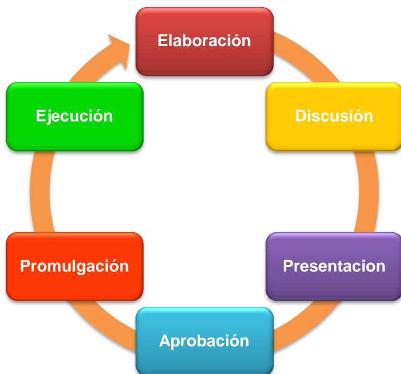
Cuadro N°2: Etapas de la elaboración del Presupuesto Municipal (elaboración propia)

Seis son las etapas para la elaboración del Presupuesto Municipal 6 , tal como lo muestra la figura que antecede. Se debe iniciar con una propuesta del Alcalde. En primer lugar está la Elaboración del presupuesto, en la cual participan todos los niveles de la administración. Luego viene la etapa de Discusión entre los concejales, para dar paso a la etapa de Presentación , en la cual el Alcalde presenta al concejo municipal el plan de presupuesto para luego seguir con la etapa de Aprobación , en la cual el concejo discute el plan comunal y el presupuesto, en este momento se pueden sugerir cambios o modificaciones. El concejo debe aprobar el presupuesto antes del 15 de Diciembre. A continuación viene la Promulgación del plan comunal y presupuesto a través de un Decreto Alcaldicio. Finalmente se pasa a la etapa de Ejecución en la cual el Alcalde debe velar por el cumplimiento del presupuesto. El cual puede ser modificado las veces que