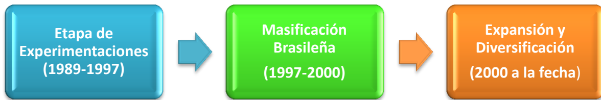
Cuadro N°3: Etapas de la Implementación de los Presupuestos Participativos en América Latina

En los últimos años también se han sumado ciudades europeas, que han adoptado los modelos existentes, con profundas adaptaciones. Entre estos países se encuentran España, Italia, Alemania y Francia. Incluso diversas ciudades de naciones de África (Por ejemplo Camerún) y Asia (Sri Lanka) están en proceso de implementar los presupuestos participativos en el corto plazo. 14