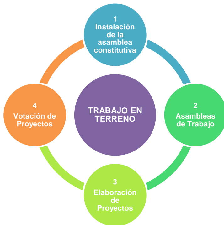
Cuadro N°6: Sub-Etapas del Trabajo en Terreno (elaboración propia)

El trabajo en terreno con la comunidad, posee cuatro sub-etapas fundamentales: 18