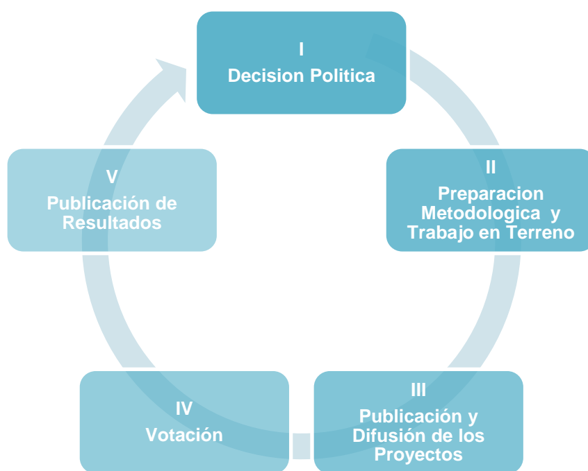
Cuadro N°9: Elaboración de los Presupuestos Participativos en la Comuna de Santiago (Fuente: Ordenanza N° 84, Municipalidad de Santiago)

Los presupuestos participativos en Santiago, se llevarán a cabo siguiendo los siguientes pasos y respetando las siguientes etapas.