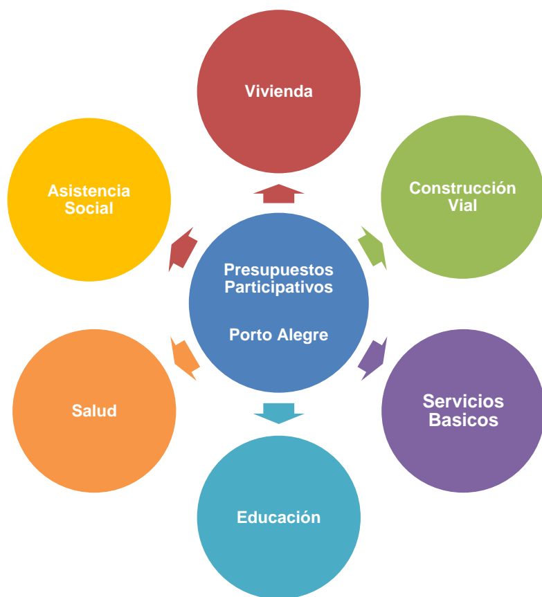
Cuadro N° 13: Presupuesto Participativos en Porto Alegre. Ámbitos de Intervención (elaboración propia)

Durante el periodo de 15 años desde implementación de los presupuestos participativos en Porto Alegre, los resultados logrados fueron notables, y demuestran la importancia de los presupuestos participativos en el desarrollo de una ciudad o comuna. Estos son algunos de los logros más concretos.