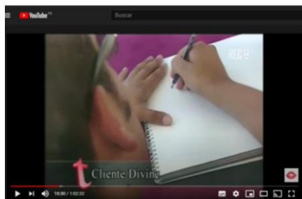
Imagen 5. Cliente “Anónimo” Divine

Ricardo, cliente habitual de Divine, relató que el día anterior al incendio pensaba no ir porque estaba en la universidad y aunque sus amigos insistieron, se le complicó 190 . Contó que en el taxi-colectivo que lo trasladaba a su casa le dijeron que la noche anterior hubo una pequeña discusión en la discoteca y que iban a quemarla. Sin embargo, el día 03 de septiembre fue con sus amigos al sitio. En el proceso del incendio dijo que no sentía sus pies, solo podría subir la cabeza para poder respirar, pensaba que todos se enterarían de su condición, su familia, amigos y que podía morir. Se sintió solo porque no podía llegar a su casa una vez que logró salir. Sus amigos no se podían enterar, por lo que pasó solo por el proceso traumático que le causó esta situación. Declaró que cuando salió buscó la manera de cubrirse el rostro, y pasó caminando entre la gestión de los bomberos para no llamar la atención, escondido de todos. Sin embargo, las personas le comenzaron a gritar palabras como “maricón, debiste haberte quemado” los taxis-colectivos no le paraban. Sin embargo, afortunadamente para él nadie supo lo que había sucedido 191 . En esta situación notamos los efectos de la normalización y la exclusión de lo extraño que se mueve en el ideario arraigado en la sociedad chilena de ese entonces. Las personas mismas se vuelven los replicadores de los dispositivos biopolíticos de normalización al rechazar lo que es considerado como “anormal”.