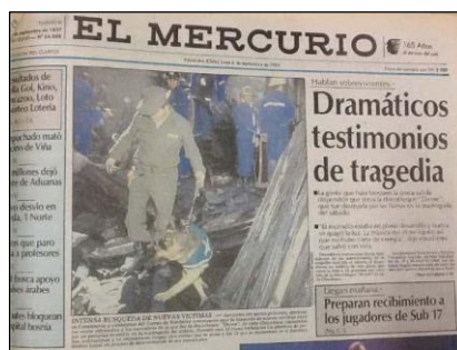
Foto 4. Portada de El Mercurio (6 de septiembre de 1993). Biblioteca Santiago Severín, Valparaíso.

A causa de la desesperación de las personas por salir y el avance acelerado del fuego, se aglomeraron en la puerta de escape, provocando muertes por asfixia en el mismo lugar, otros saltaron por las ventanas del segundo piso, o se refugiaron en zonas interiores del local, encontrándose más tarde sus cuerpos calcinados. Testigos que presenciaron desde afuera la tragedia comentaron haber conocido a muchos que en ese momento se encontraban desaparecidos, mencionaron con horror los gritos de desesperación de los atrapados dentro del local.