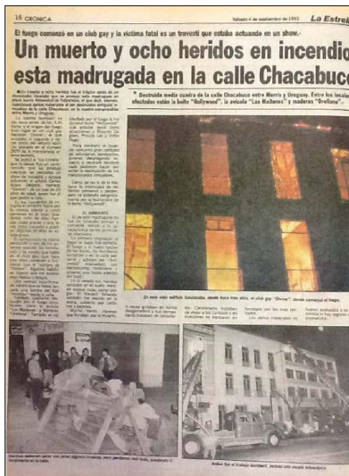
Foto 2. Artículo de La estrella de Valparaíso (4 de septiembre de 1993). Biblioteca Santiago Severín, Valparaíso.