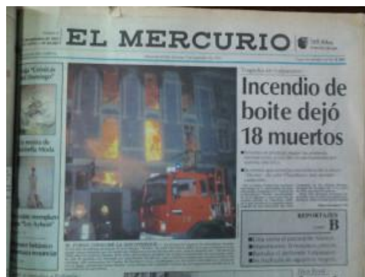
Foto 3. Portada de El Mercurio de Valparaíso (05 de septiembre de 1993)

La cuadra de Chacabuco fue aislada para que se pudiera seguir con las tareas de levantamiento de restos del inmueble y posiblemente, más cadáveres. Es preciso destacar que, en el titular no se mencionaba a la discoteca Divine como la tragedia principal acaecida, solo es parte del relato cuando explican las complicaciones presentadas para evacuar el lugar del sitio donde se concentraba la mayoría de las personas que tuvieron un final fatídico y fuertemente heridos.