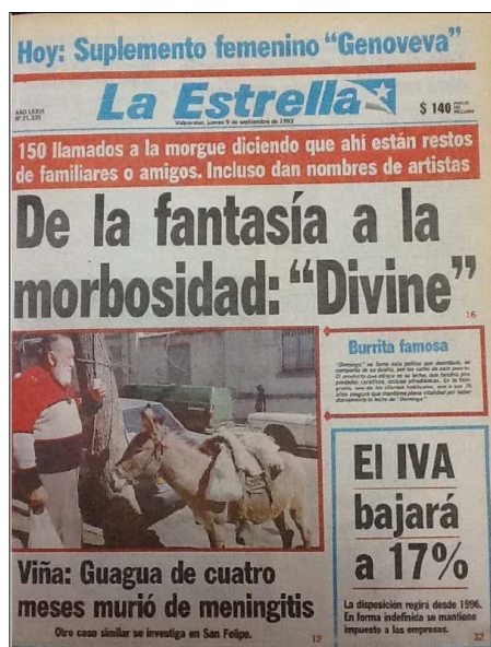
Foto 7. La Estrella de Valparaíso (9 de septiembre de 1993).

Por otro lado, también se mencionó la participación de terceros, en particular los propietarios del inmueble, la familia Lagomarsino, que habrían comprado el inmueble dos meses antes del incendio por alrededor de 30 millones y asegurado por más de 100 millones.