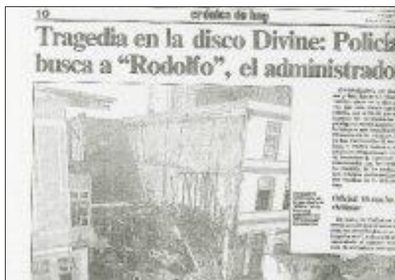
Foto 5. Portada de El Mercurio (6 de septiembre de 1993).

Según la experiencia relatada por un bailarín, cuando notó que la escalera estaba abarrotada de gente se dirigió a la ventana para lanzarse, como había visto a otros hacerlos, sin embargo, ante su duda volteo la mirada y vio como los bomberos rompían la puerta con ayuda de vecinos y algunos clientes, según lo relata, se tardaron aproximadamente 20 minutos para romper la puerta de escape, desde la mitad hacia arriba lograron abrirla y comenzaron a sacar a las personas que estaban encerradas 177 .