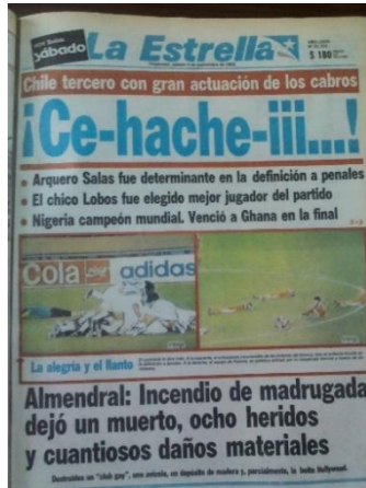
Foto 1. Portada de La estrella de Valparaíso (4 de septiembre de 1993).