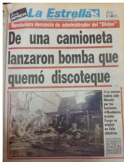
Foto 6. La Estrella de Valparaíso (8 de septiembre de 1993).

Por otro lado, también se mencionó la participación de terceros, en particular los propietarios del inmueble, la familia Lagomarsino, que habrían comprado el inmueble dos meses antes del incendio por alrededor de 30 millones y asegurado por más de 100 millones.