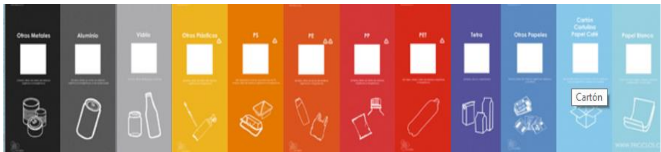
Figura N°2: obtenido de http://www.triciclos.cl |

A continuación se mostraran los materiales reciclados por TRICICLOS S.A. , el las góndolas de los puntos limpios.