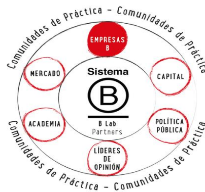
FIGURA N°1.1: Modelo de negocios de las Empresas B