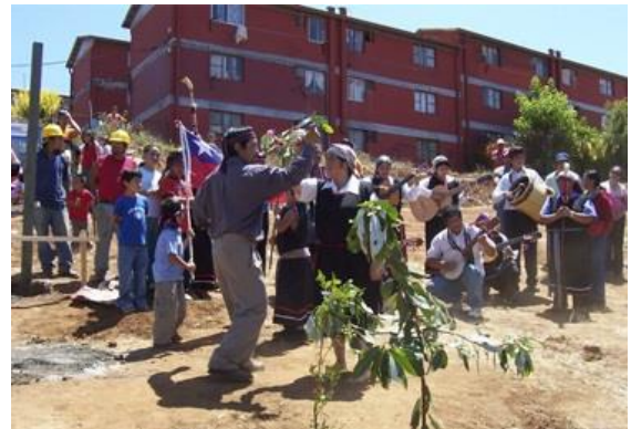
Entrega de viviendas “Newen ruka”

Al igual que con ciertas tradiciones como la lengua y los rituales , en alguna medida ha habido una pérdida del sentido de comunidad en su sentido ancestral, debido a que no hay una participación activa de parte de todos lo que componen la comunidad, habiendo dentro del conjunto quienes teniendo raíces mapuches no participan de misma: “Ha costado un poco vivir en comunidad porque bueno todos