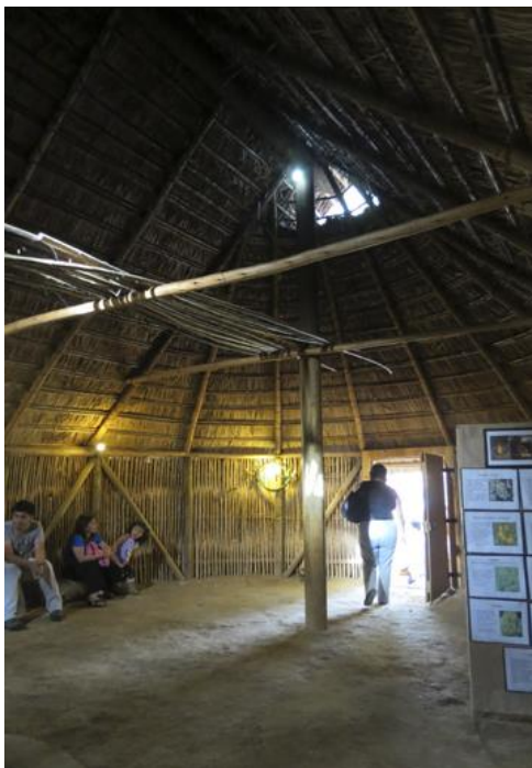
Ruka de comunidad “kuno Kaweskar”