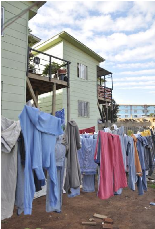
Balcon para ampliación en vivienda del Conjunto “Newen Ruka”