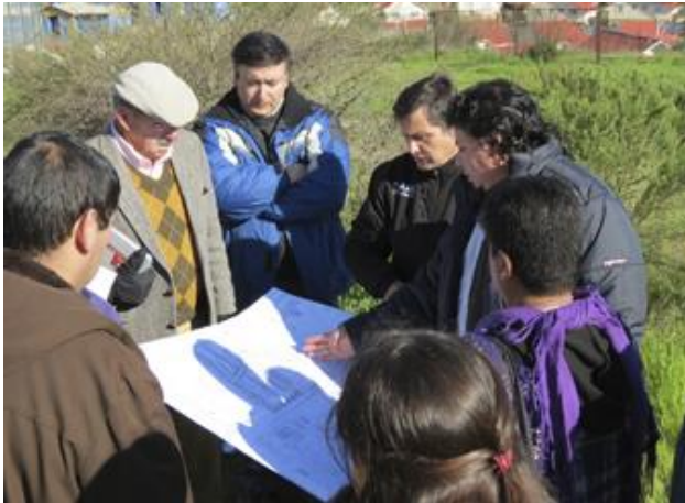
Dialogo entre comunidad y autoridades, proyecto “Kuno Kaweskar”

El segundo tema busca develar de qué manera este individuo indígena, proveniente del mundo rural género lazos dentro de la ciudad con otras personas de su misma cultura que estaban en semejante situación, conformando así una comunidad que ha logrado tener opinión respecto a los proyectos que los involucran. Como funciona ese sistema de comunidad y si está relacionado a la manera de vivir de sus ancestros