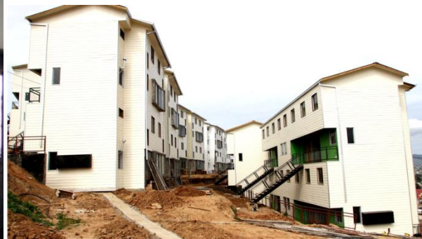
Proyecto “Kuno Kaweskar”

Cocina proyecto habitacional “Kuno Kaweskar”