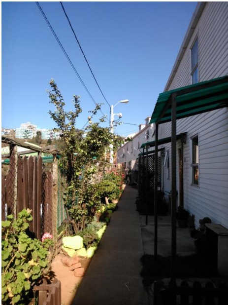
Vivienda y patio, conjunto “We folilche”