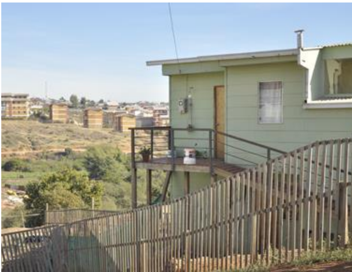
Vivienda del conjunto “Newen Ruka”, en la parte superior derecha se puede observar el tragaluz.