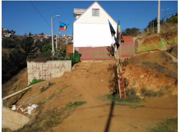
Espacio para los ritos en el conjunto “We folilche”