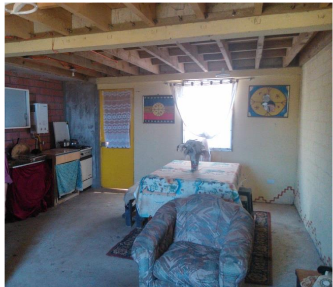
Cielo a terminar en vivienda del conjunto “We folilche”