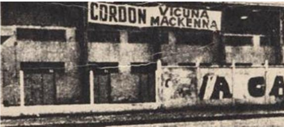
Punto Final, N° 188, Santiago, 17 de julio de 1973, pág.4.