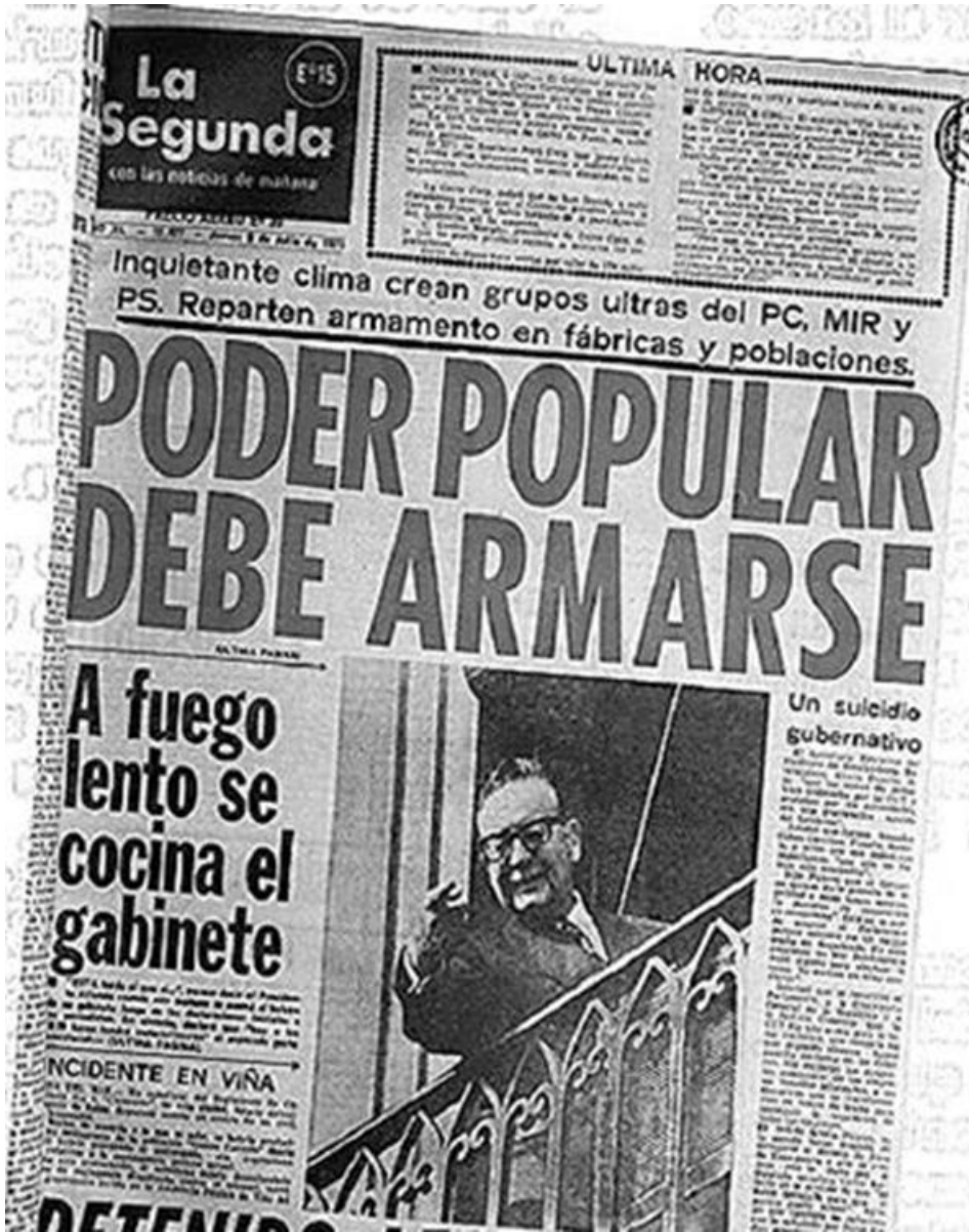
González Pino y Fontaine Talavera (1997), pág. 1453.