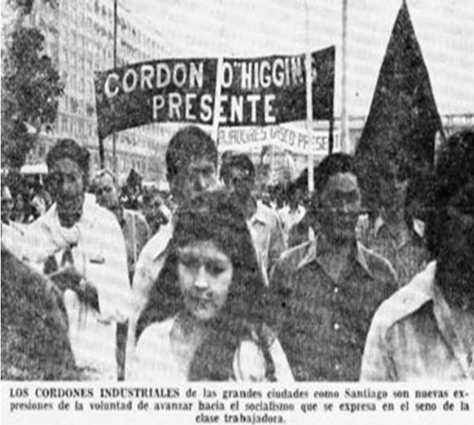
Punto Final, N° 183, Santiago, 3 de mayo de 1973, pág. 3.