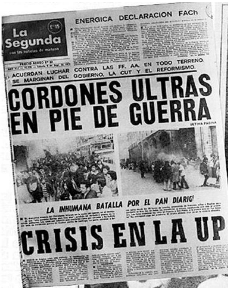
González Pino y Fontaine Talavera (eds.), Óp. cit., pág. 1506.