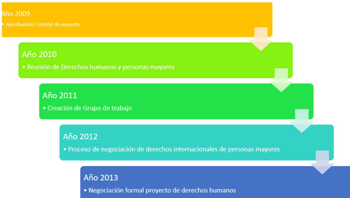
Figura N° 2 Creación Propia Fuente CEPAL

Junto con la proliferación de estudios en torno al fenómeno del Adulto Mayor durante la segunda mitad del siglo XX, las sociedades han empezado a generar derechos y deberes para las personas mayores del mundo, creando políticas públicas que busquen un reconocimiento al Adulto Mayor y busque protegerlo, asegurando su condición de sujeto de derechos.