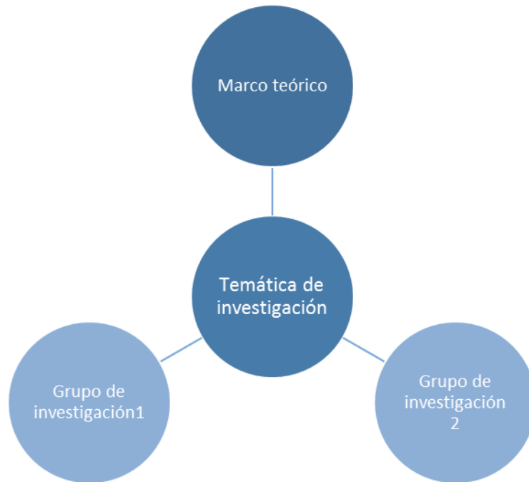
Figura N° 3 Elaboración propia.