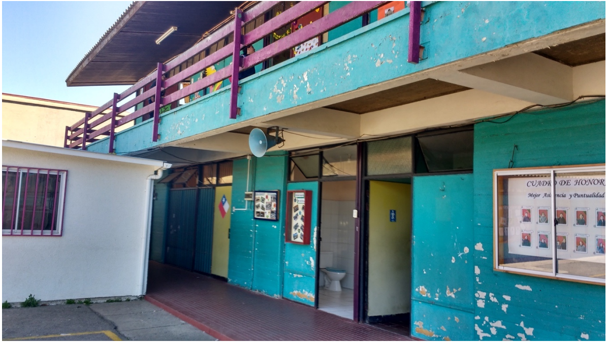
Imagen 9. Salas de clases escuela Hernán Olguín, Valparaíso, 2017.