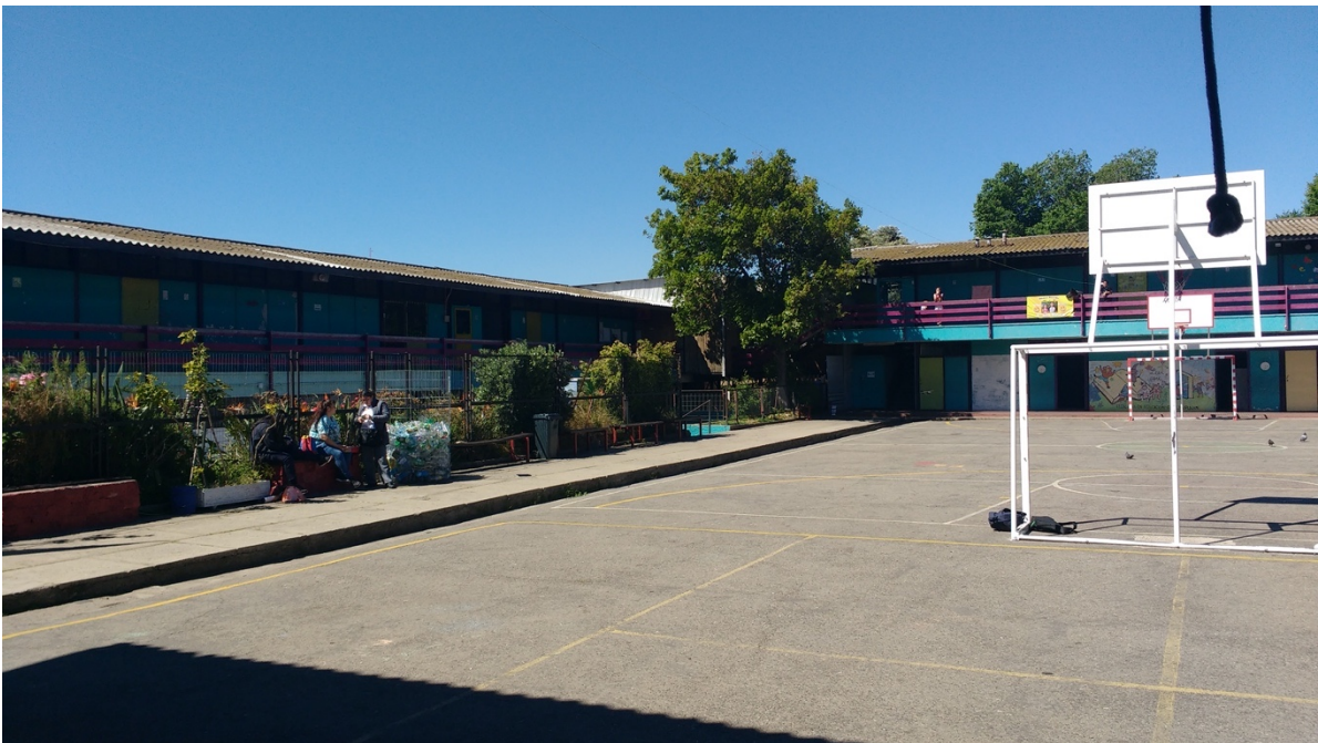
Imagen 8. Patio y jardín, Escuela Hernán Olgún, Valparaíso, 2017