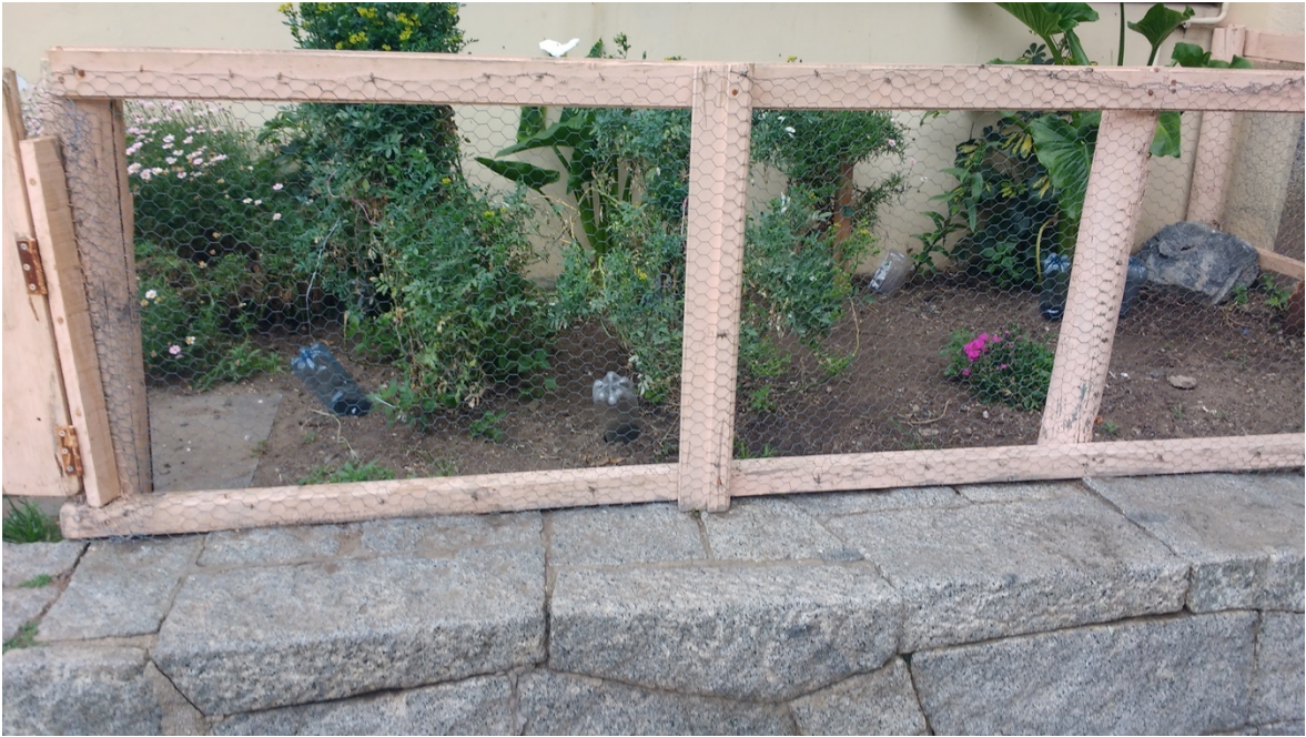
Imagen 5. Jardín creado por los estudiantes, Escuela Blas Cuevas Ramón Allende, Valparaíso, 2017.