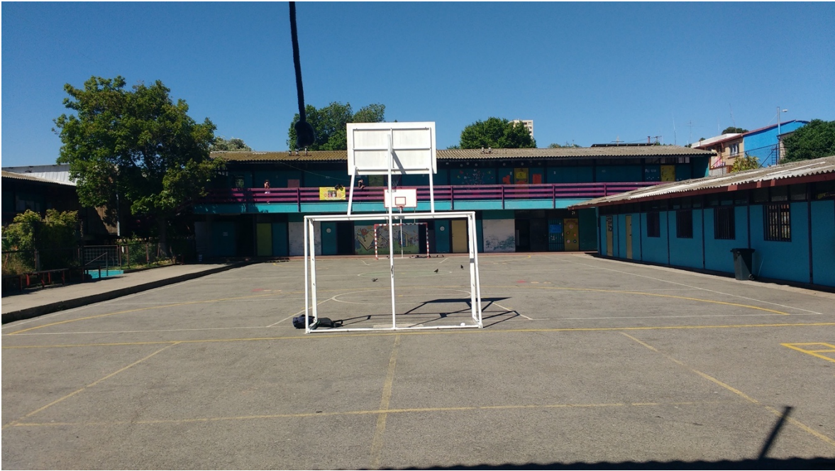
Imagen 7. Patio y jardín, Escuela Hernán Olgún, Valparaíso, 2017