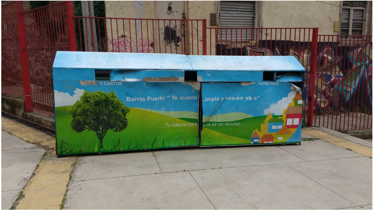
Imagen 3. Contenedor para el reciclaje de desechos, Escuelas Blas Cuevas Ramón Allende, Valparaíso, 2017