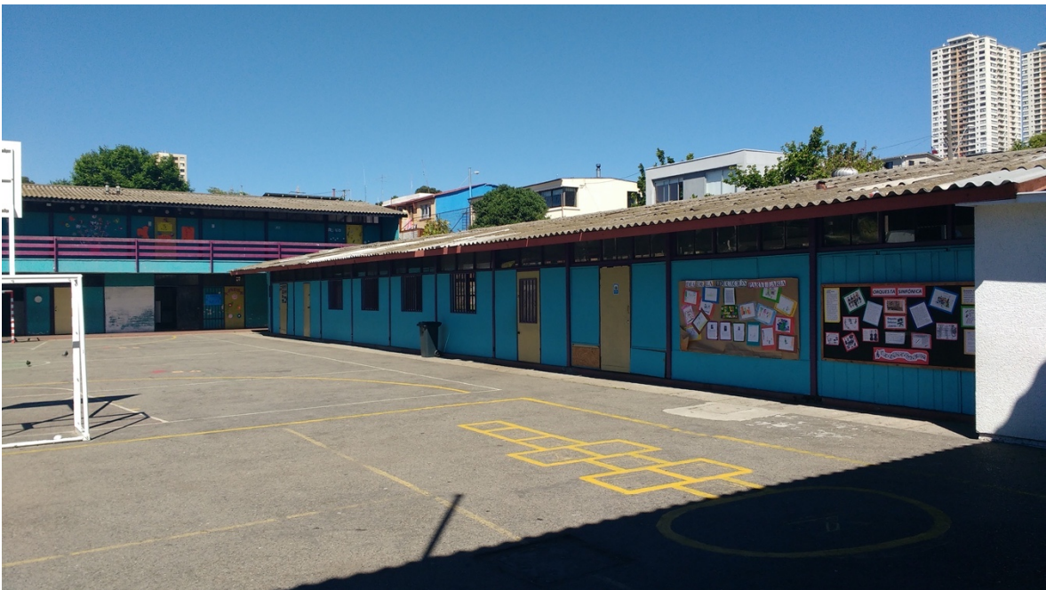
Imagen 6. Patio de las Escuela Herán Olgún, Cerro Placeres, Valparaí