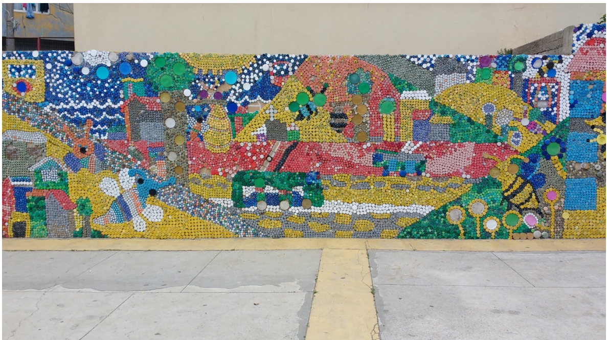
Imagen 2. Mural elaborado con tapas de bebidas, Escuela Blas Cuevas Ramón Allende, Valparaíso, 2017