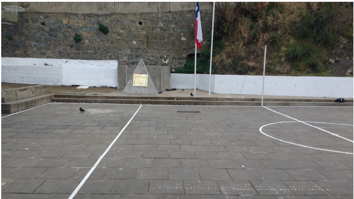
Imagen 4. Patio interior de la Escuelas Blas Cuevas Ramón Allende, Valparaíso, 2017.