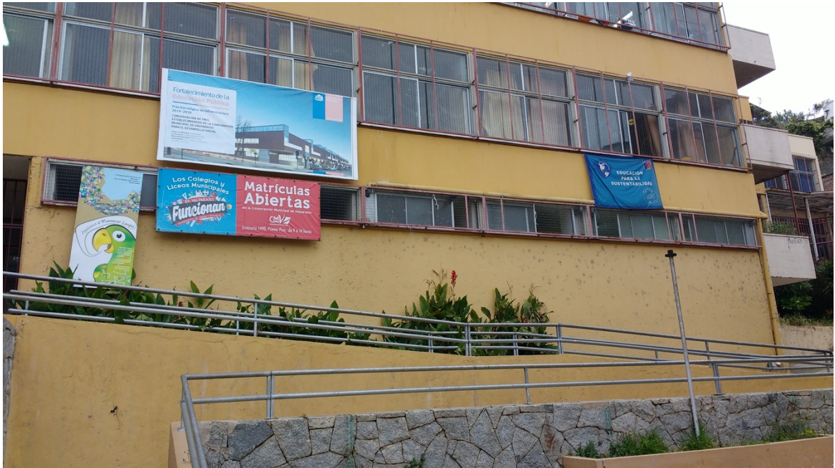
Imagen 1. Escuela Blas Cuevas Ramón Allende, Cerro Cordillera, Valparaíso, 2017